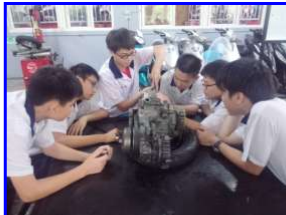
機車引擎拆解說明及操作