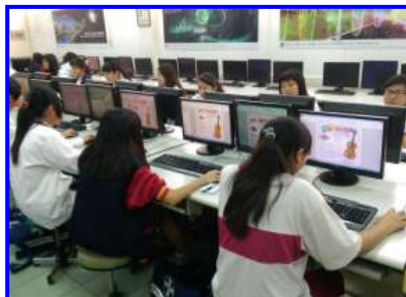
產品行銷實務-海報設計