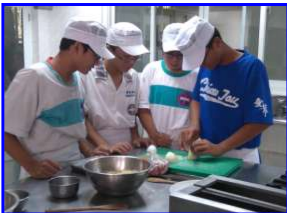
廚藝製作-中餐烹飪實作