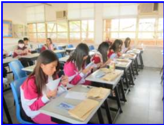
門市銷售實務-點鈔