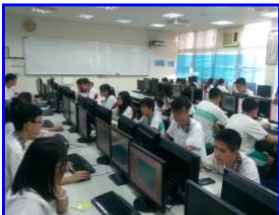
產品行銷實務-簡報設計