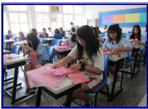
門市銷售實務-點鈔