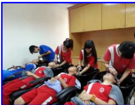
美髮實作-按摩、洗髮實作