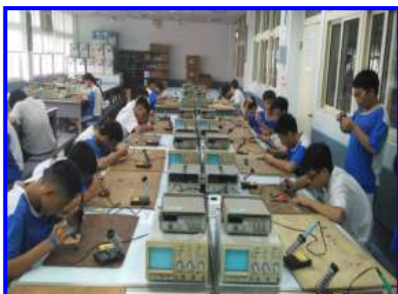
電路板及電子焊接實作