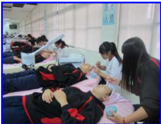
美容實作-皮膚基礎保養