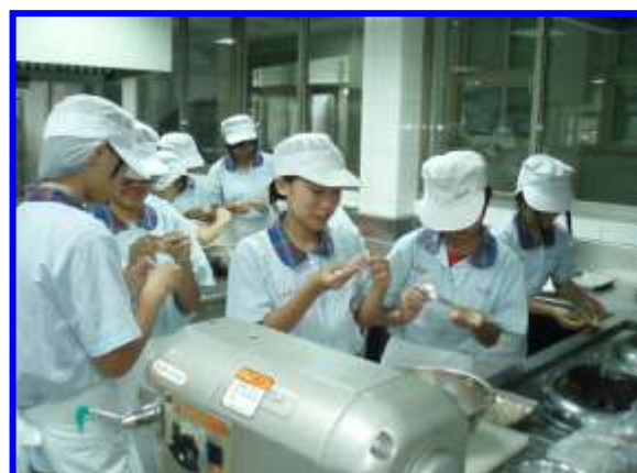
中式麵食加工-水調麵類實作-手工水餃