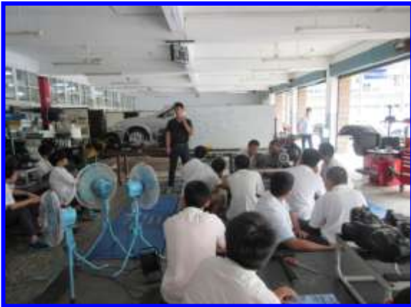
職群介紹及未來進路說明