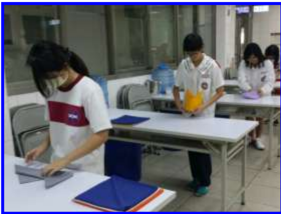
餐飲服務技術-口布摺疊