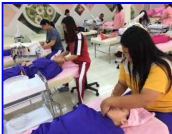
美容實作-臉部按摩技巧