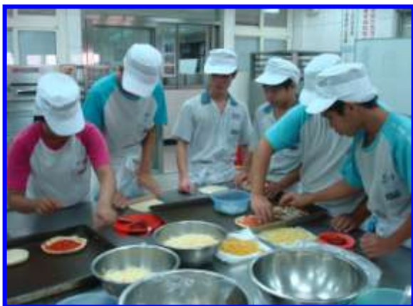
中式麵食加工-發酵麵類-pizza 製作