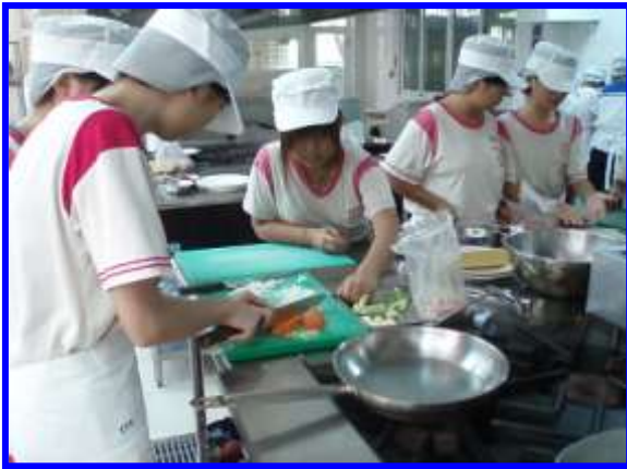
廚藝製作-西餐烹飪實作