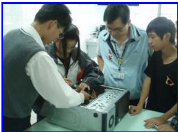
電腦硬體裝修實作