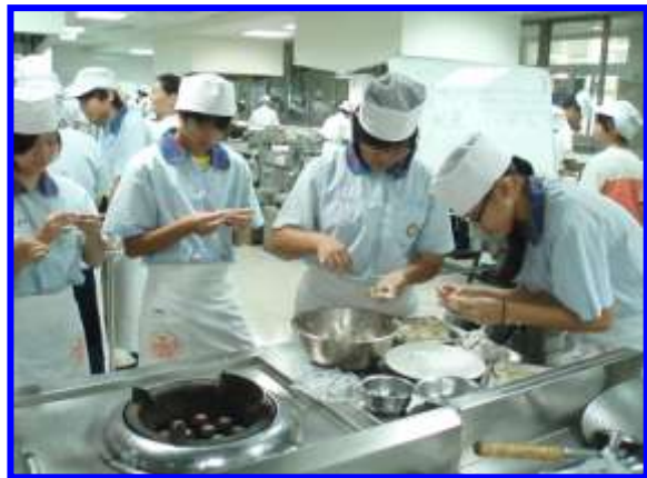
廚藝製作-中餐烹飪實作