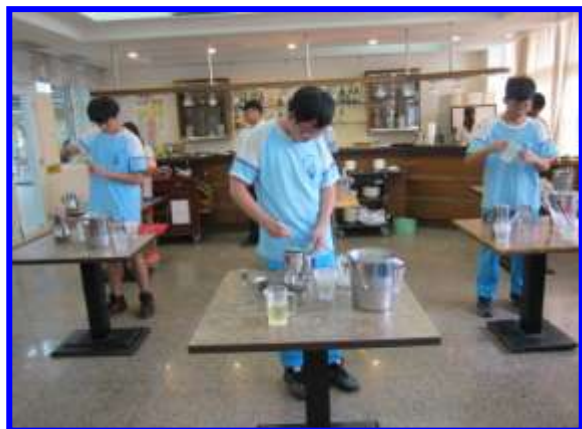
飲料調製實務-沖泡飲調製作技巧