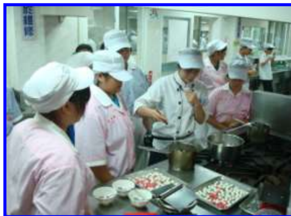
中式米食加工-米漿型製作-紅豆湯圓