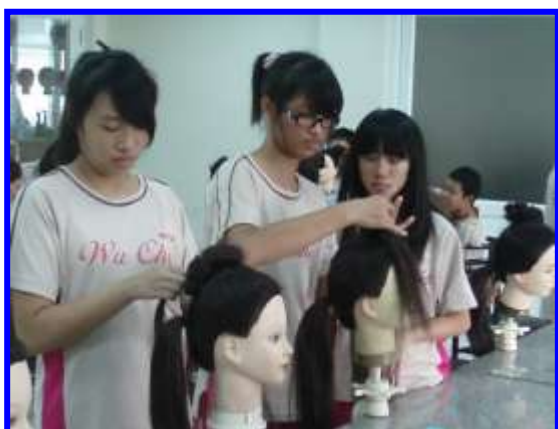
美髮實作-編髮技巧