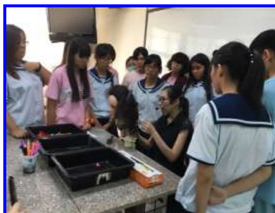
美髮實作-電棒髮型設計技巧