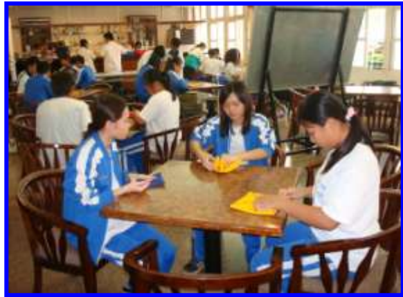
餐飲服務技術-口布摺疊