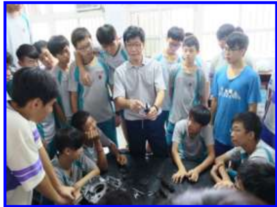
引擎變速箱拆解說明及操作