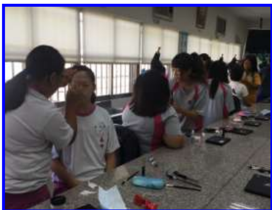
美容實作-認識化妝技巧