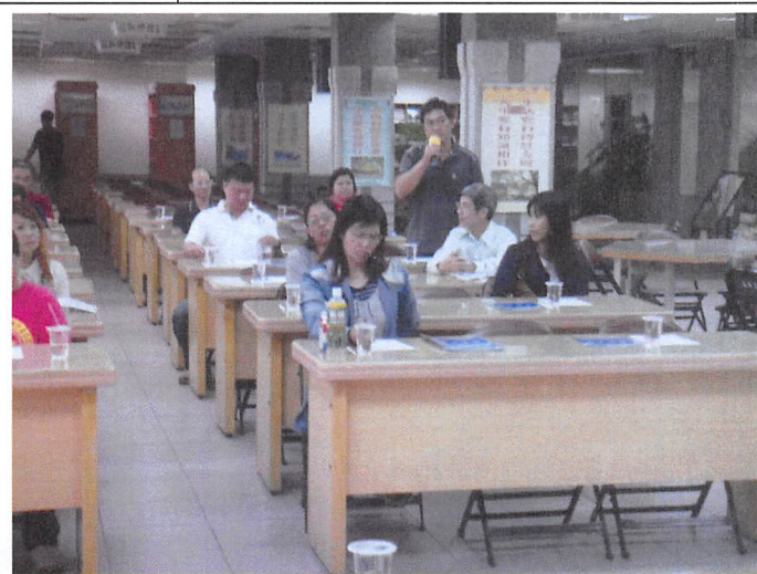
照片說明 家長代表發言建議