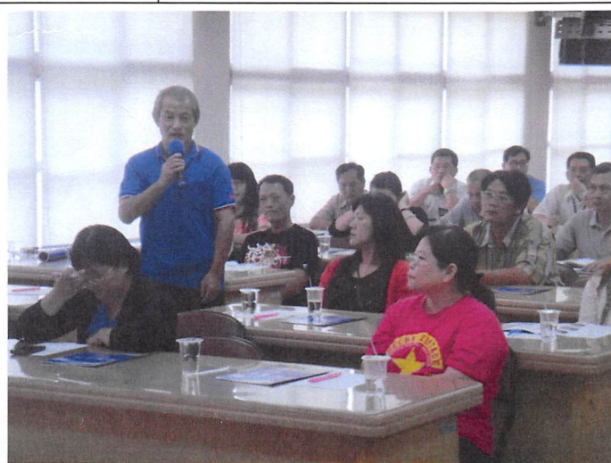
照片說明 家長代表發言建議