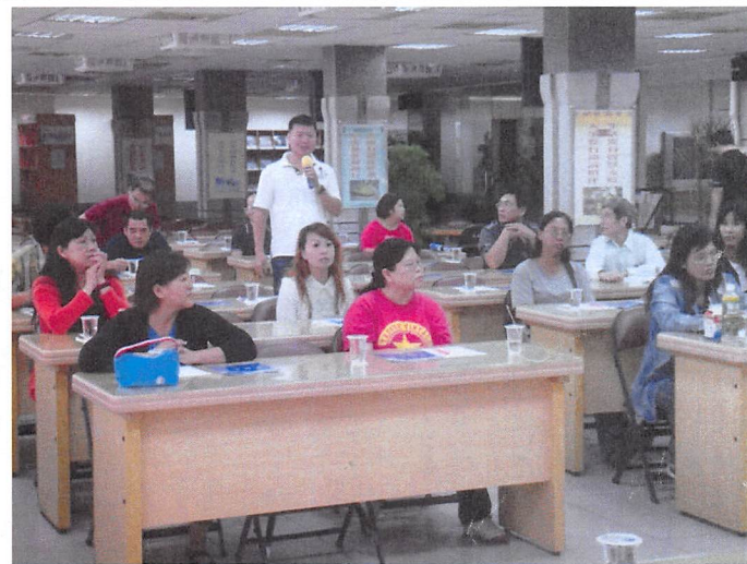
照片說明 家長代表發言建議