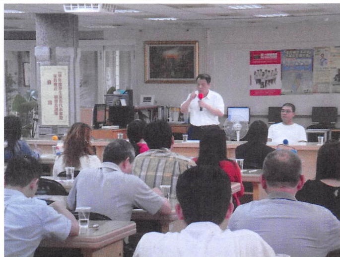
照片說明 校長報告學校狀況及回答代表意見