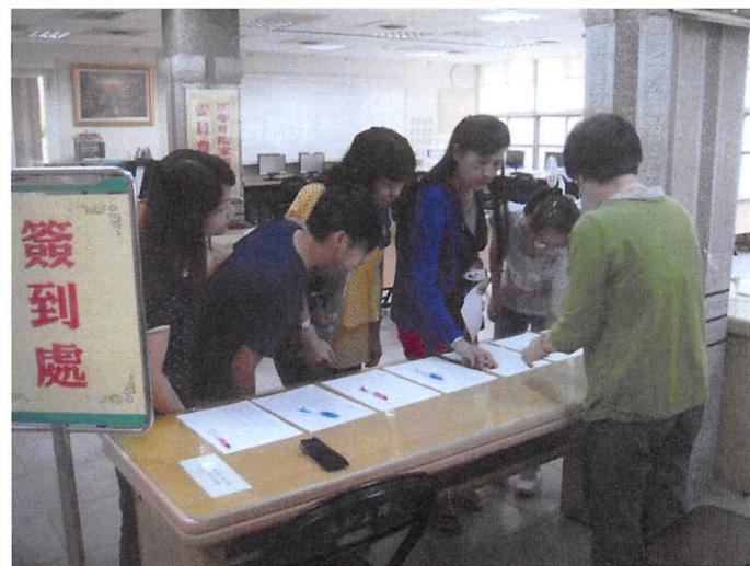
照片說明 家長代表簽到