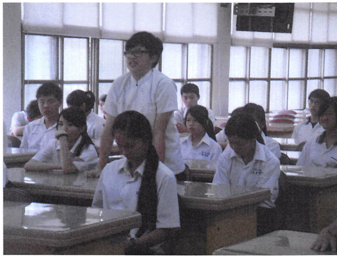
照片說明 社長發言情形