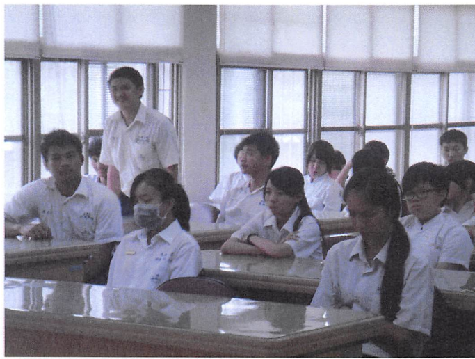
照片說明 社長發言情形