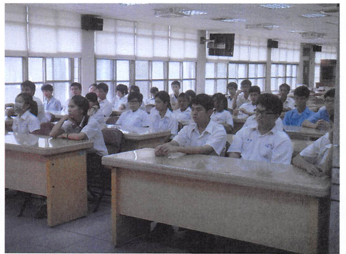
照片說明 座談會實施情形