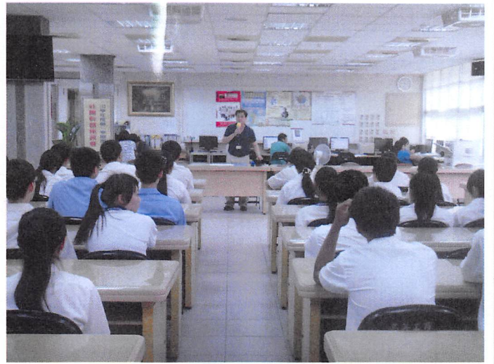
照片說明 訓育組長說明座談會的目的