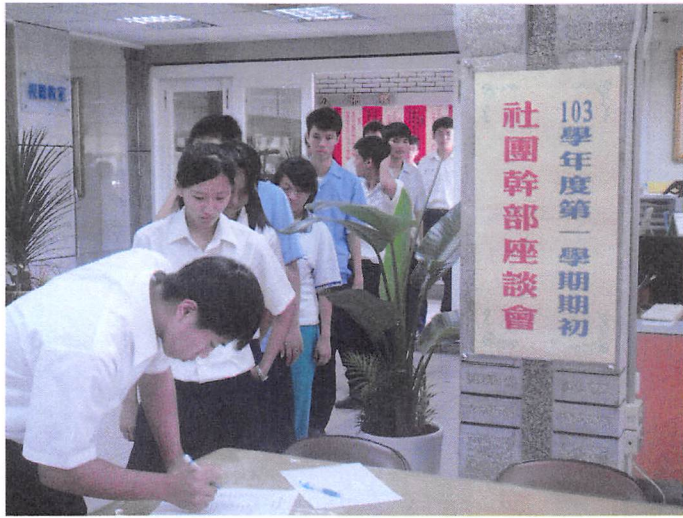
照片說明 社長報到簽名