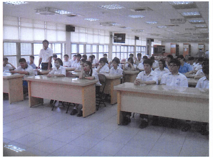
照片說明 社長發言情形