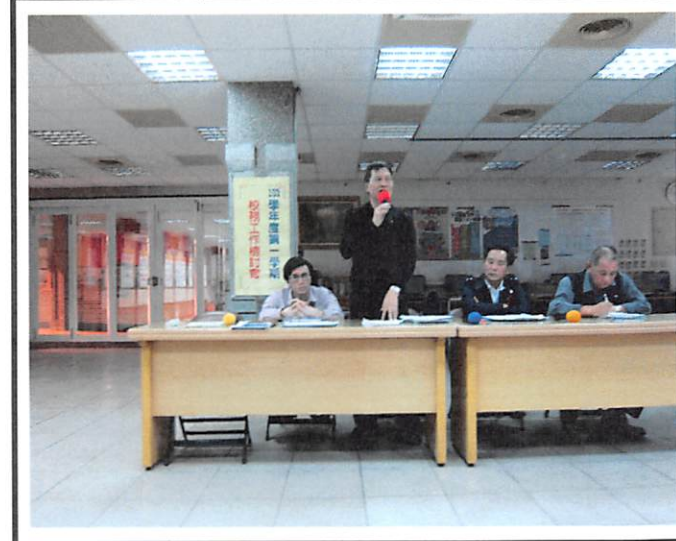
照片說明 實習處工作檢討報告