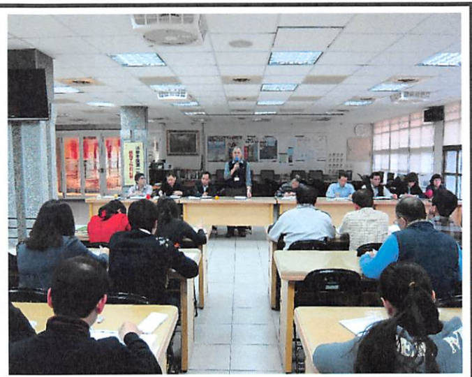
照片說明 學務處工作檢討報告