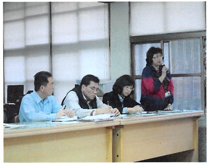
照片說明 進修學校工作檢討報告