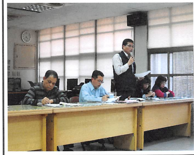
照片說明 總務處工作檢討報告