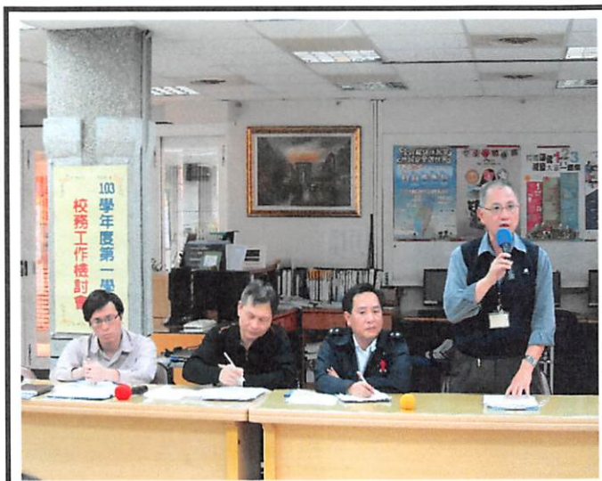
照片說明 學務處工作檢討報告