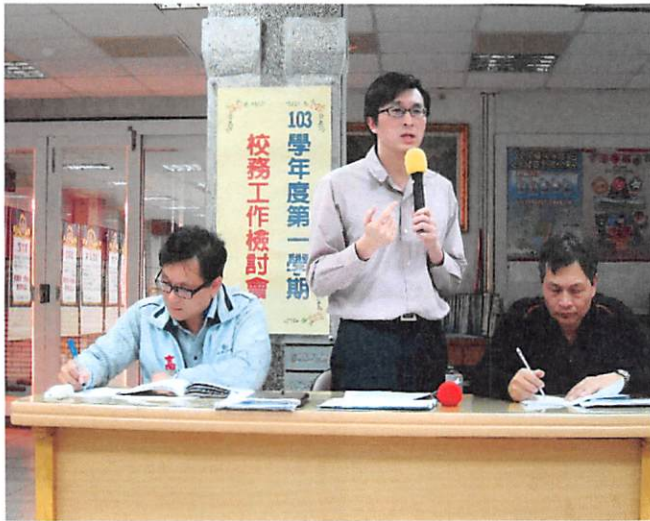
照片說明 輔導室工作檢討報告