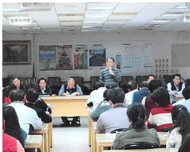
照片說明 校長整合各處室工作檢討要點