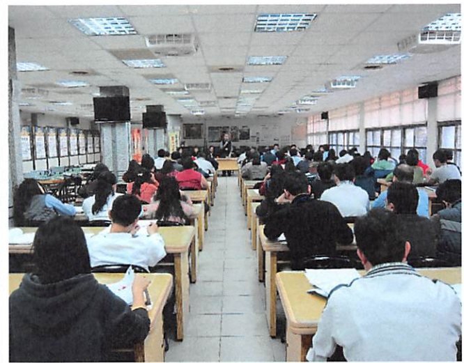
照片說明 全校職員專心聆聽