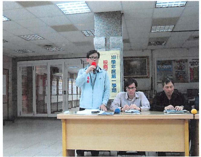
照片說明 人事室工作檢討報告