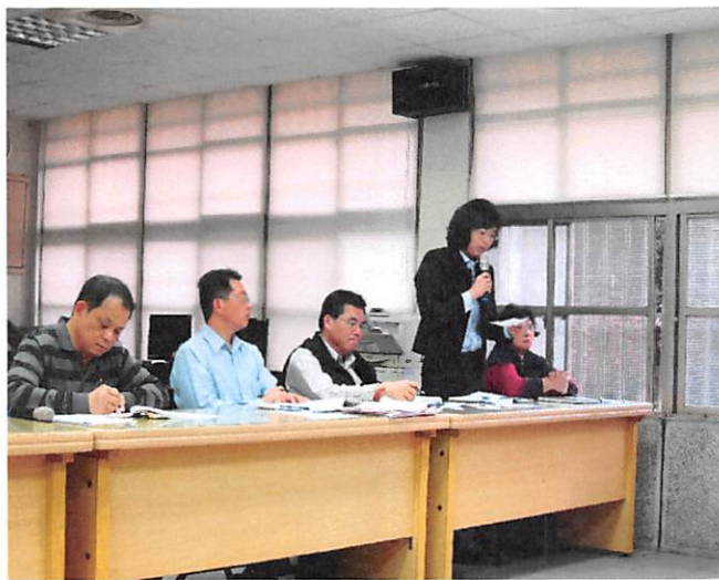
照片說明 會計室工作檢討報告