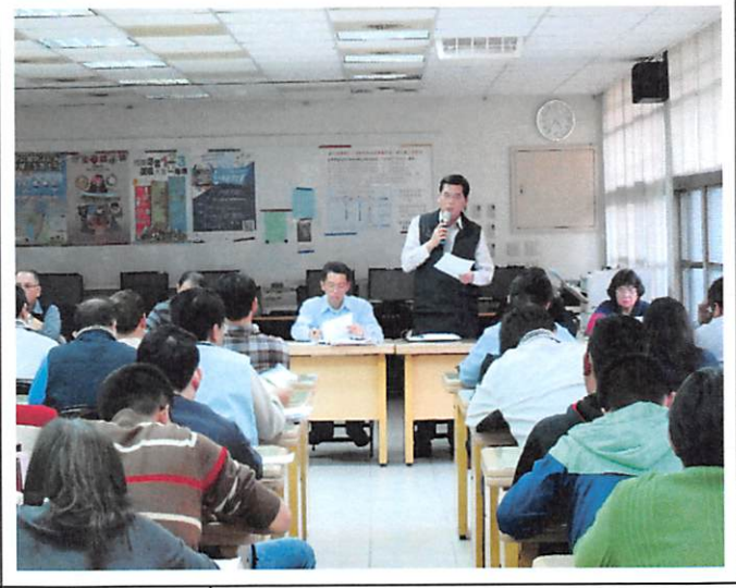
照片說明 總務處工作檢討報告