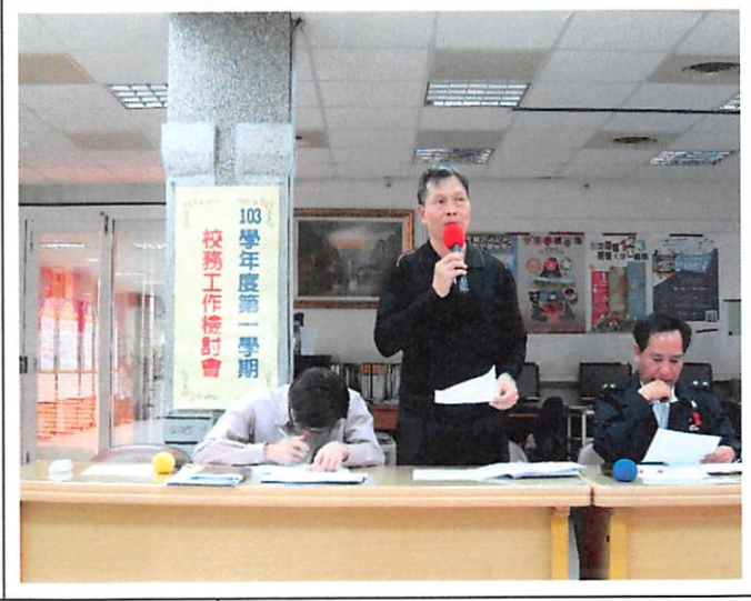
照片說明 實習處工作檢討報告