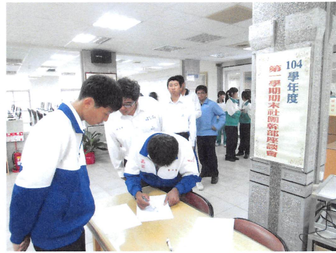
照片說明 社長報到簽名