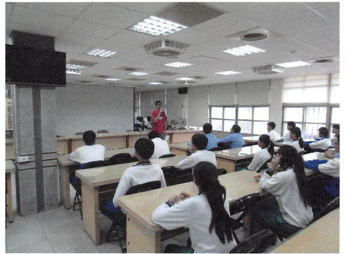
照片說明 座談會開會情形