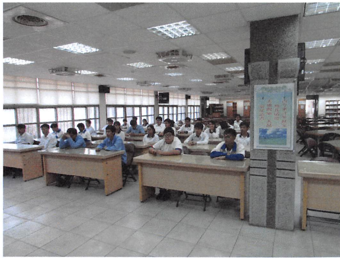
照片說明 座談會開會情形