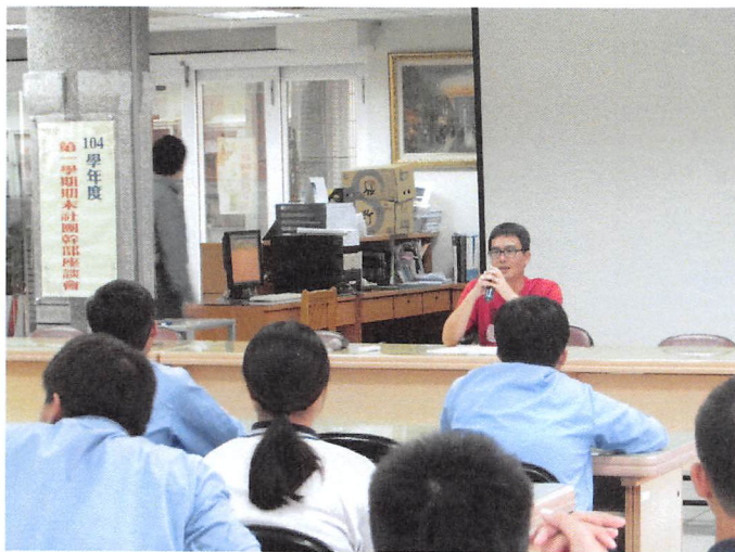
照片說明 座談會開會情形