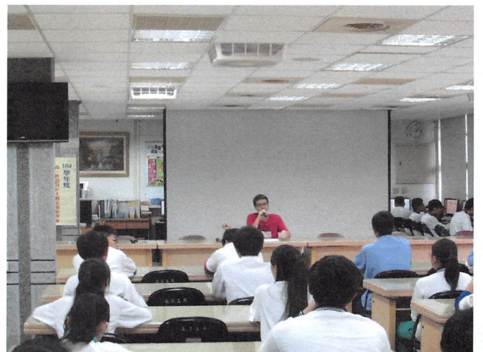
照片說明 座談會開會情形