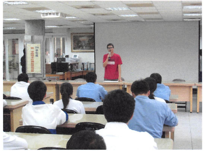
照片說明 訓育組長說明座談會的目的