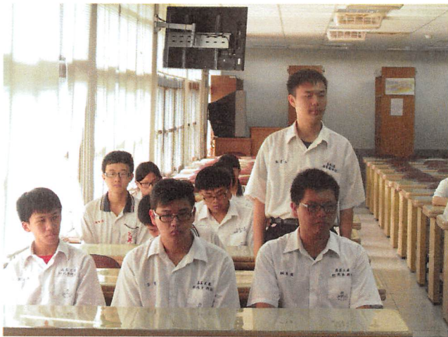
照片說明 同學回報班級上課狀況