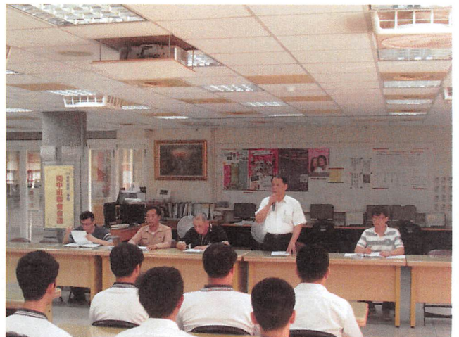
照片說明 校長對各班服務股長進行勉勵