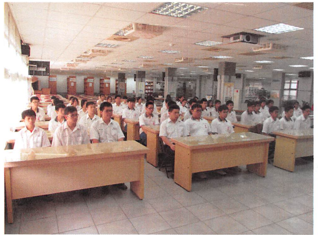
照片說明 各班同學代表出席