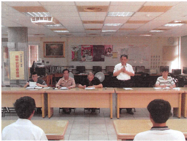
照片說明 各處室主任參與會議