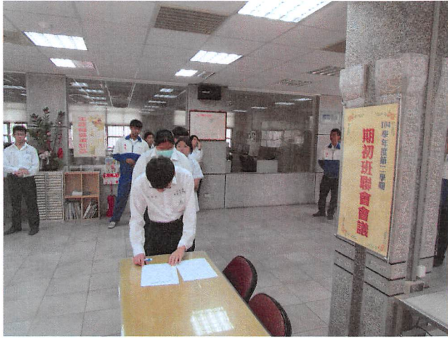
照片說明 班聯會代表報到簽名