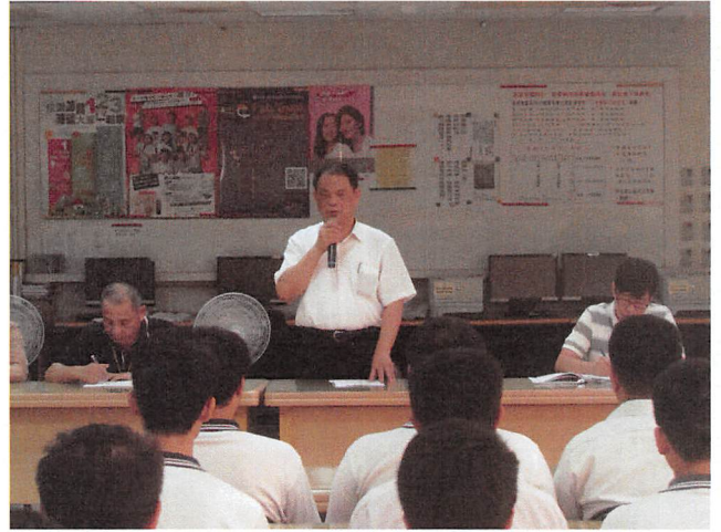
照片說明 由校長主持班聯會議