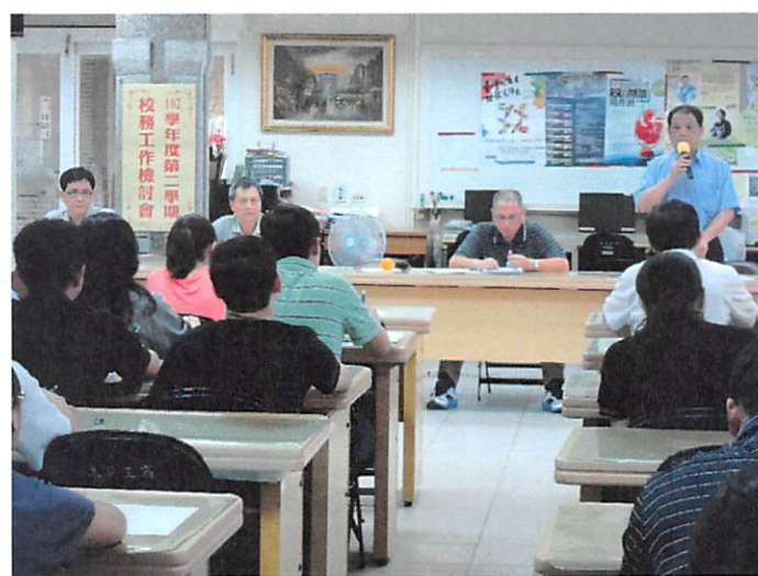
照片說明 校長主持校務工作檢討會