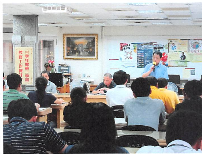
照片說明 校長整合各處室工作檢討要點