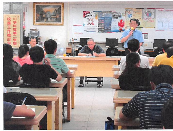
照片說明 全校職員專心聆聽