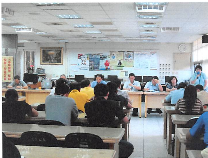
照片說明 進修學校工作檢討報告