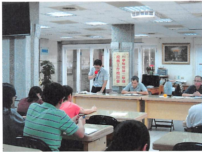
照片說明 人事室工作檢討報告