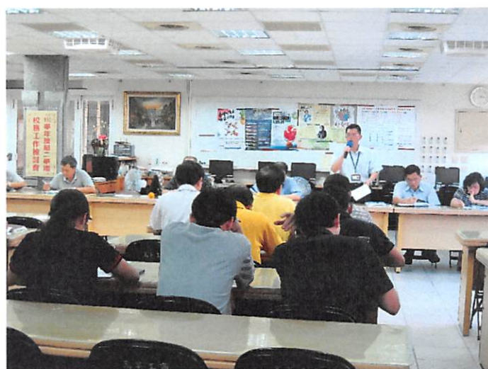
照片說明 校長主持校務工作檢討會