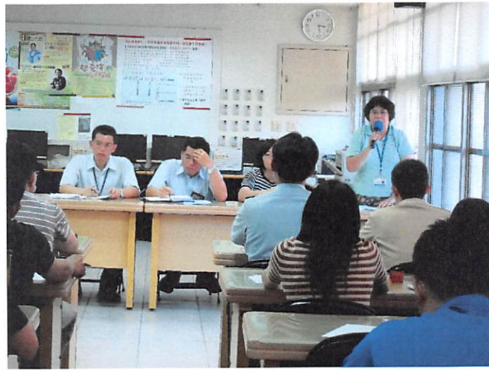
照片說明 進修學校工作檢討報告