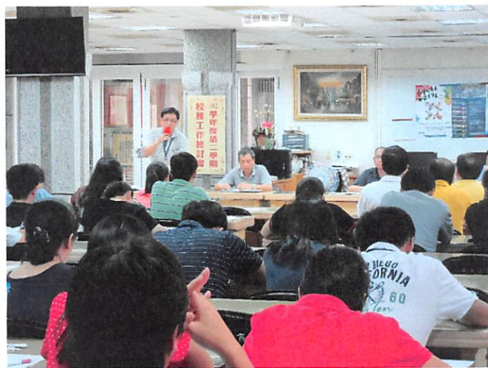
照片說明 人事室工作檢討報告