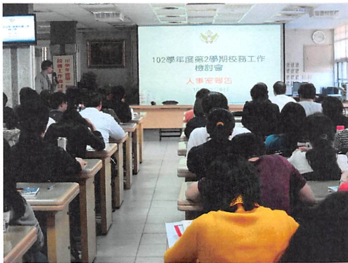
照片說明 人事室工作檢討報告