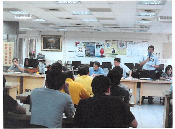
照片說明 總務處工作檢討報告