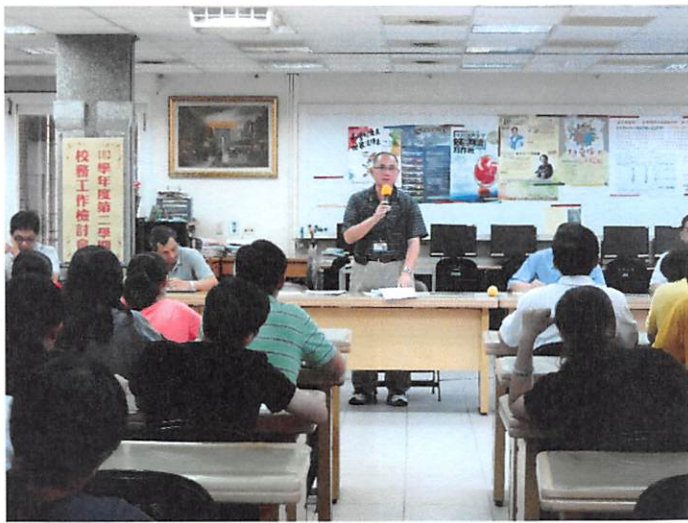
照片說明 學務處工作檢討報告