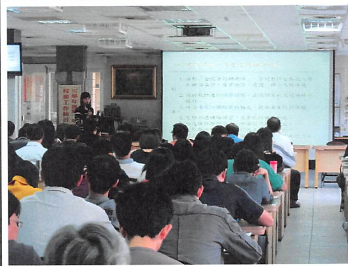
照片說明 輔導室工作檢討報告