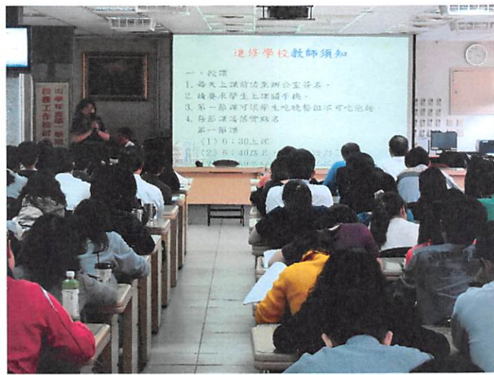
照片說明 進修學校工作檢討報告