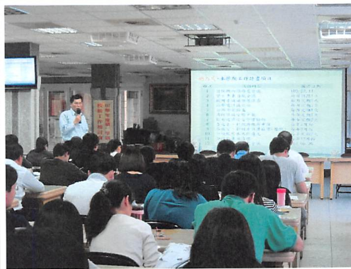
照片說明 總務處工作檢討報告