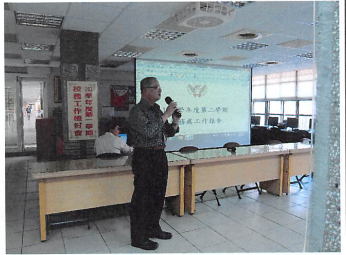
照片說明 學務處工作檢討報告