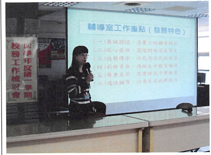
照片說明 輔導室工作檢討報告