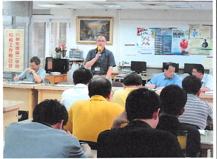
照片說明 學務處工作檢討報告