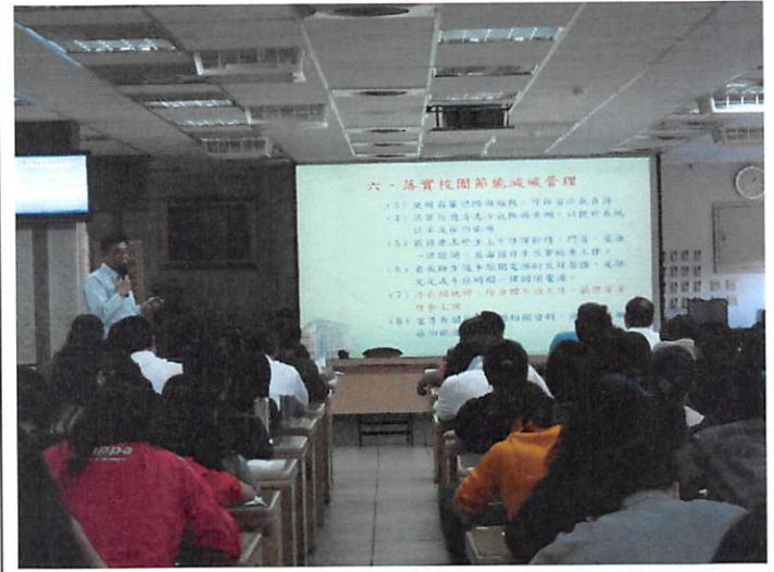
照片說明 總務處工作檢討報告