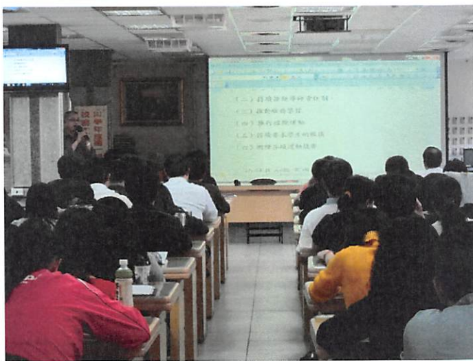
照片說明 學務處工作檢討報告