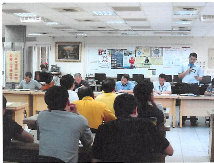
照片說明 總務處工作檢討報告