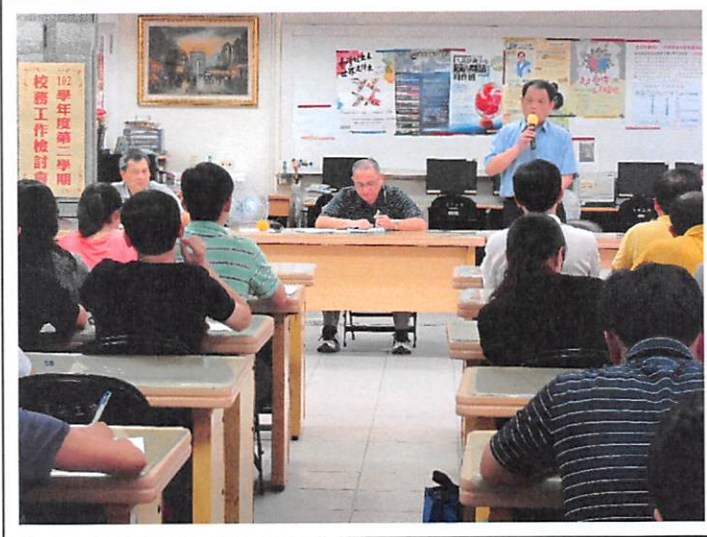
照片說明 校長整合各處室工作檢討要點