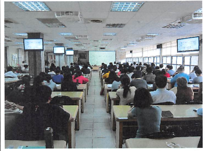
照片說明 全校職員專心聆聽