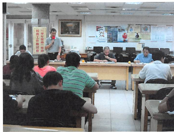
照片說明 實習處工作檢討報告