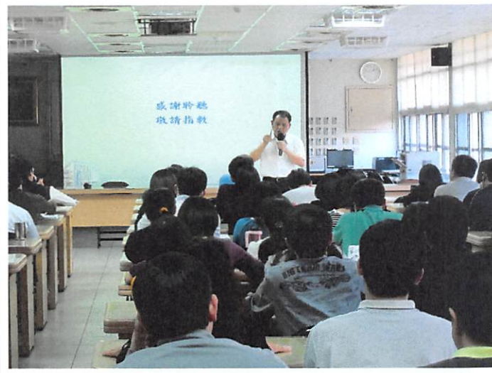
照片說明 校長整合各處室工作檢討要點