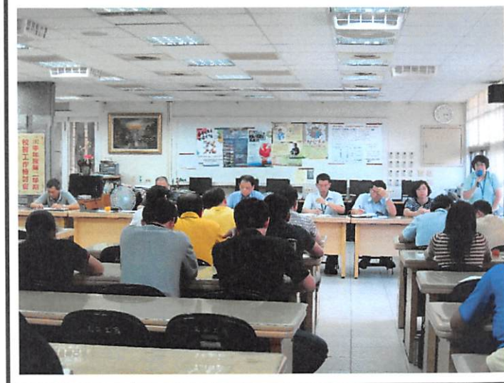
照片說明 人事室工作檢討報告