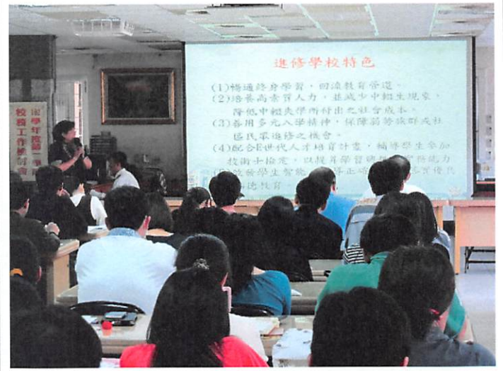
照片說明 進修學校工作檢討報告