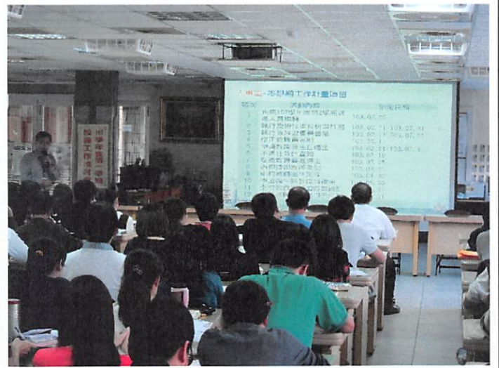
照片說明 人事室工作檢討報告