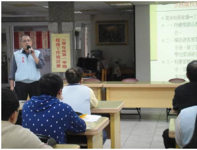
照片說明 學務處工作檢討報告