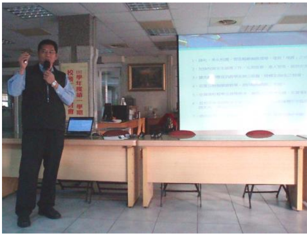
照片說明 總務處工作檢討報告