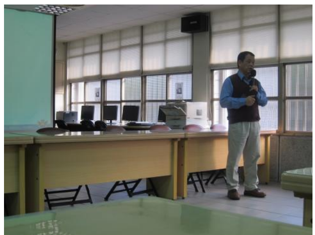
照片說明 校長整合各處室工作檢討要點