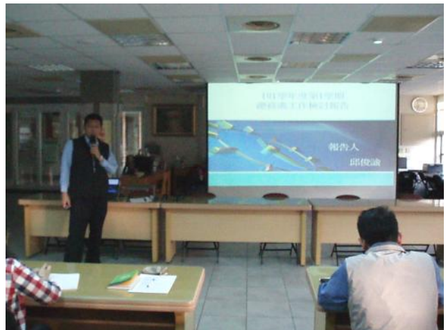
照片說明 總務處工作檢討報告