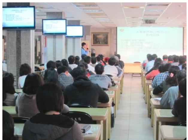
照片說明 人事室工作檢討報告