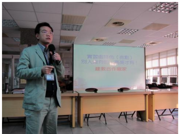
照片說明 實習處工作檢討報告