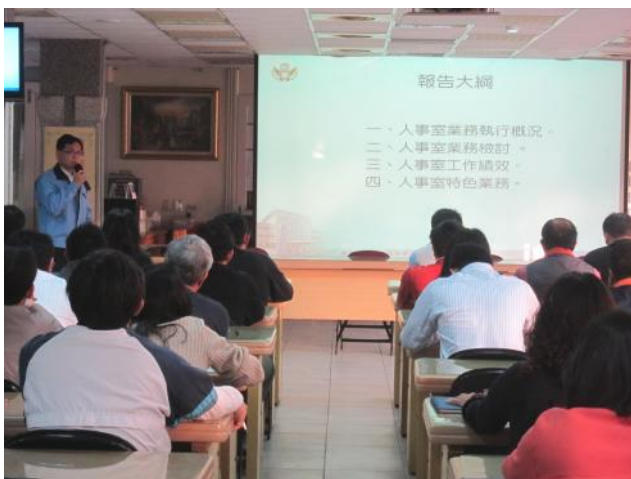
照片說明 人事室工作檢討報告