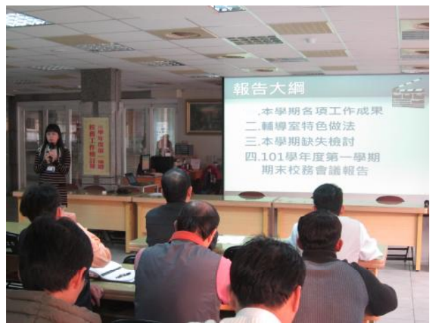
照片說明 輔導室工作檢討報告