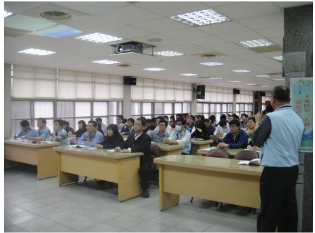
照片說明 學務處工作檢討報告