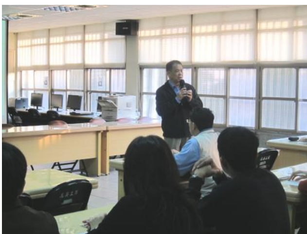
照片說明 校長主持綜合座談