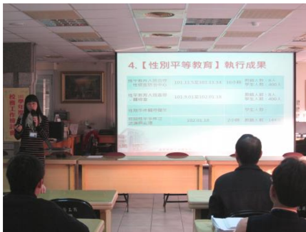
照片說明 輔導室工作檢討報告