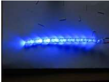
圖 7 LED 燈串連測試