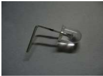
圖 4 LED 燈加工完成