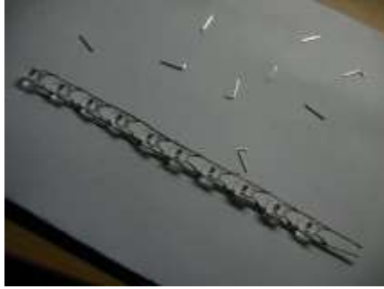
圖 6 LED 燈串連加工完成