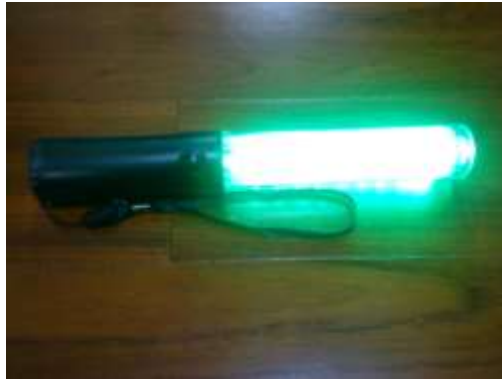
圖 10 LED 指揮棒測試 1