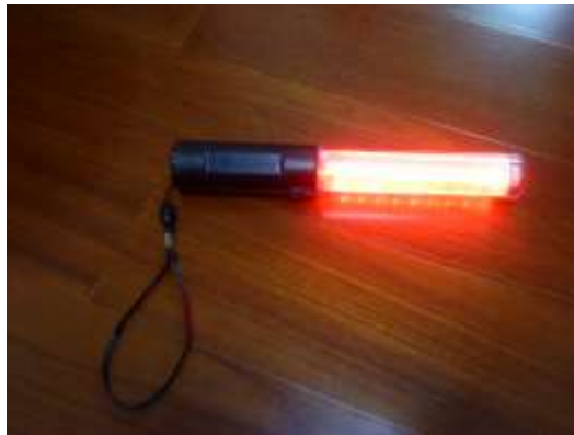
圖 11 LED 指揮棒測試