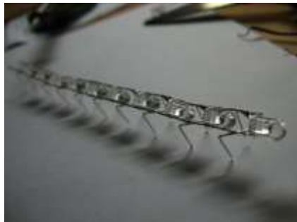
圖 5 LED 燈串連加工