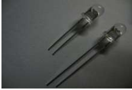
圖 2 LED 燈