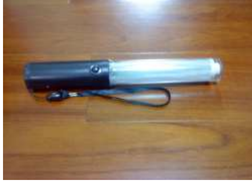
圖 9 LED 指揮棒完成