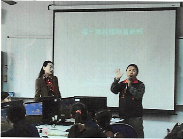
照片說明 講師開場，自我介紹