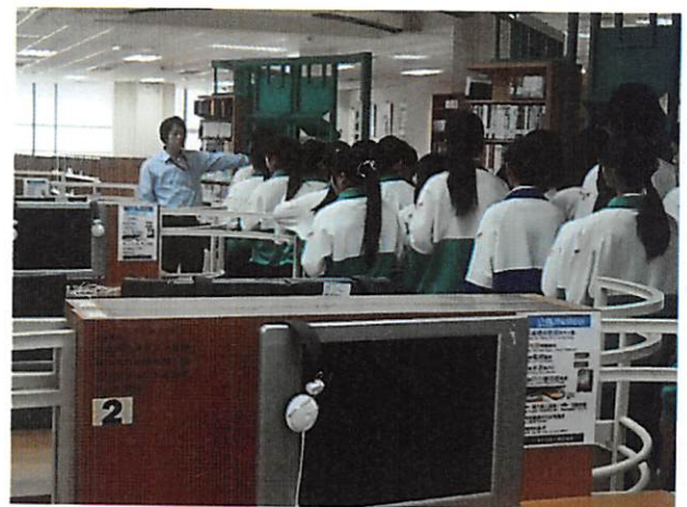
照片說明 介紹校內教學資源