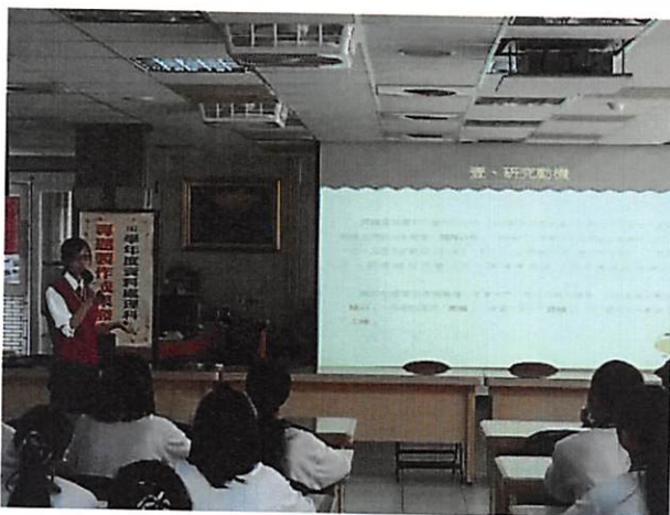
照片說明 各組發表情形