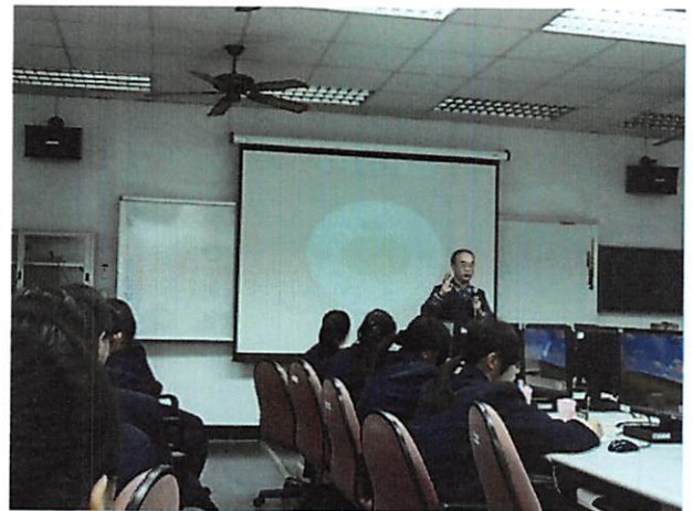
照片說明 講師介紹電子商務七流