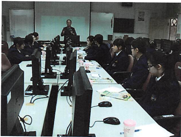
照片說明 講師說明課程內容