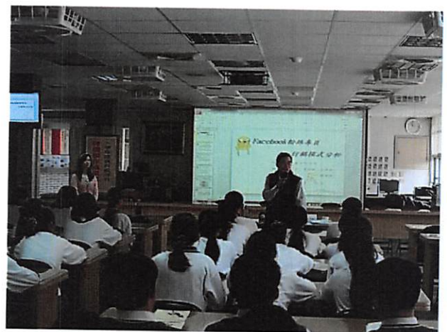
照片說明 教授講評，給予學生鼓勵