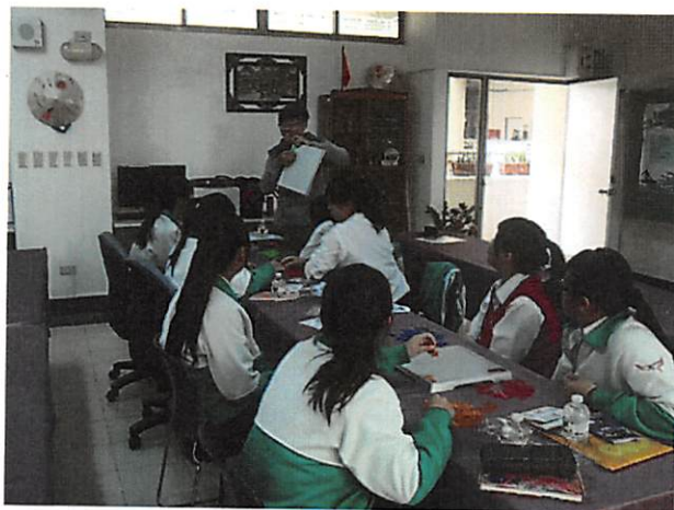
照片說明 益智策略遊戲介紹