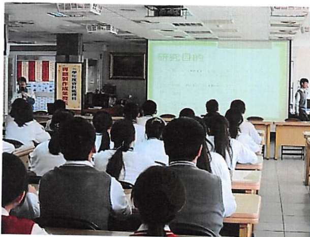
照片說明 各組發表情形