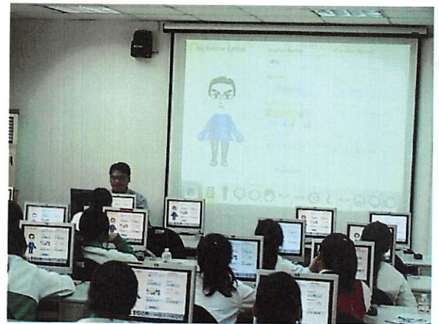
照片說明 講師介紹 Flash 動畫應用