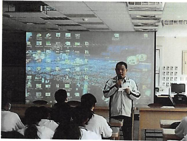
照片說明 校長開場，介紹指導教授