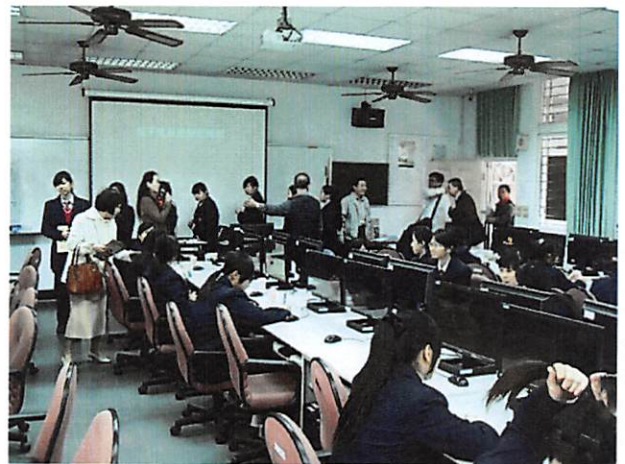
照片說明 介紹講師團隊