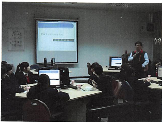
照片說明 網路資訊安全攻防介紹