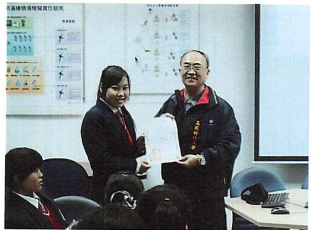
照片說明 講師頒發研習證書