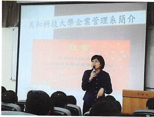
照片說明 講師開場，自我介紹