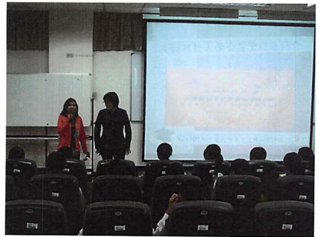
照片說明 介紹講師團隊