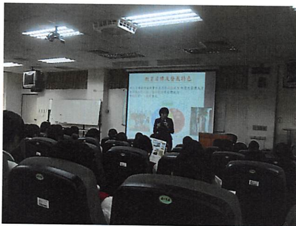
照片說明 講師說明課程內容