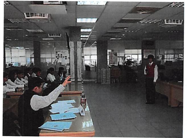
照片說明 教授針對第一組同學發表內容提供建議