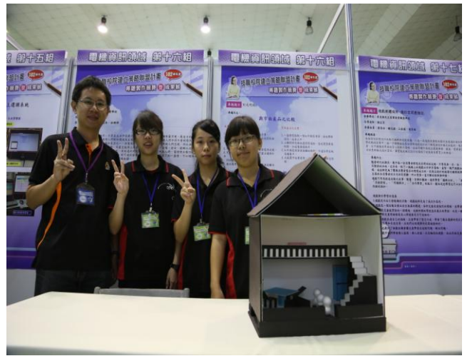
照片說明 參賽學生與指導教師比賽會場合影