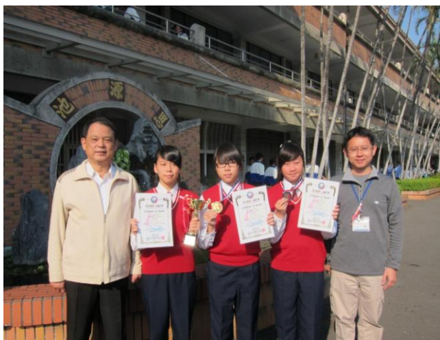
照片說明 校長與參賽學生、指導教師合影