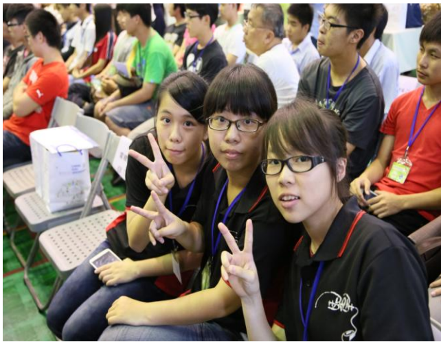
照片說明 參賽學生比賽會場合影