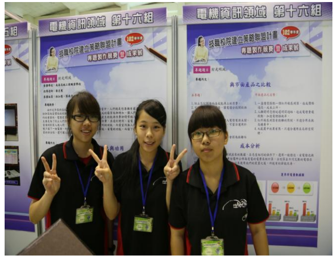
照片說明 參賽學生比賽會場合影