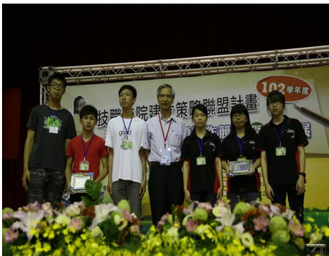
照片說明 頒獎典禮