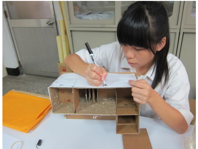
照片說明 參賽學生作品模型設計