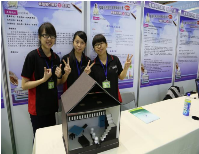
照片說明 參賽學生比賽會場作品佈置