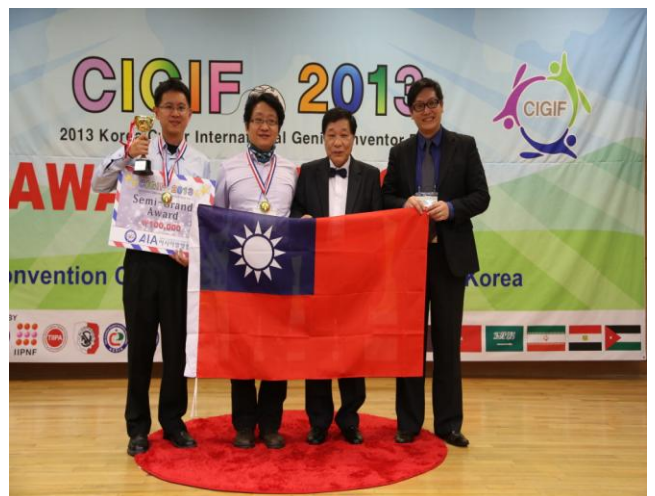
照片說明 韓國頒獎典禮