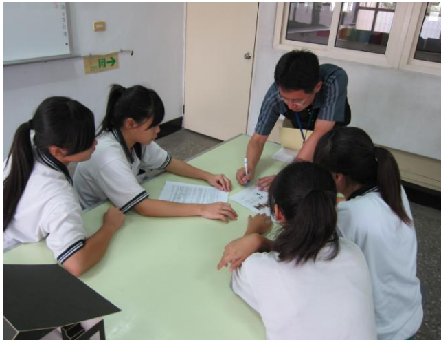
照片說明 參賽學生與指導教師問題討論