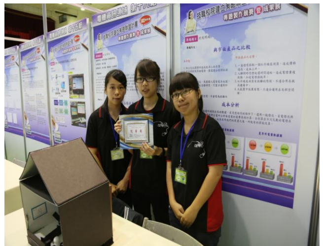
照片說明 參賽學生與優等獎牌合影