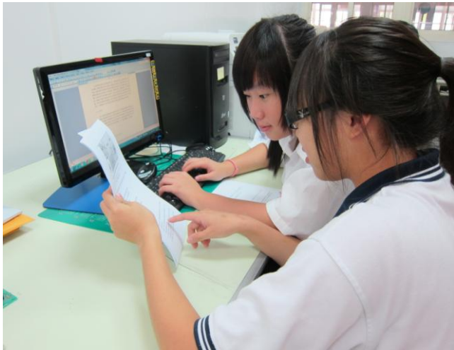
照片說明 參賽學生作品資料蒐集