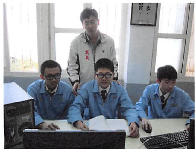
照片說明 教師輔導學生練習情形