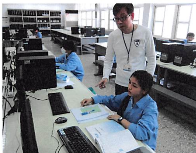
照片說明 教師輔導學生練習情形