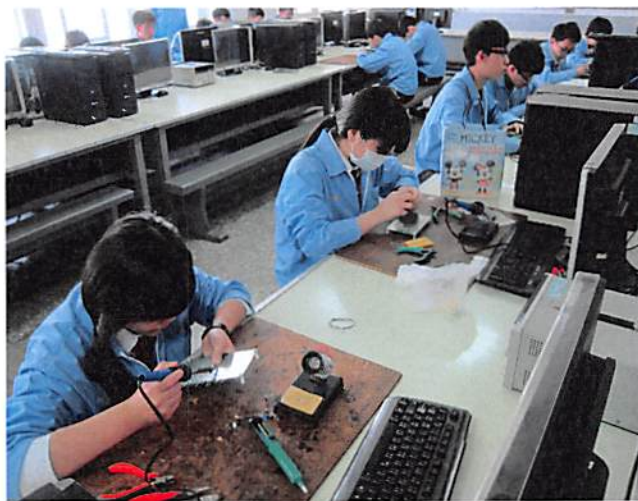
照片說明 學生模擬訓練