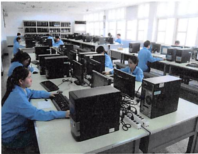
照片說明 學生模擬訓練