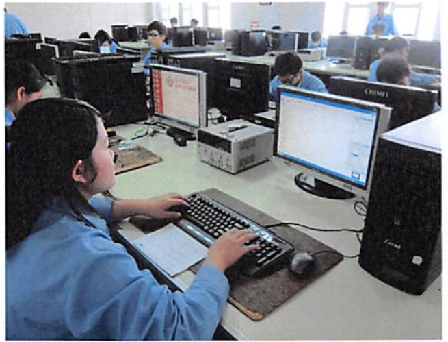
照片說明 學生模擬訓練