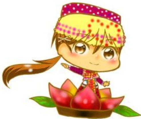
水燈節 放水燈，慶祝。