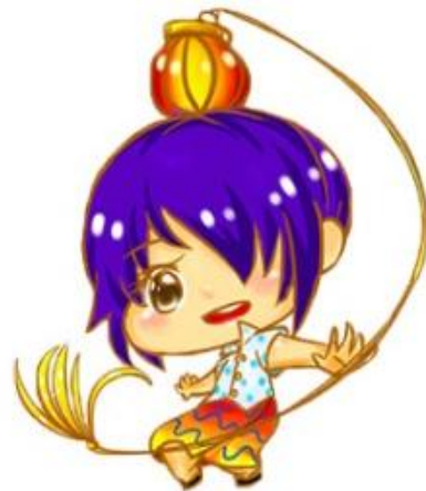
點燈節 各戶人家點燈、燈籠，夜空中還升起各式各樣的煙火，放天燈。