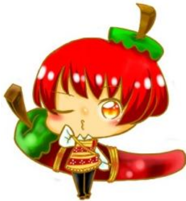
辣椒節 販賣、製作辣椒的相關產品。