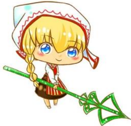
仲夏節 當天立起五月花柱，迎接夏至。