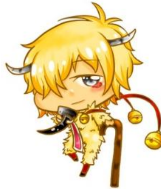
迎春嘉年華 辦妖怪遊行，迎春年。