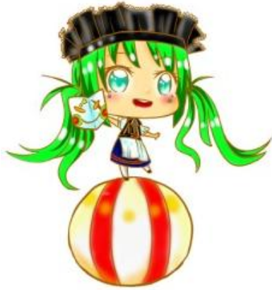
伯恩嘉年華 以面具為主題的狂歡慶典。