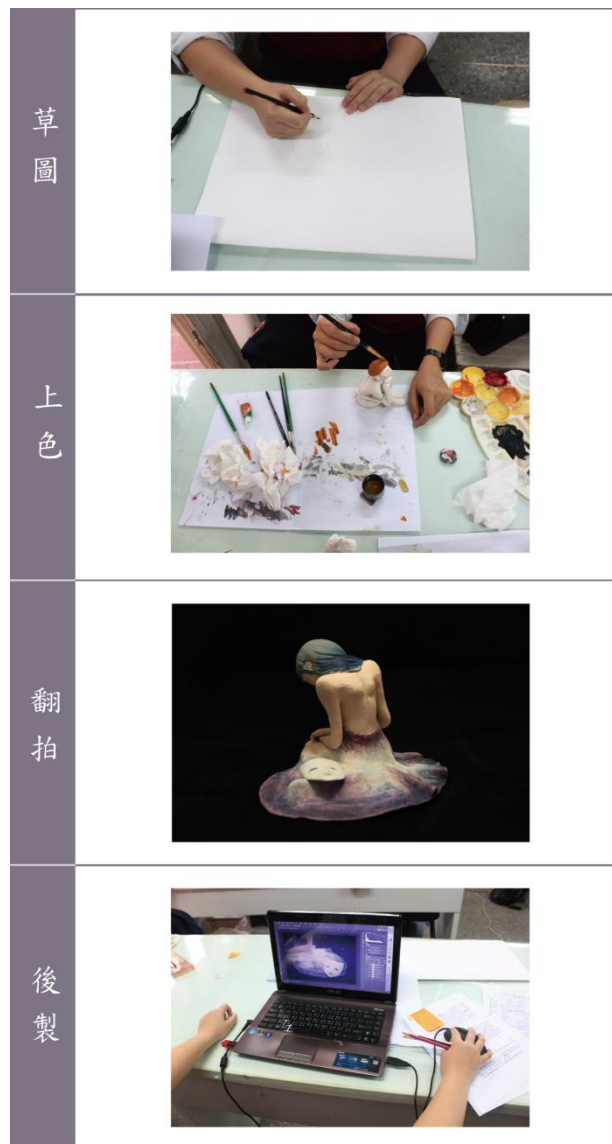
圖 2 製作過程說明