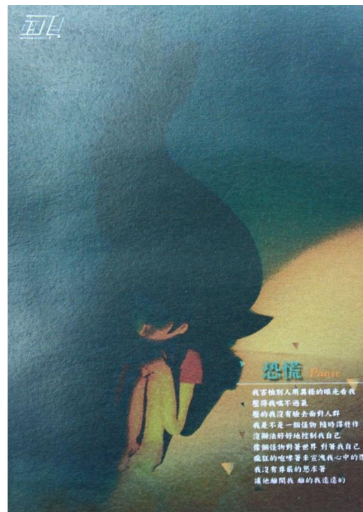
圖 16 恐慌海報