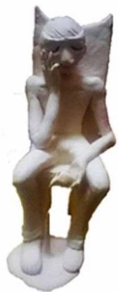
圖 4-1 草圖个

以男生坐在椅子上的姿勢，有種俯瞰的感覺，高貴的椅子、奢華的紅酒、眼罩式的面具來表現，用誇張膨脹的自信心作為主軸加以設計，胸前的三條抓痕代表著我們代表性動物-鯊魚的鰓裂，選用鯊魚是因為牠極端的神經質與容易被刺激的情緒，影子對在正後方有種又吞噬或是要爆發的感覺，以黑色和紅色系作為搭配。