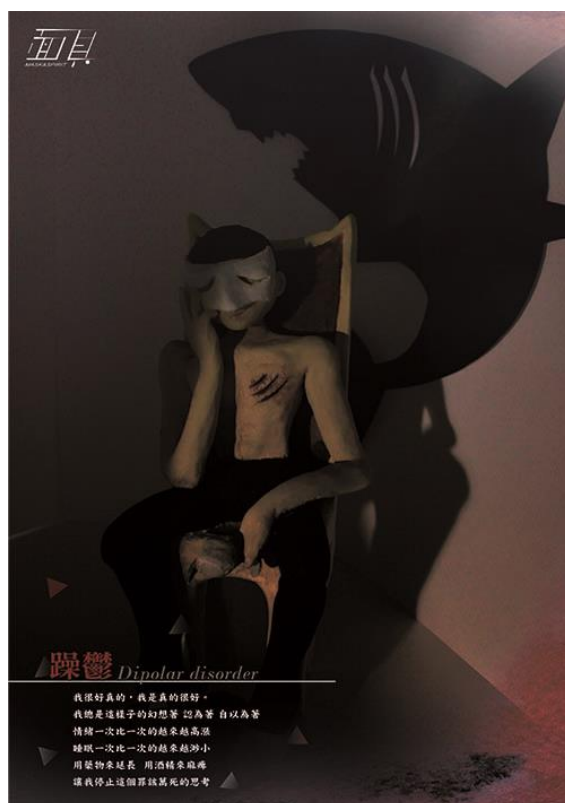
圖 4-3 成品个