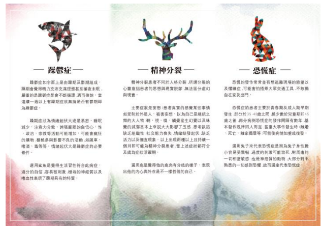
圖 10DM 正反面設計