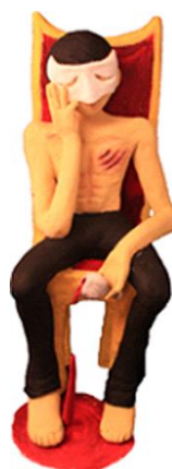
圖 4-2 原稿个