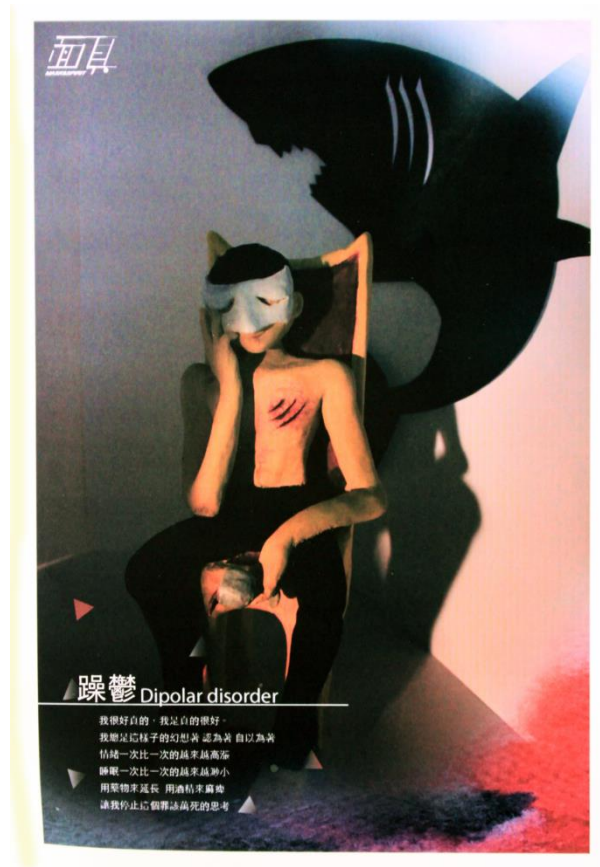
圖 15 躁鬱海報