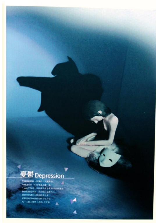
圖 14 憂鬱海報