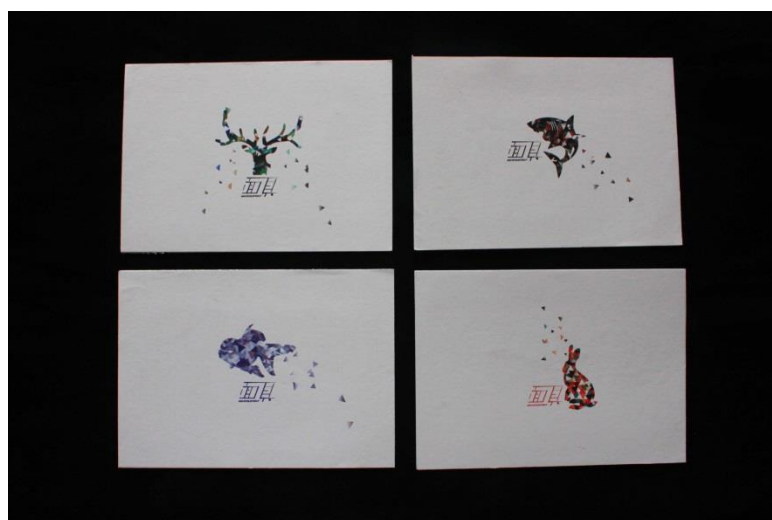
圖 13 明信片