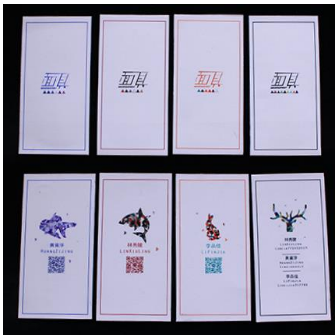
圖 12 名片正反設計