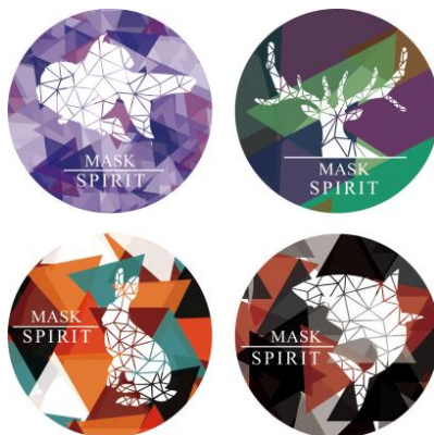
圖 11 胸章設計