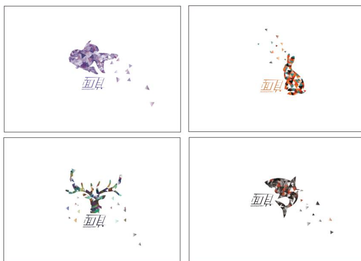
圖 9 明信片正面設計