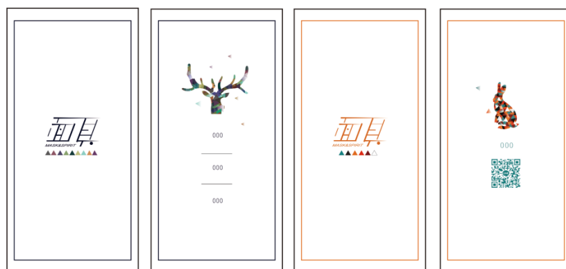
圖 8-2 名片正反面設計