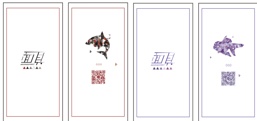
圖 8-1 名片正反面設計