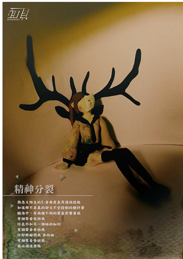
圖 6-3 成品个