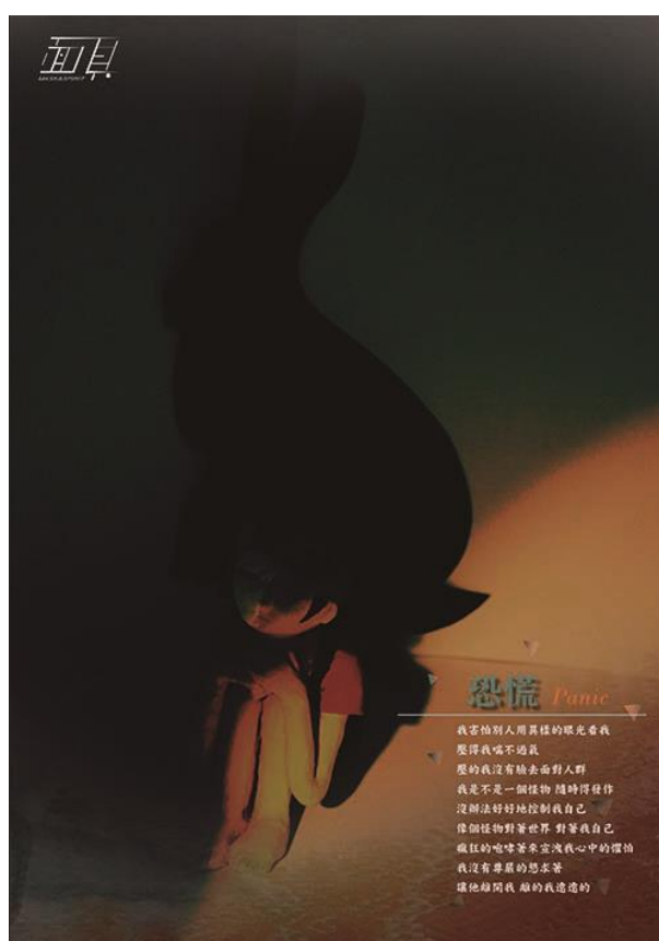
圖 5-3 成品