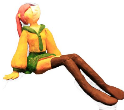
圖 6-2 原稿个