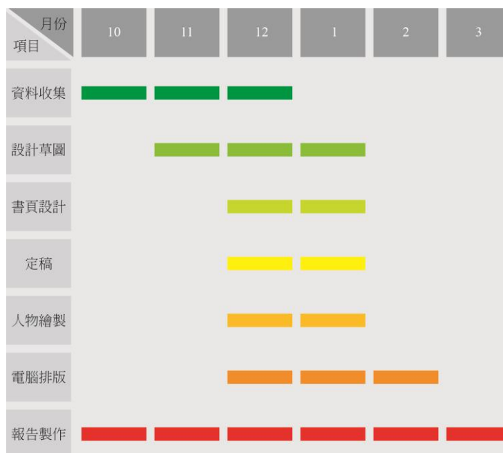
圖 10 工作時刻表