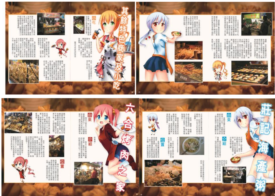
圖 13 內頁設計