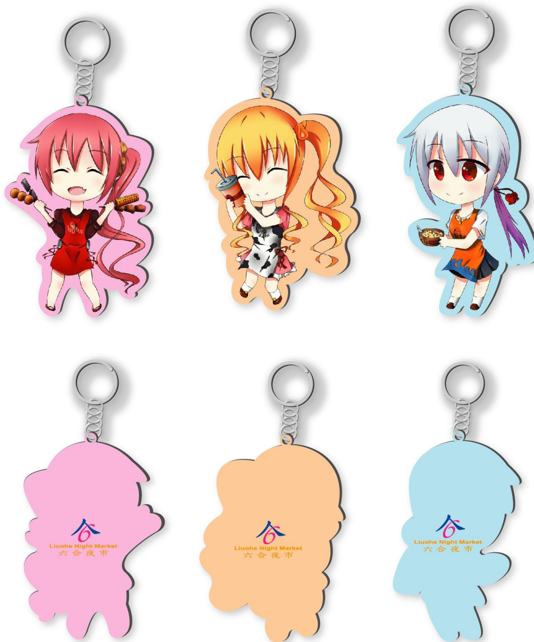
圖 9 吊飾設計