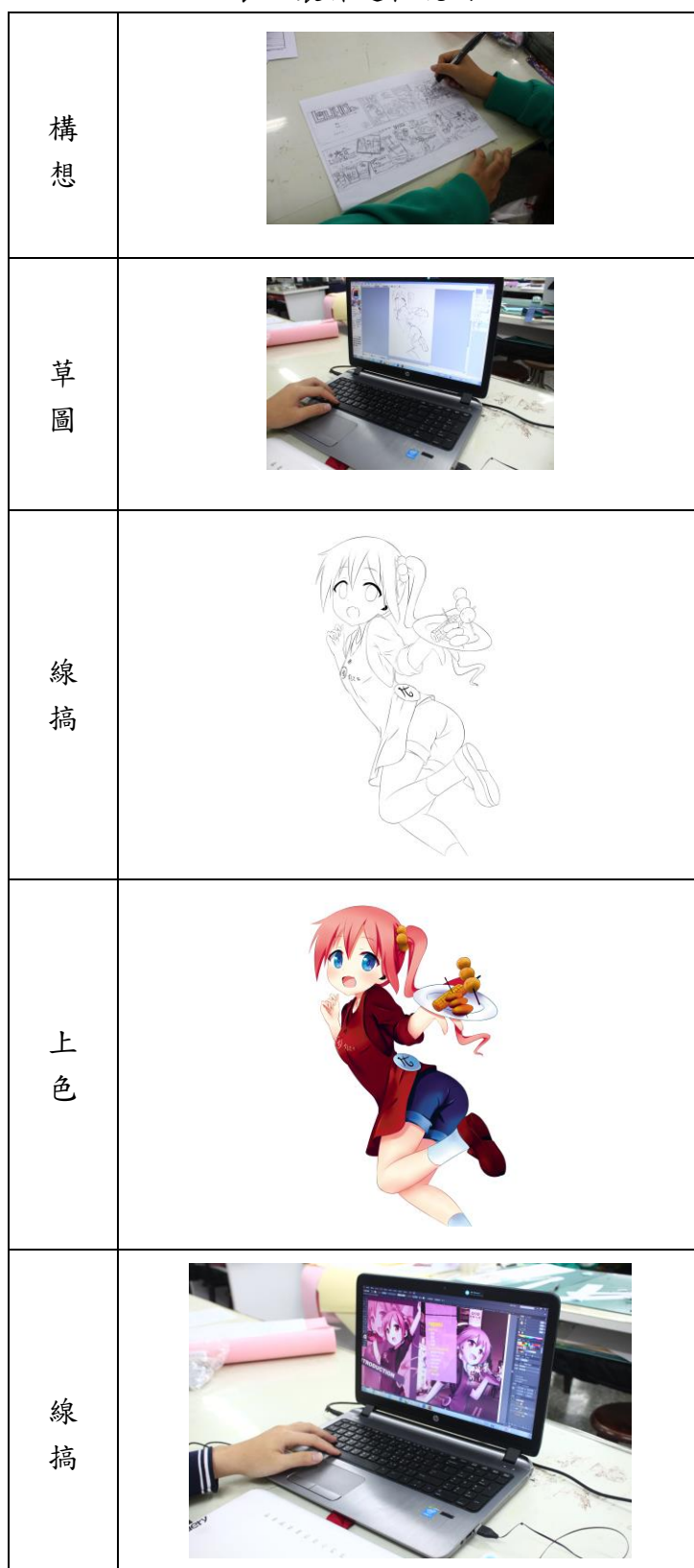
表 3 製作過程說明