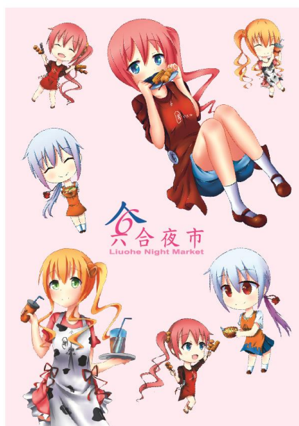
圖 11 貼紙設計