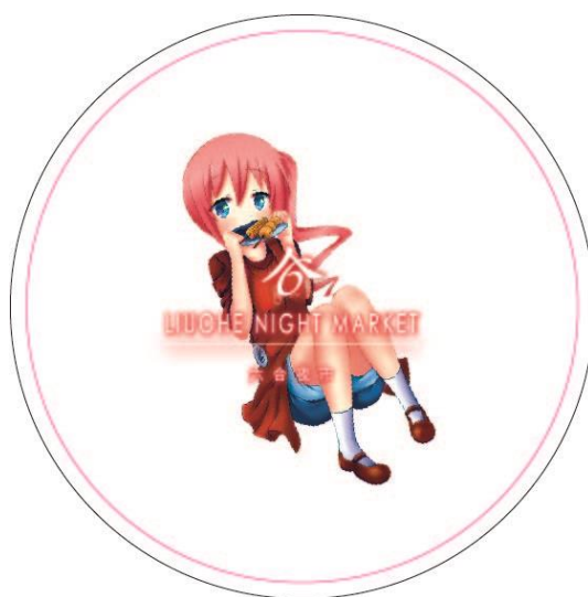
圖 4 杯墊設計