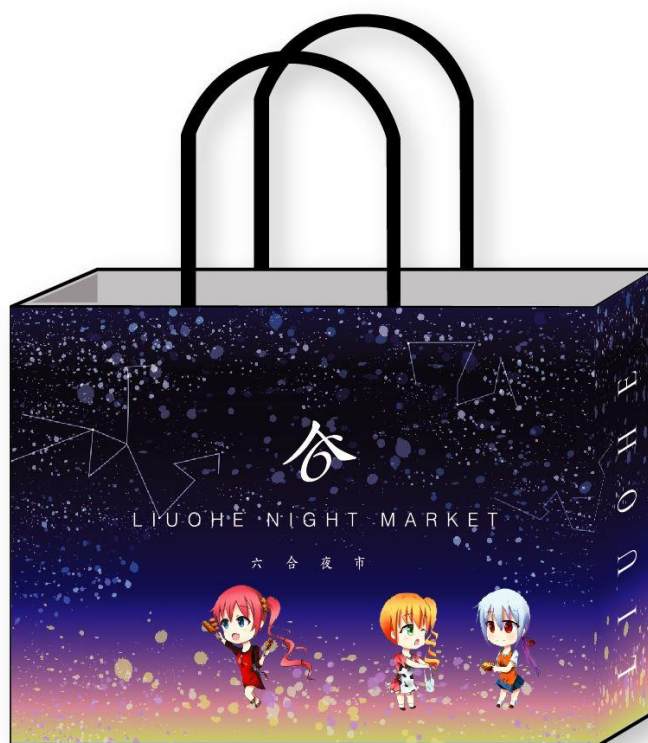
圖 8 紙袋設計