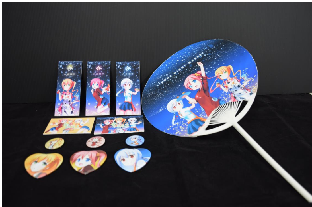
圖 19 總攬 2