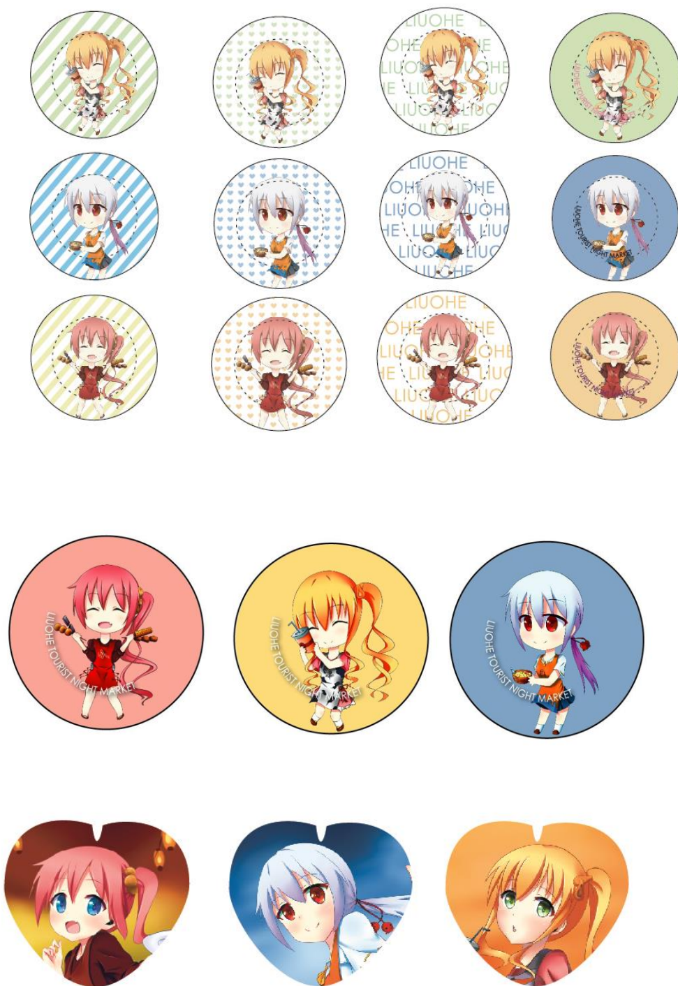
圖 6 胸章設計