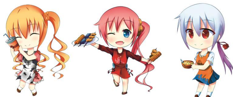
圖 1Q 版