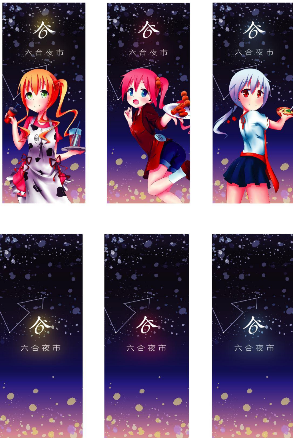
圖 5 書籤設計