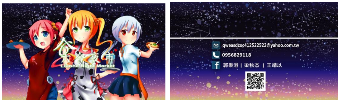
圖 3 名片設計