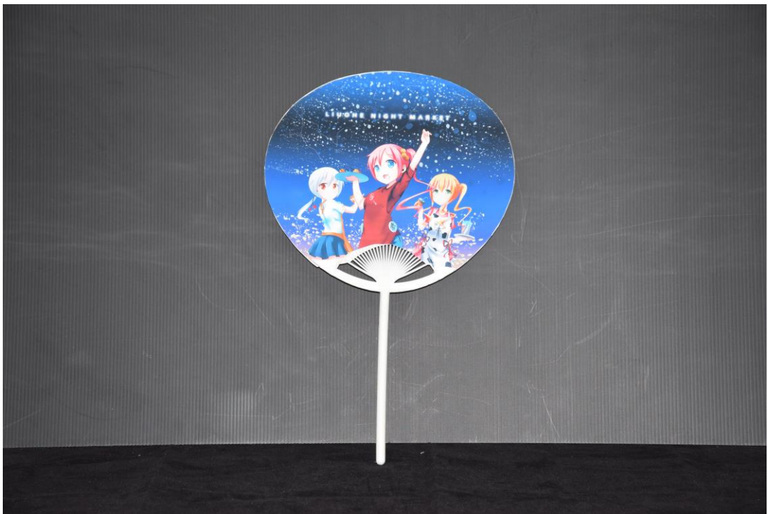
圖 17 扇子