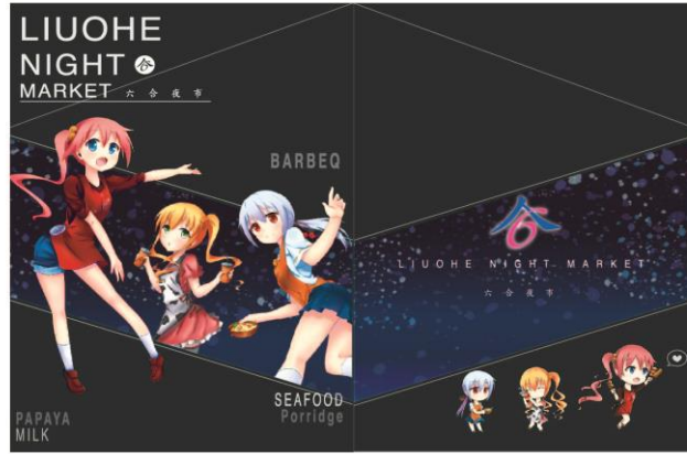
圖 12 封面設計