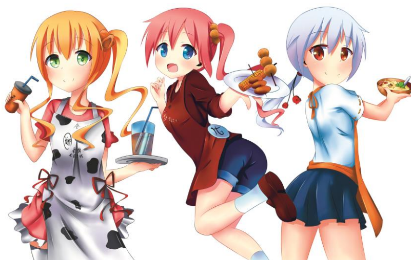
圖 2 主要人物