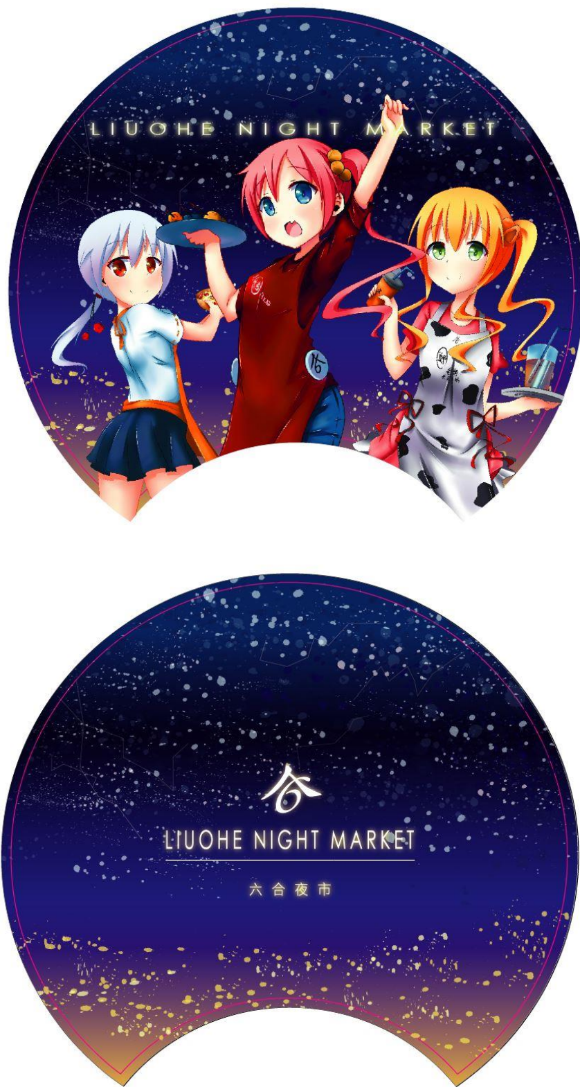
圖 7 扇子設計