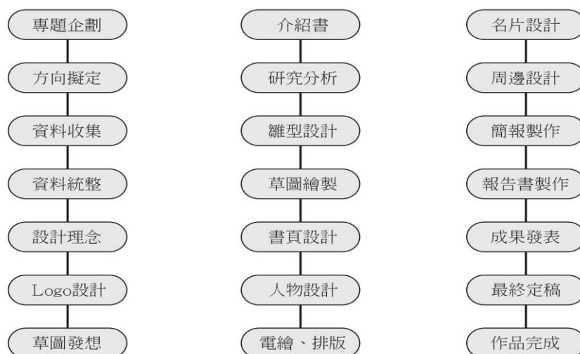
圖 9 流程規劃