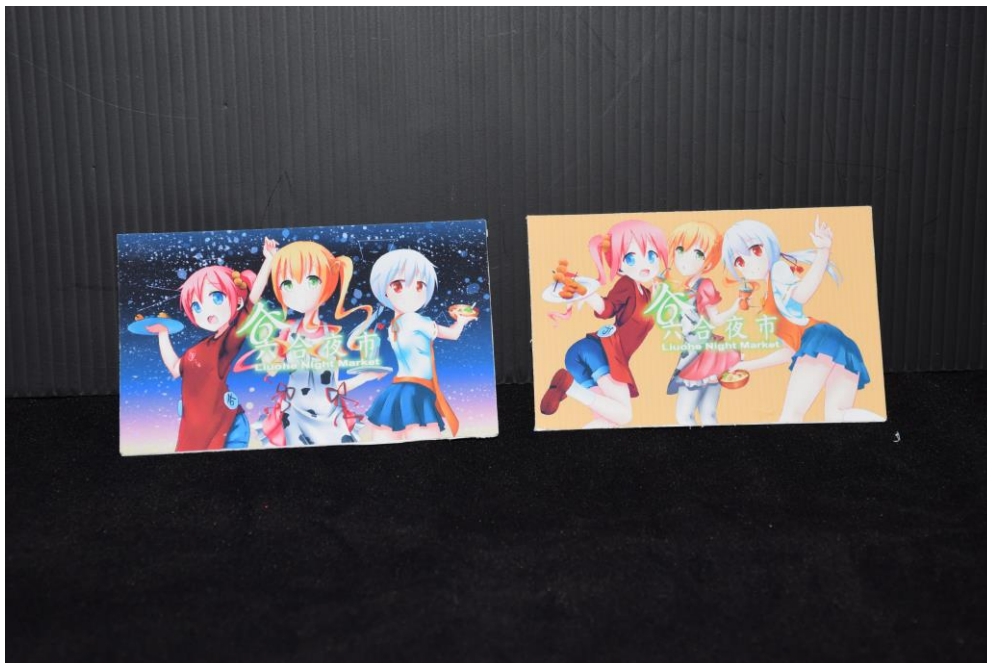
圖 14 名片