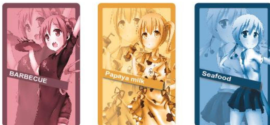
圖 10 卡貼設計