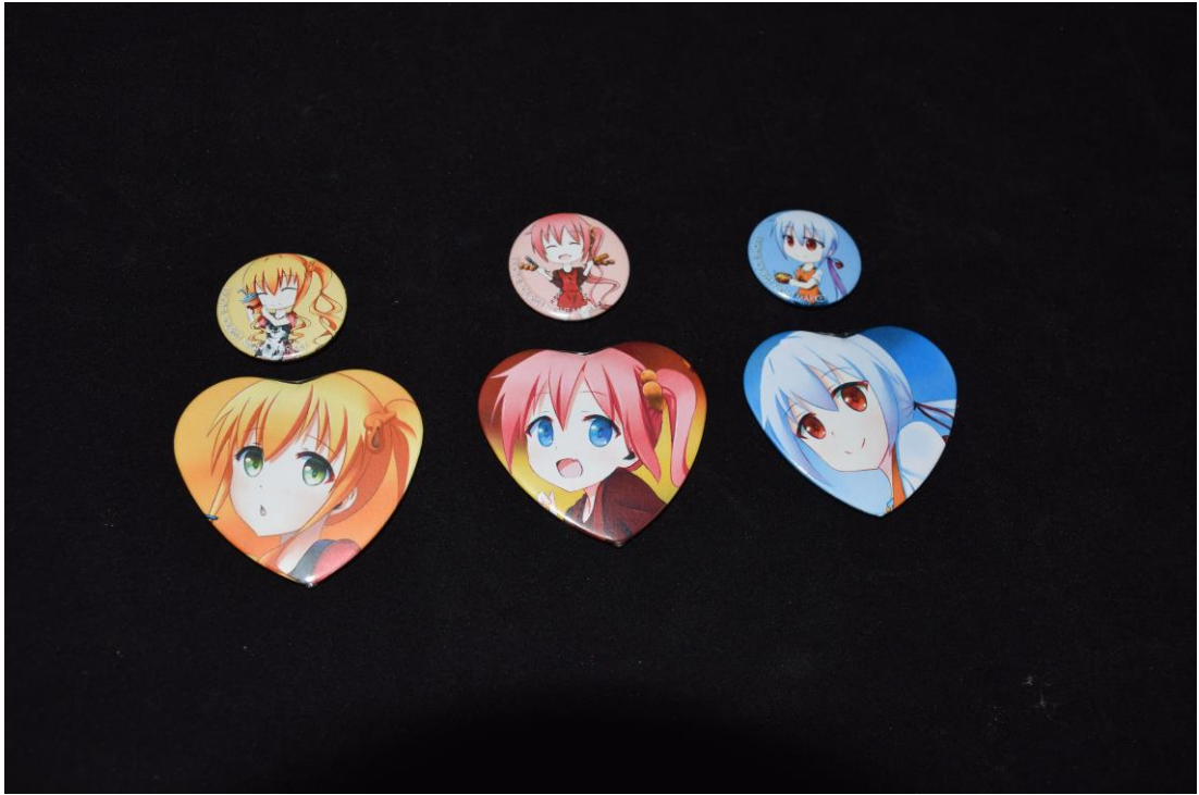
圖 16 胸章