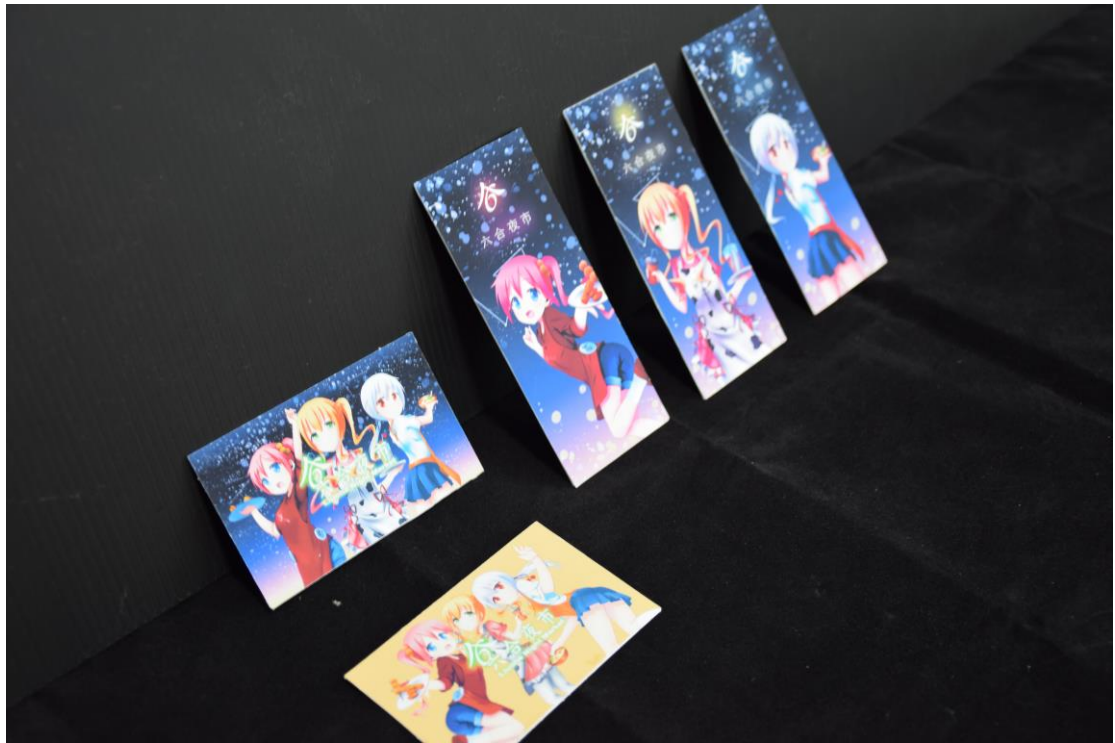
圖 18 總攬 1