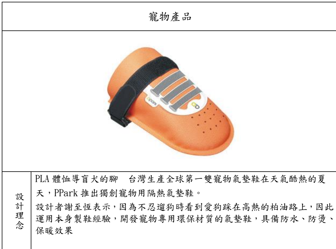
表 7. 寵物氣墊鞋設計