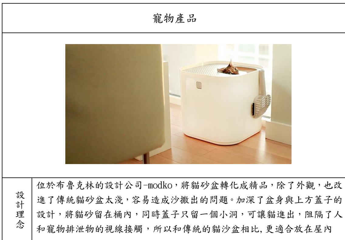
表 6. 貓砂盆設計