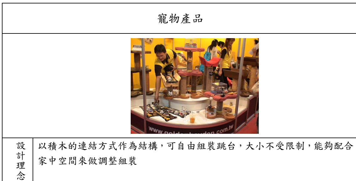
表 8. 貓跳台設計