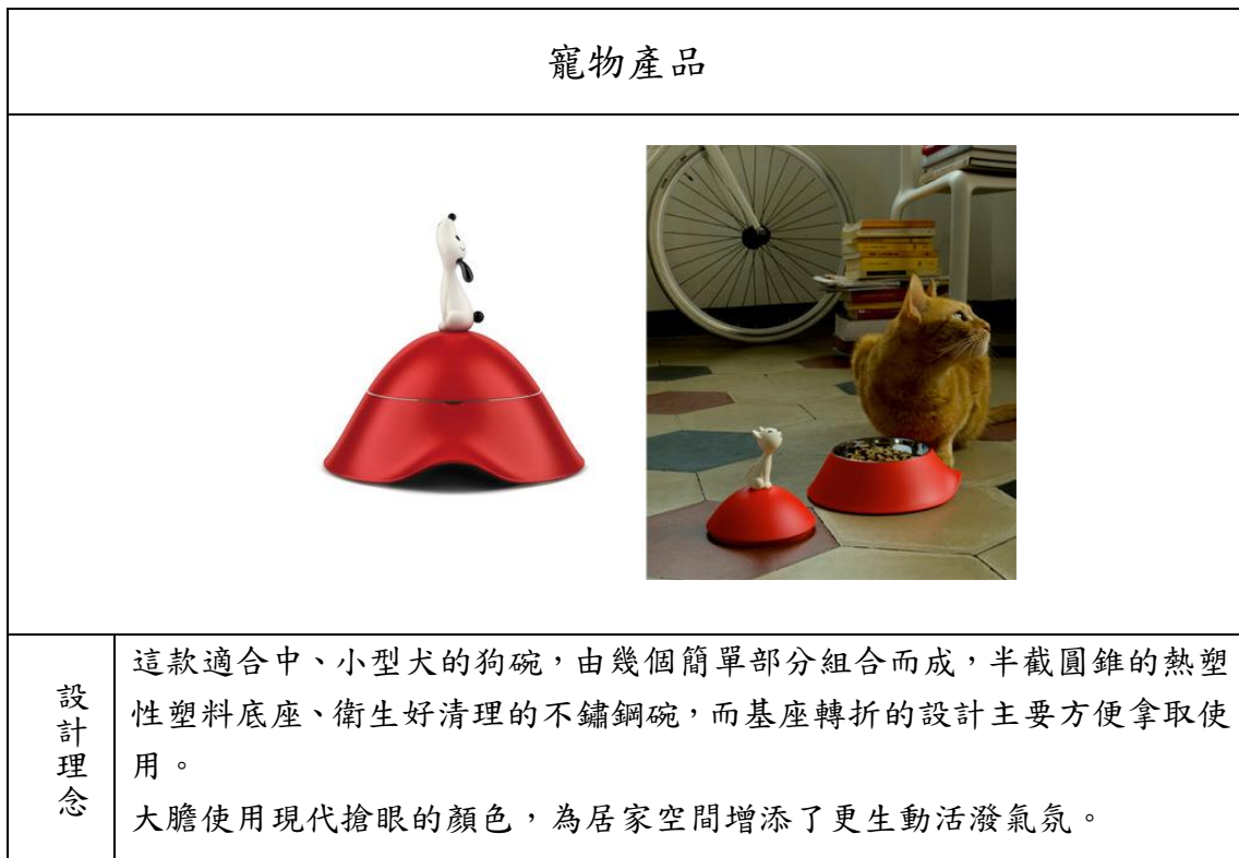
表 4. 寵物碗設計

善用色彩且熱愛動物的義大利設計師—Miriam Mirri，以具象的動物搭配有機造型的碗，造型除了外觀可愛趣味外，也同時兼顧了方便主人開蓋及從地板將碗拿起實用性設計。