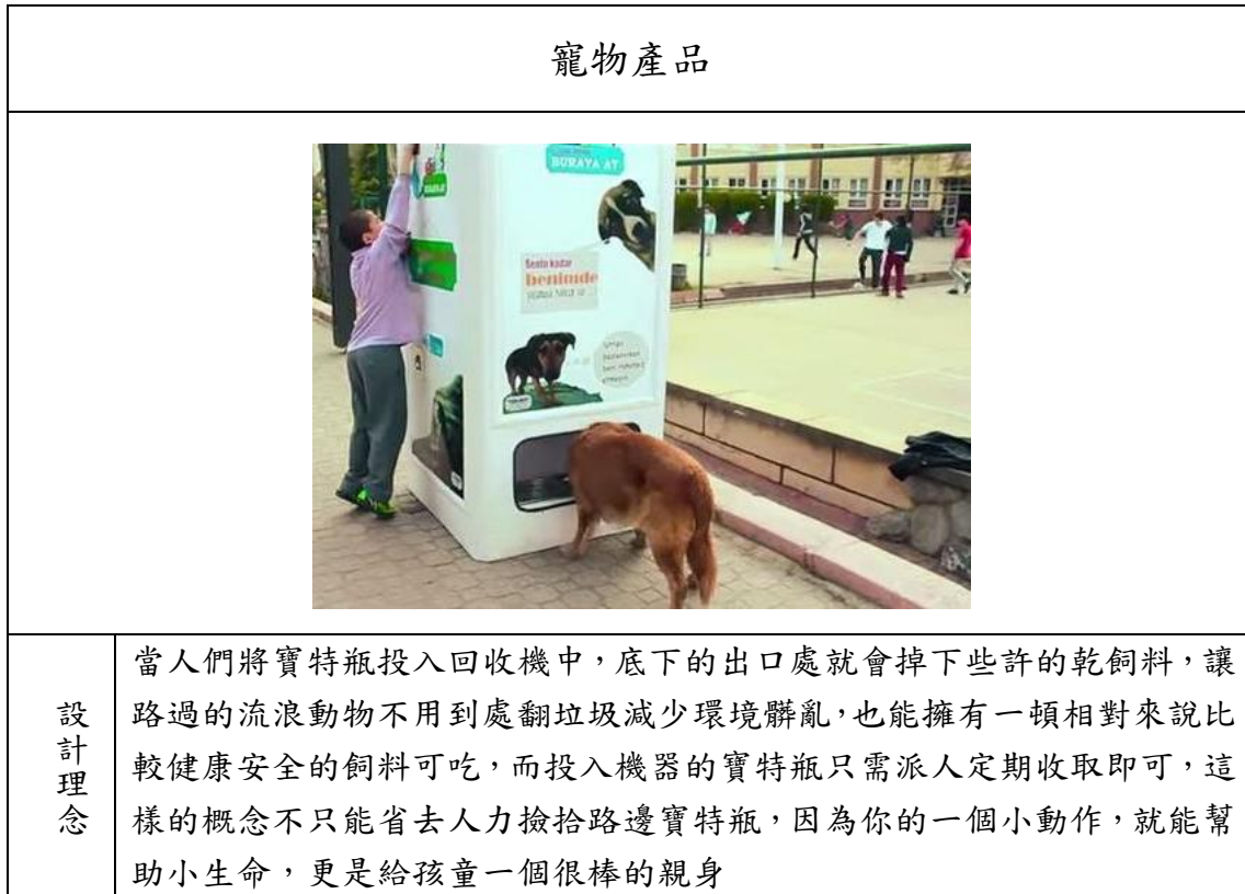
表 2 寵物產品設計