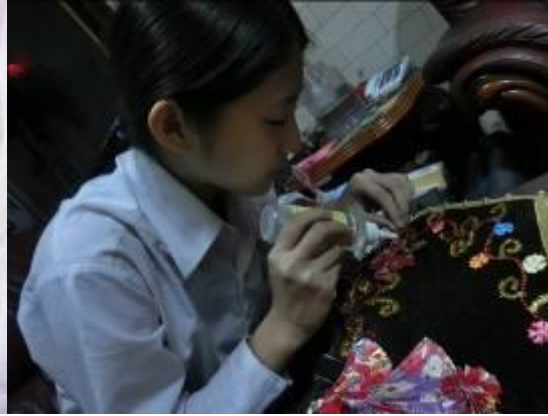
(圖二七)在用毛鐵線摺成曲狀黏在串珠上 再用蝴蝶和小花當裝飾