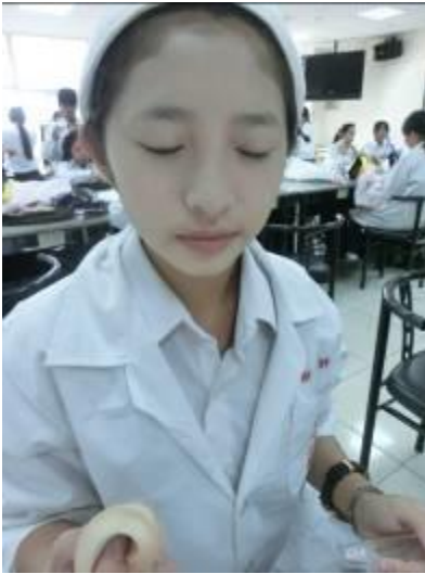
(圖十七)先上粉底再畫眼影