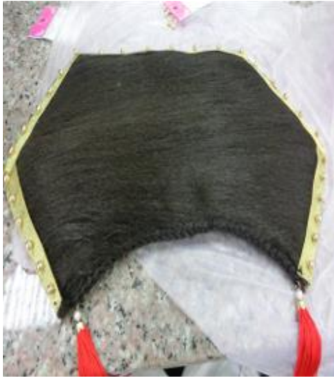
(圖二六)在來把邊邊縫上金色緞帶加黏上 金色珠珠在掛上流蘇