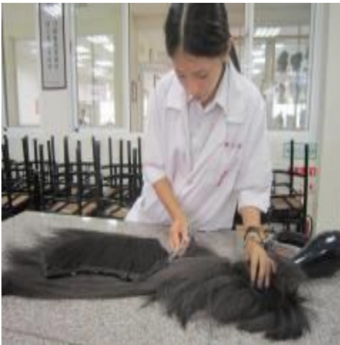
(圖二四)黏好後把多餘的髮棉剪掉