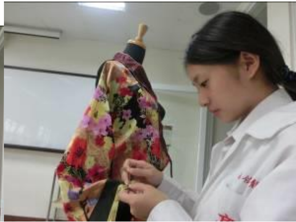
(圖三三)在來在袖口上縫上緞帶和珠珠