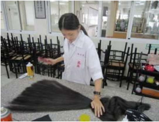
(圖二十)先把髮棉梳開梳直