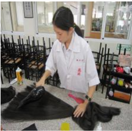
(圖二二)再來用吹風機吹乾