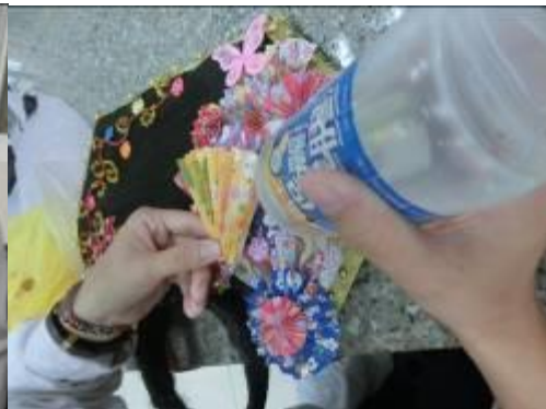
(圖二九)再用摺好的扇子型拼拼湊湊黏上去