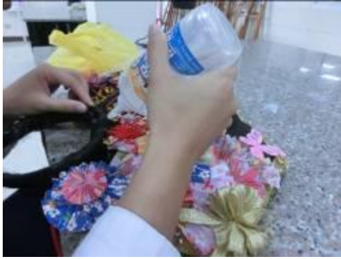
(圖三十)最後在黏上髮圈 衣服製作過程