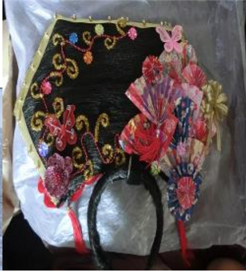
(圖三一)頭飾完成圖。