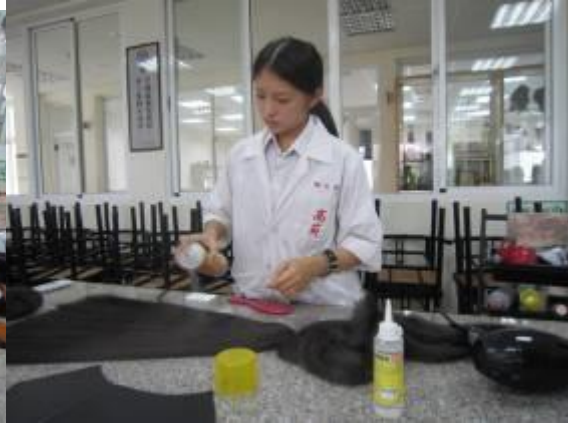
(圖二一)再噴髮麗香定型