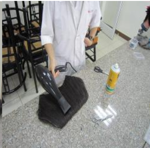
(圖二五)剪掉後再噴髮麗香固定髮棉後再用吹風機吹