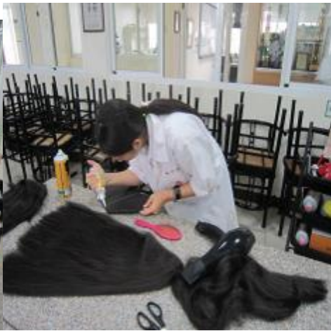
(圖二三)然後保麗龍膠擠在波浪板在黏在髮棉