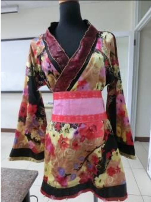
(圖三四)衣服完成圖。