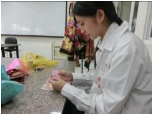
(圖二八)把色紙摺成扇子