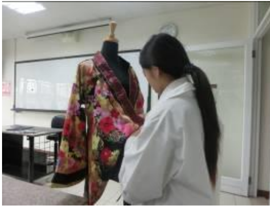
(圖三二)先領口上逢上緞帶