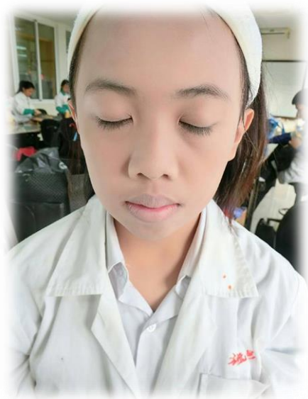
圖(十九)彩妝基底完成