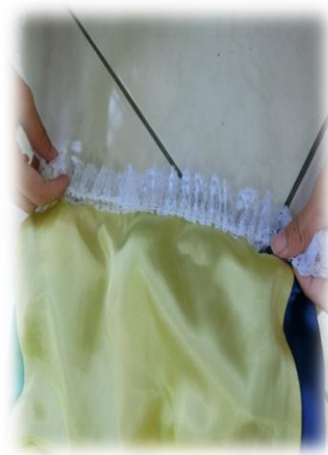
圖(十一)花邊緞帶縫