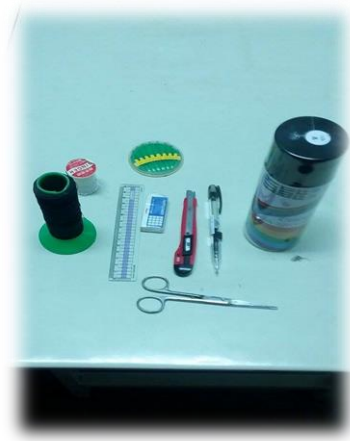
圖(八)各式化妝品工