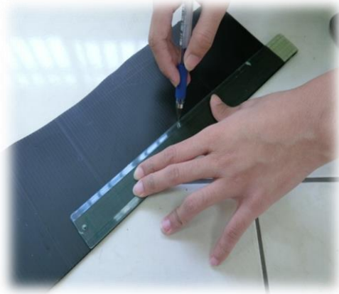
圖(十五)拿筆跟尺將珍珠板 畫出要製做頭飾的板子