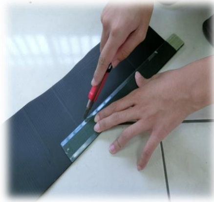
圖(十六)拿筆跟尺將珍珠板 畫出要製做頭飾的板子