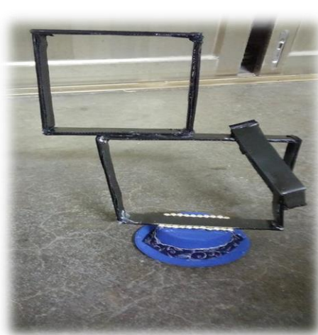
圖(十八)頭飾完成圖