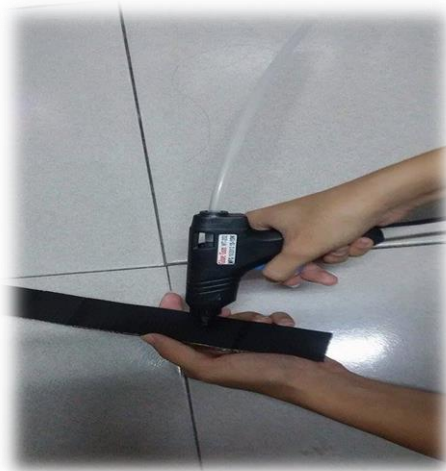
圖(十七)將熱熔槍擠出 來附著在紙板上