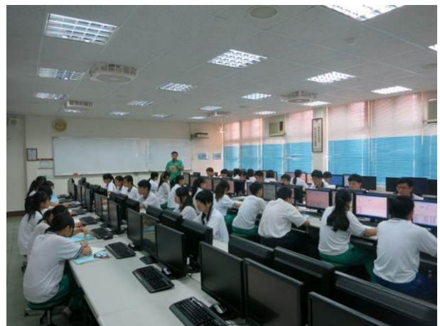
照片說明 題組模擬測驗