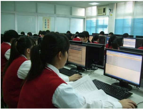
照片說明 模擬測驗