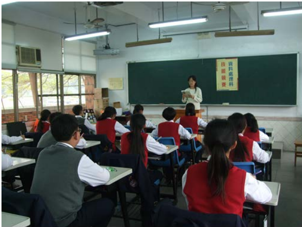
照片說明 說明學科競賽規定及作答注意事項