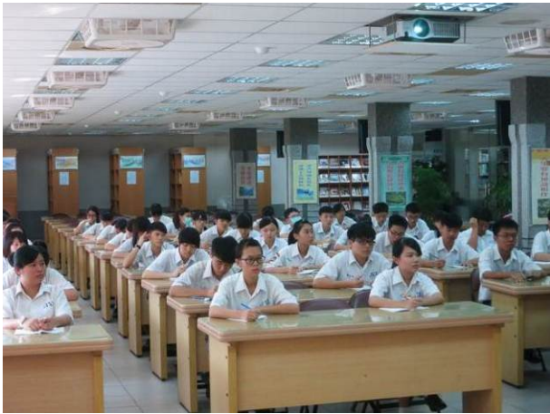
照片說明 學生勤做筆記