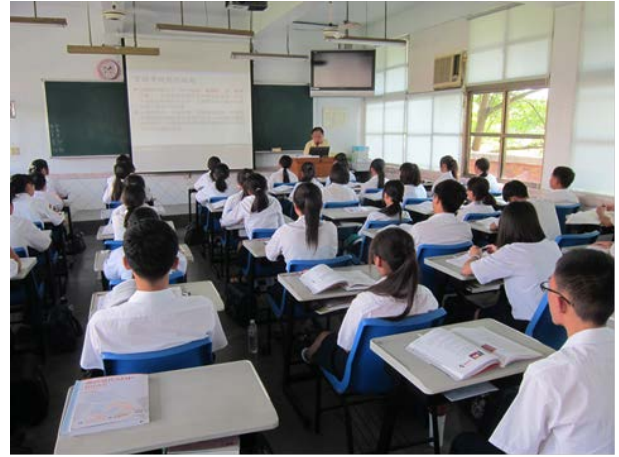
照片說明 課程開始，介紹專題製作的意義