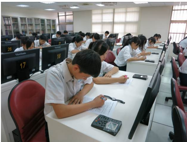
照片說明 學生認真思考學科題目