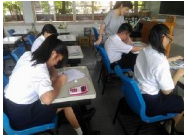
照片說明 學生實際演算題目