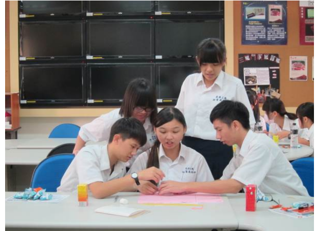
照片說明 激發創意遊戲實作