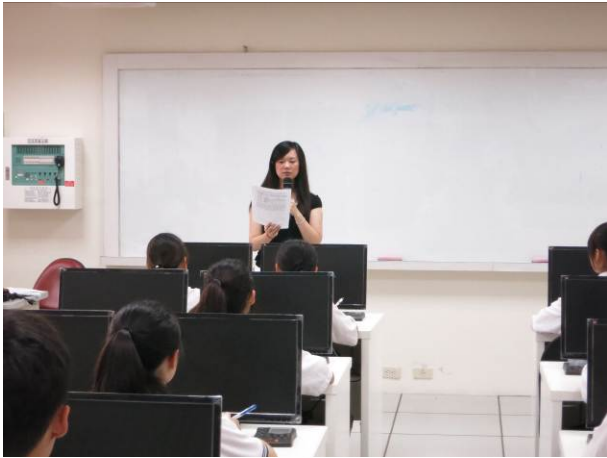
照片說明 監考老師宣讀文書處理組競賽辦法