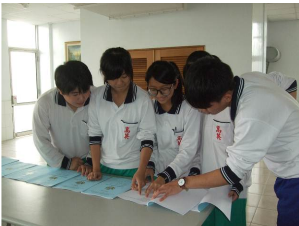
照片說明 學弟妹觀摩作品