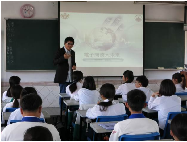
照片說明 講師自我介紹