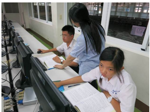
照片說明 教師重點題示