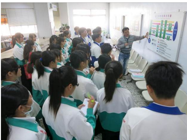
照片說明 參觀關稅局，介紹貨物進出口流程