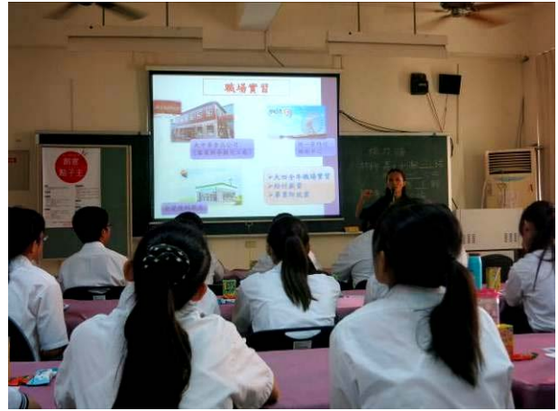
照片說明 美和科技大學企業管理系介紹