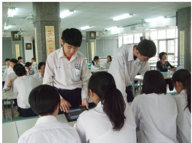
照片說明 學弟妹觀摩作品