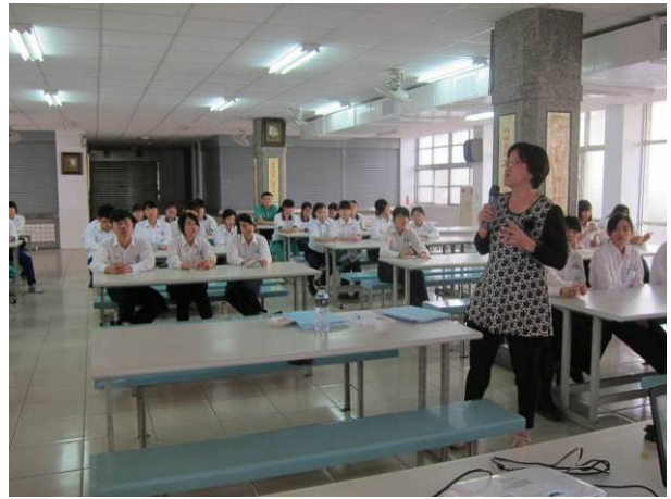
照片說明 教授講評，給予學生鼓勵