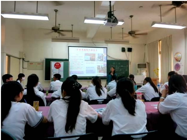
照片說明 講解實務專題製作與發表