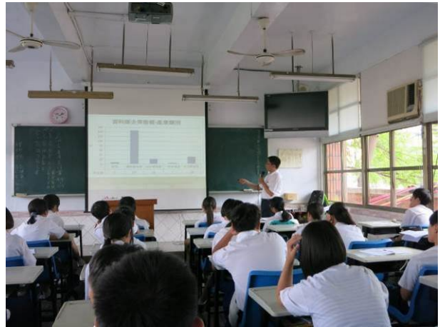
照片說明 學生認真聽講