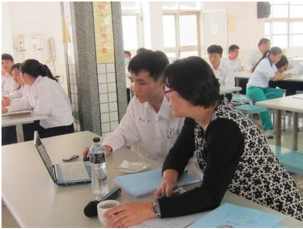
照片說明 同學向評審示範作品