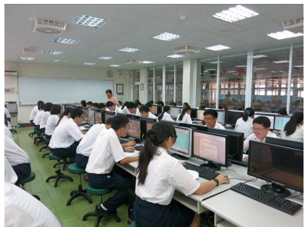
照片說明 商業簡報術科競賽情形