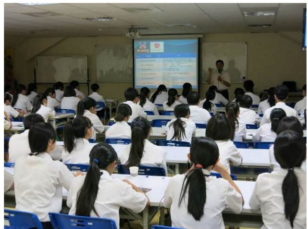
照片說明 參觀義大購物廣場