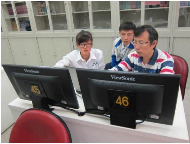
照片說明 小組討論情形