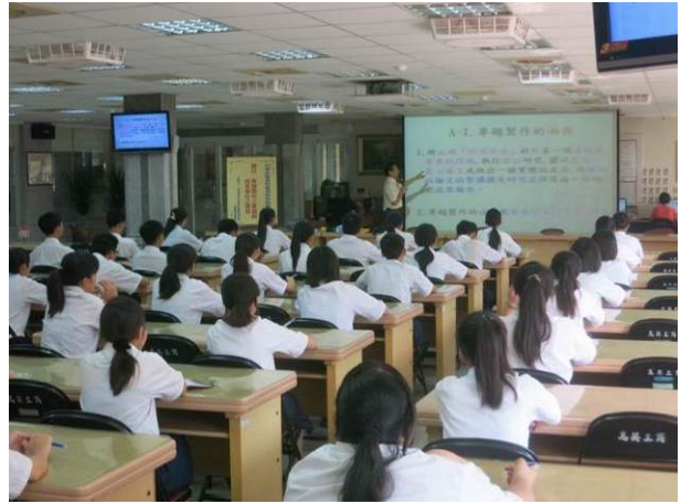
照片說明 講師說明成果報告之撰寫程序