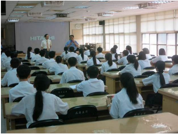
照片說明 校長開場介紹講師