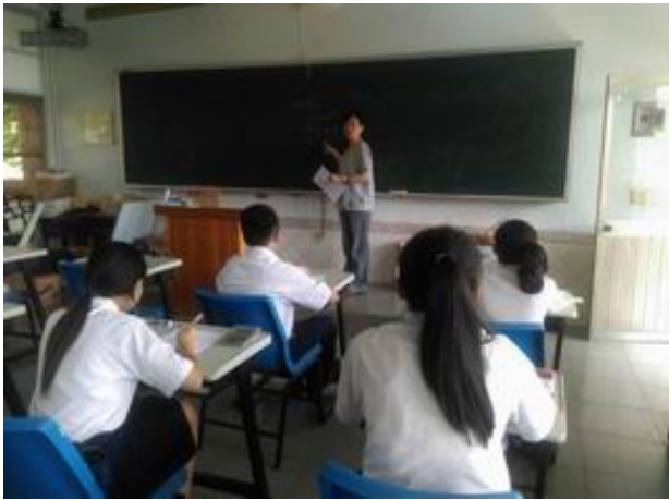
照片說明 教師針對課程要點講課