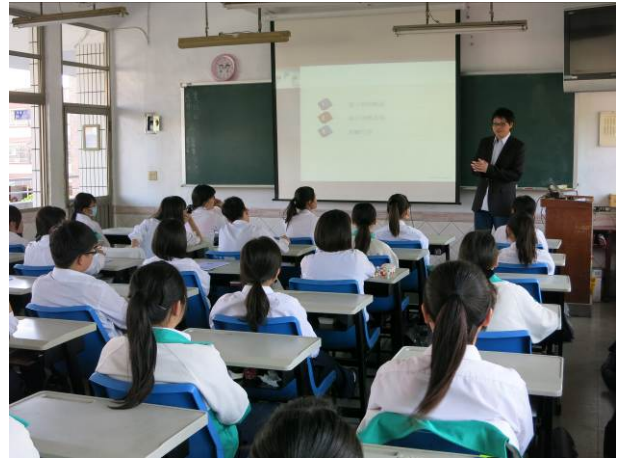
照片說明 講師認真說明