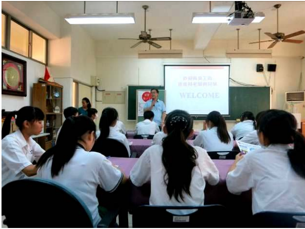
照片說明 美和科大企業管理系主任開場