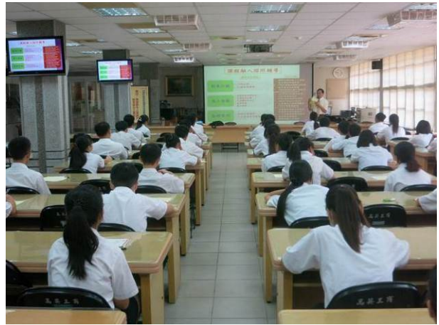
照片說明 學生認真聽講