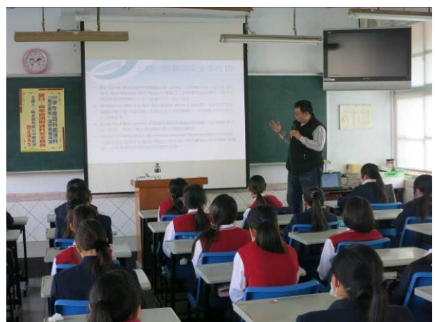
照片說明 分享實際案例