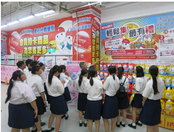
照片說明 參觀台糖量販店