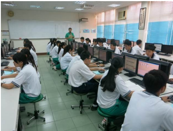
照片說明 社團時間參檢學生勤加練習