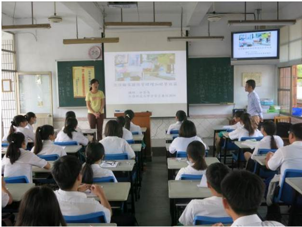
照片說明 任課教師介紹講師