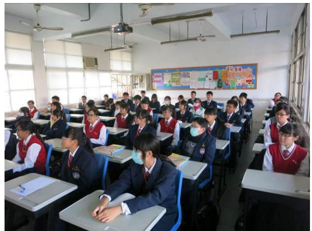
照片說明 同學認真聽講情形