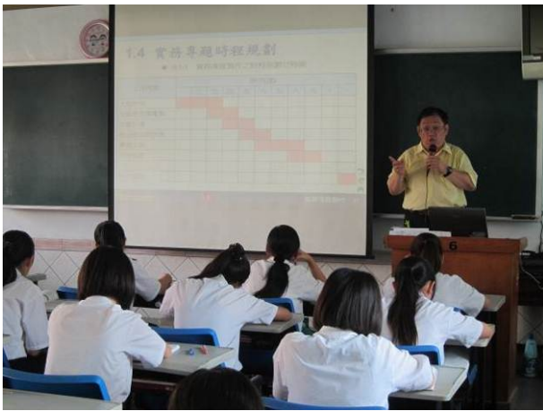
照片說明 講師介紹甘特圖