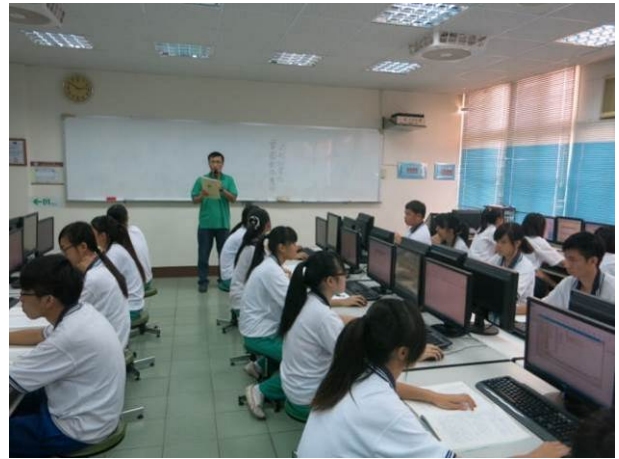
照片說明 指導老師說明考試流程與注意事項