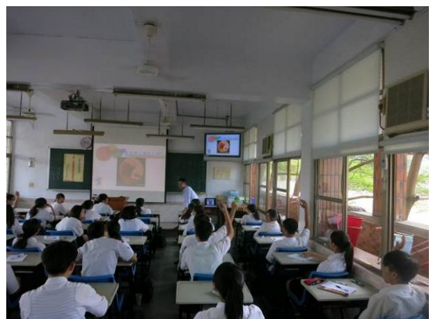
照片說明 同學踴躍發問，互動良好