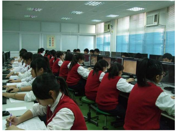
照片說明 同學認真練習情形