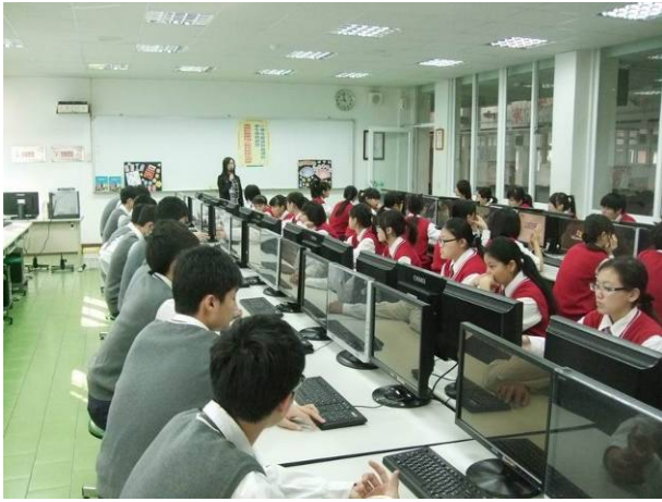
照片說明 主任開場，說明本次集訓目的