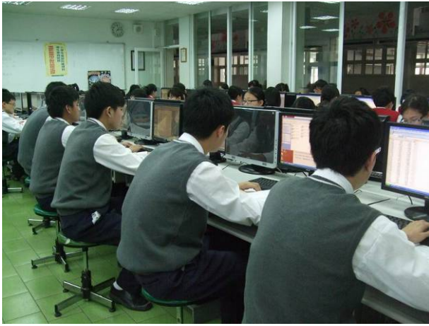
照片說明 同學認真練習情形