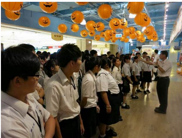
照片說明 參觀義大購物廣場