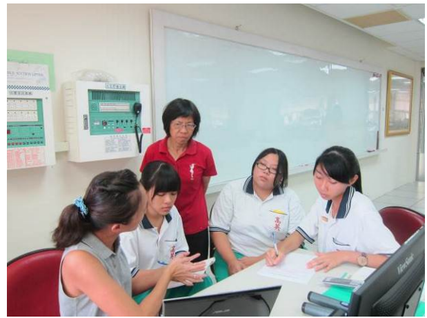
照片說明 小組討論情形