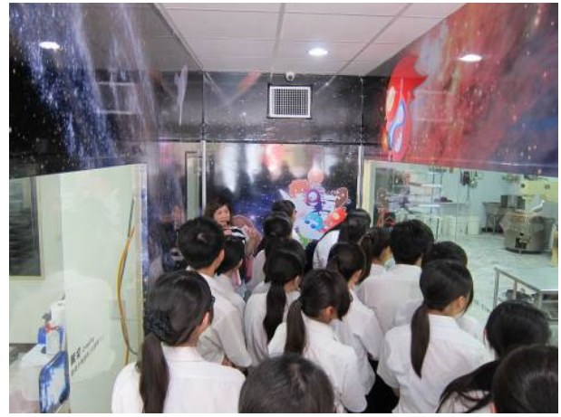
照片說明 參觀火星糖工廠