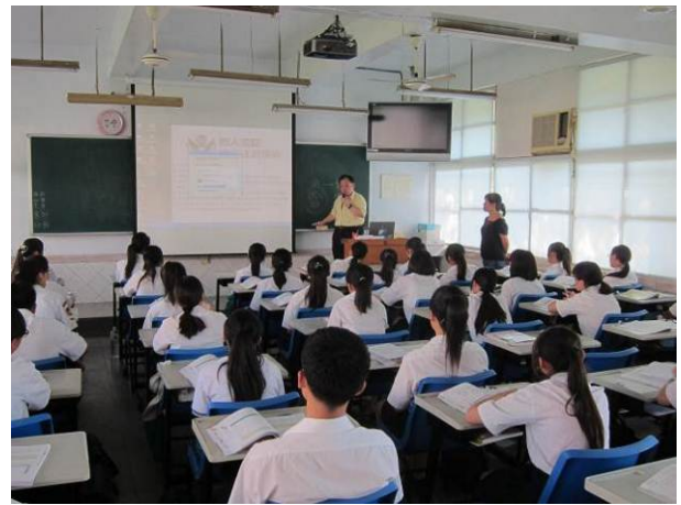
照片說明 講師說明製作專題時的連貫性