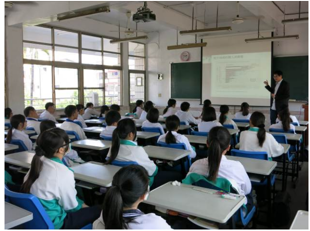
照片說明 分析全球電子商務的購買力