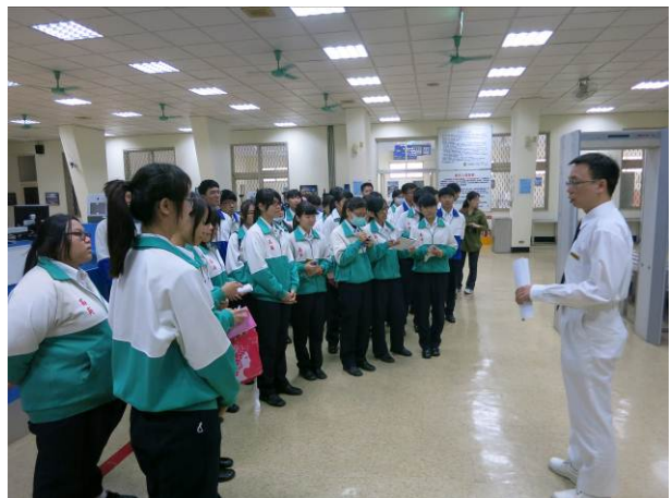
照片說明 參觀高雄關稅局旅客出入境