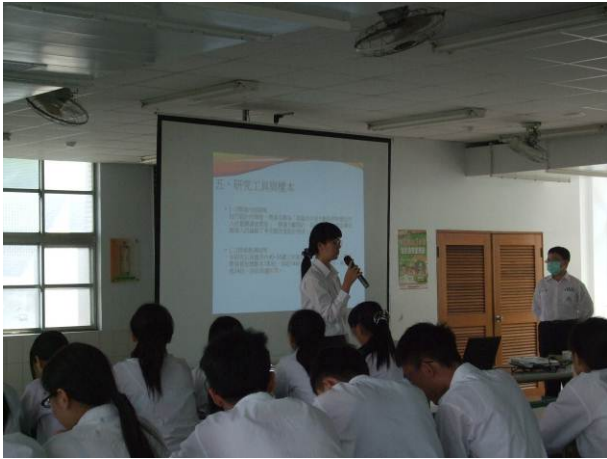
照片說明 各組發表情形