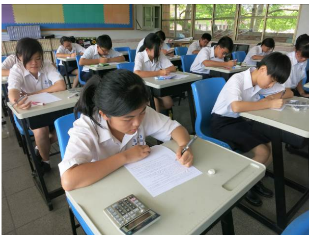
照片說明 學科測試情形