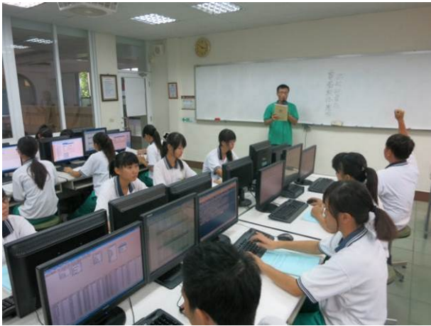
照片說明 指導老師點名