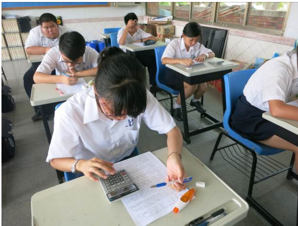
照片說明 一年級術科競試情形