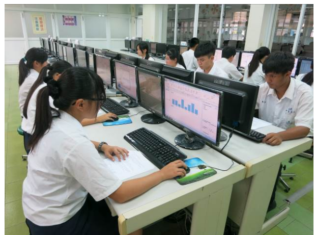
照片說明 競賽期間選手皆全力以赴