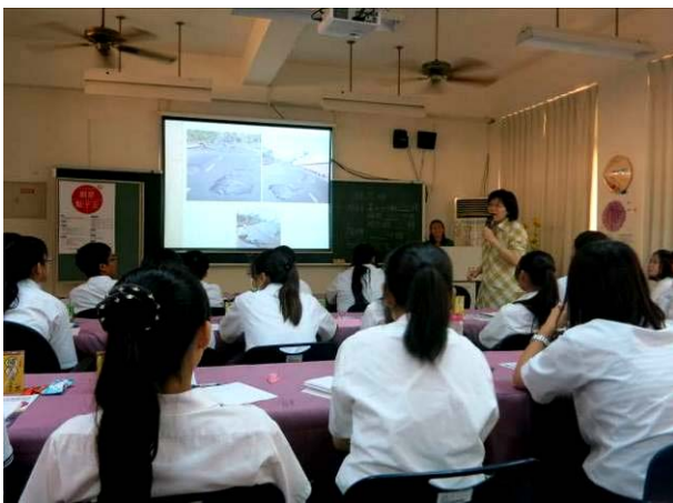
照片說明 分享創意行銷的實際案例