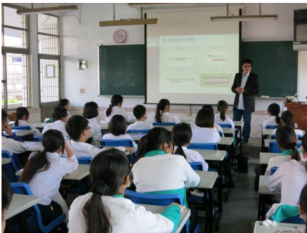
照片說明 利用實際電子商城做介紹