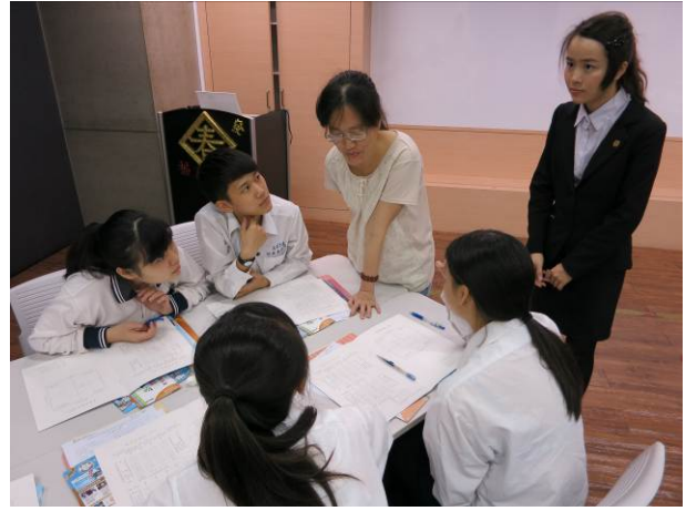
照片說明 參觀遠雄壽險