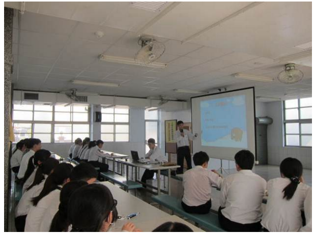
照片說明 各組發表情形