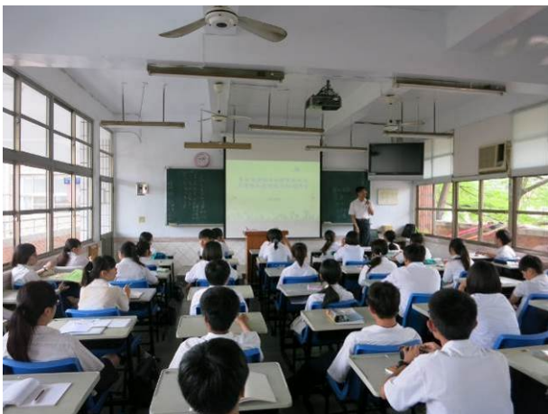
照片說明 創業經驗分享