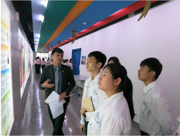
照片說明 參觀遠雄壽險