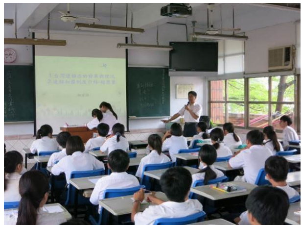
照片說明 創業經驗分享