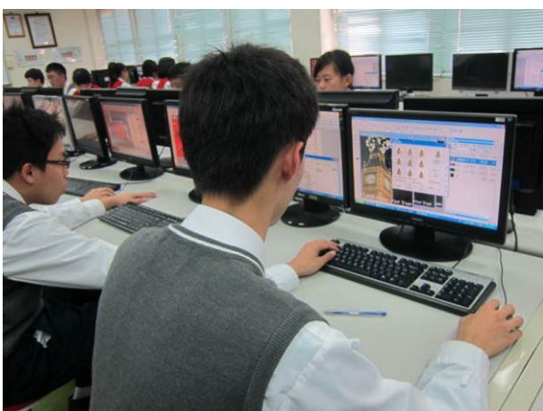
照片說明 三年級術科競試情形