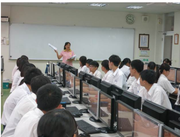
照片說明 監考老師宣讀商業簡報組競賽辦法