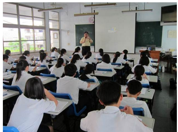
照片說明 講師做最後總結