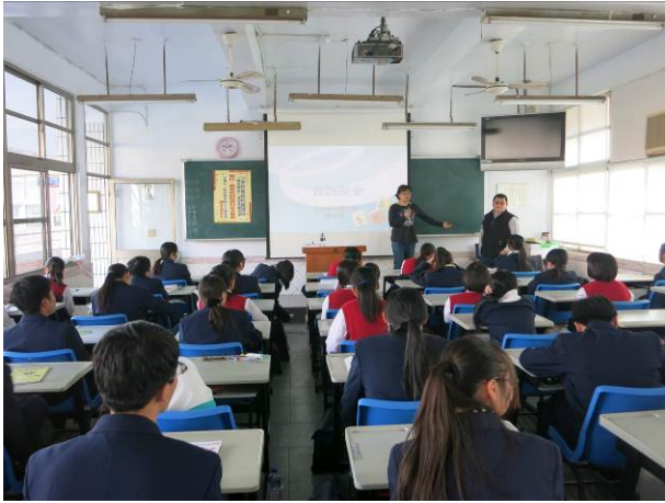
照片說明 任課教師開場介紹講師