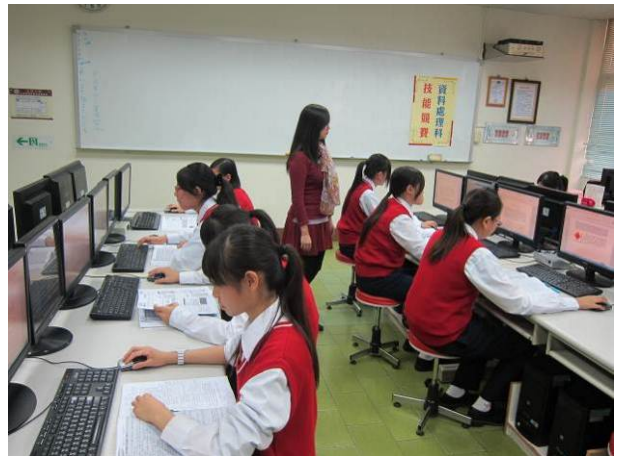
照片說明 一年級術科競試情形