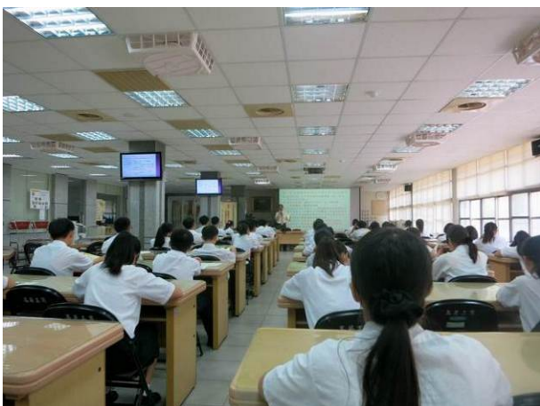
照片說明 撰寫之實例說明