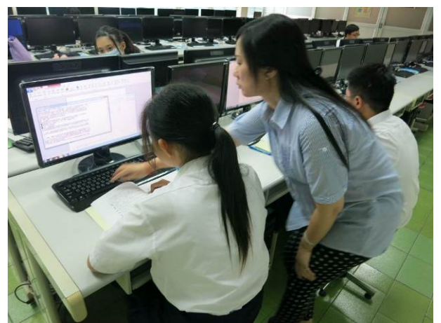
照片說明 教師個別指導情形