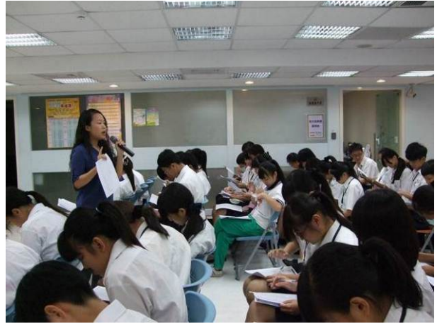
照片說明 參觀青年職涯發展中心