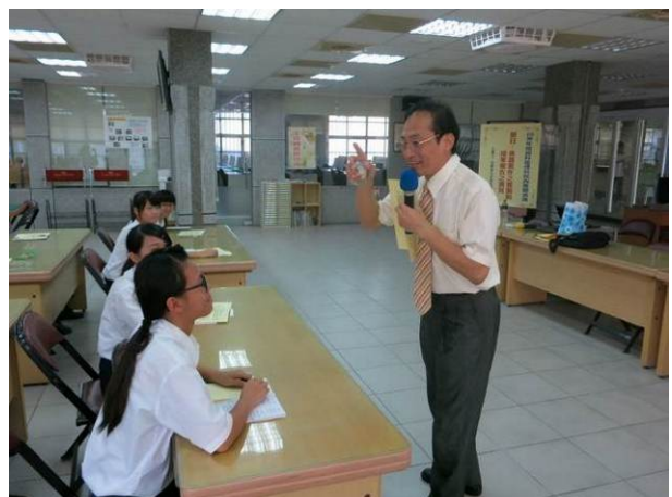
照片說明 課程內容精彩，師生互動良好