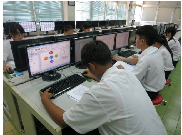
照片說明 二年級術科競試情形