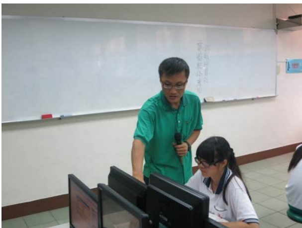
照片說明 教師個別指導學生