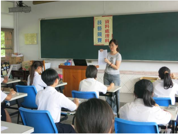
照片說明 老師說明學科競賽相關規則