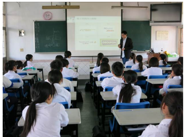
照片說明 講師做最後總結，同學獲益良多