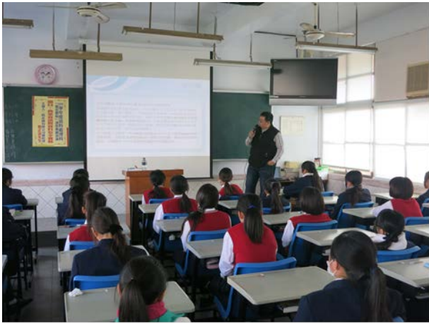
照片說明 說明資訊安全的重要性