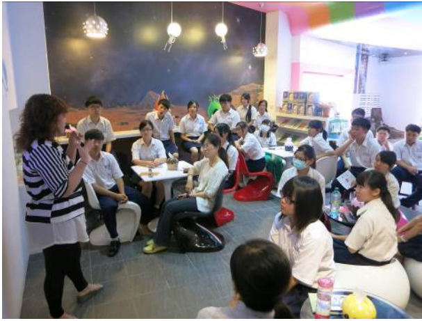
照片說明 參觀火星糖工廠