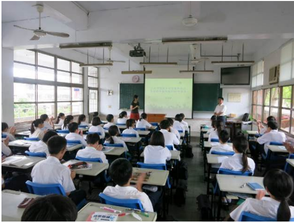
照片說明 主任開場，介紹講師