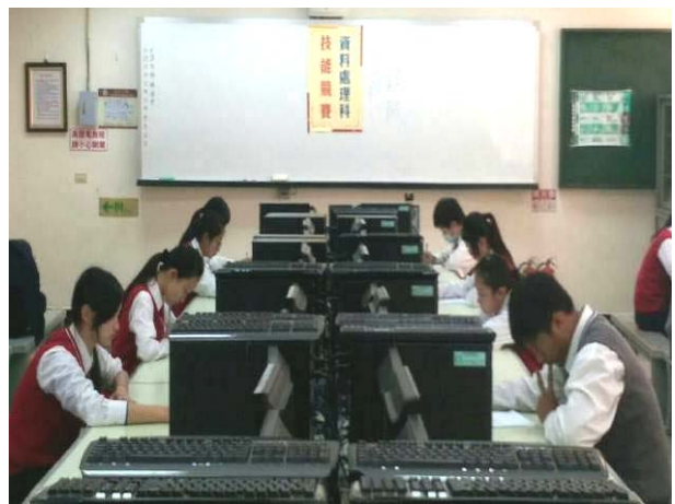
照片說明 二年級術科競試情形