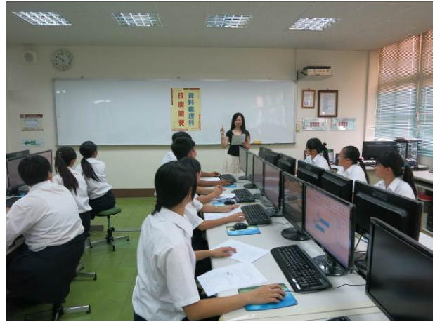
照片說明 老師說明術科競賽注意事項