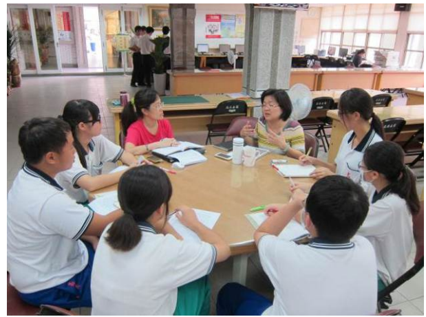
照片說明 小組討論情形