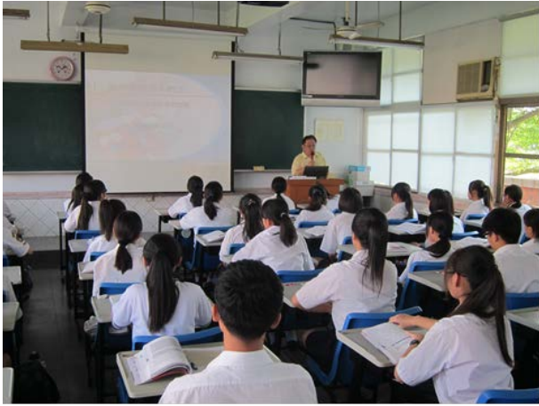
照片說明 講師自我介紹