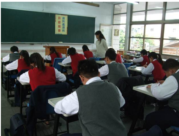
照片說明 學科測試情形