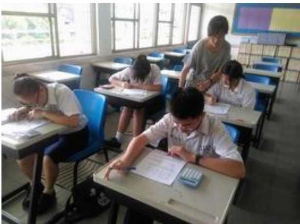
照片說明 教師個別指導情形