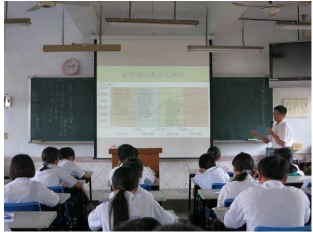
照片說明 台灣連鎖業發展現況