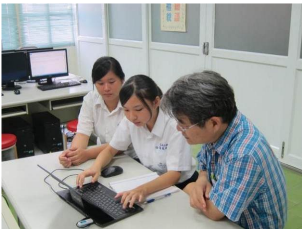
照片說明 小組討論情形