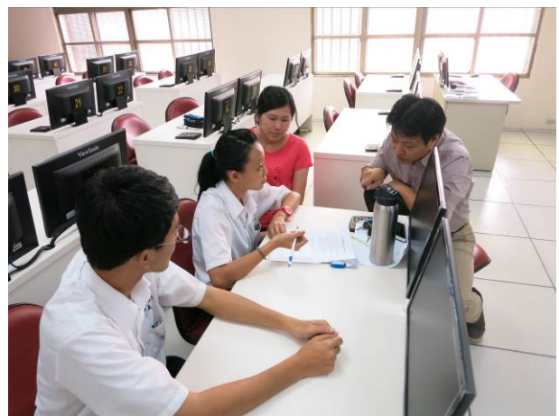
照片說明 小組討論情形