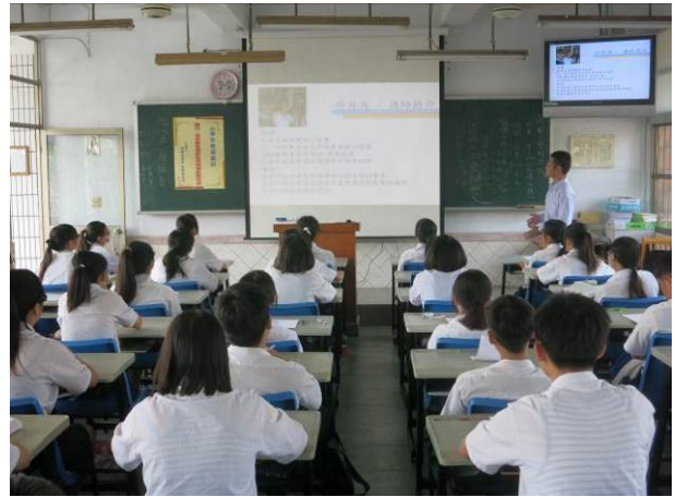
照片說明 課程開始，講師自我介紹