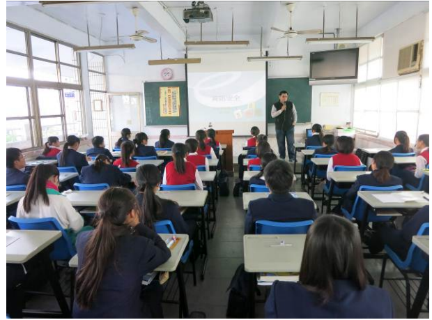
照片說明 講師自我介紹