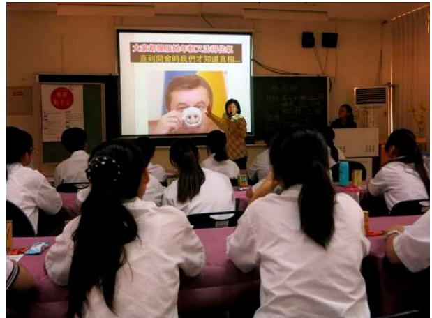
照片說明 分享創意行銷的實際案例