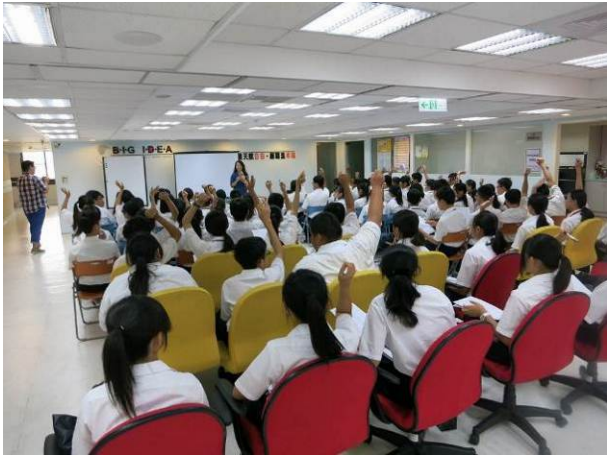
照片說明 參觀青年職涯發展中心