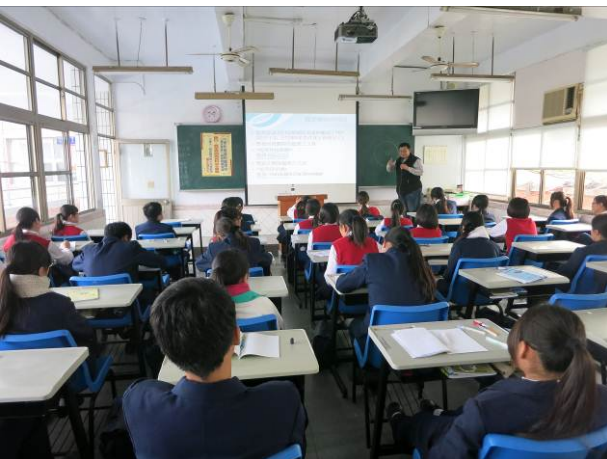
照片說明 教導同學簡單的加強資訊安全方法