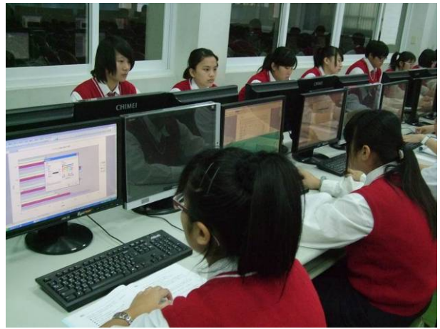
照片說明 模擬測驗