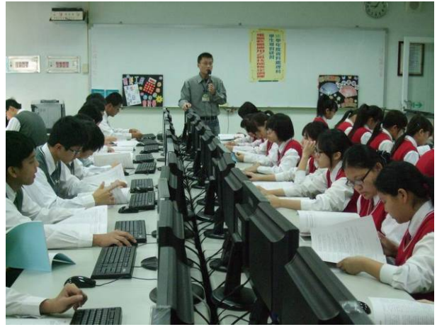
照片說明 講師叮嚀術科注意事項