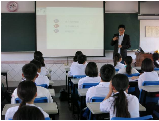
照片說明 說明電子商務的發展