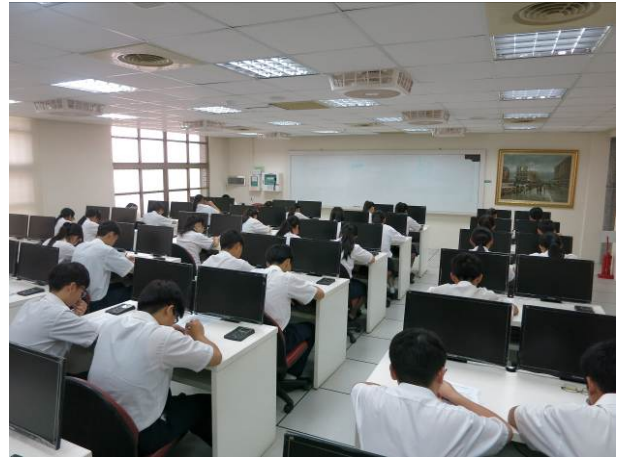
照片說明 文書處理學科競試情形