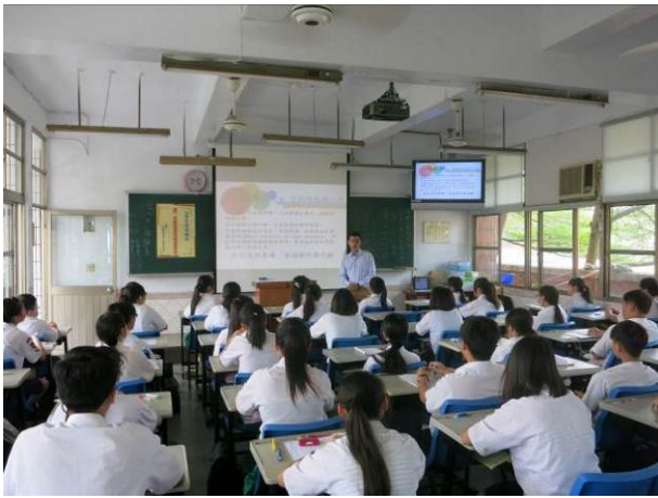
照片說明 講師說明顧客關係管理