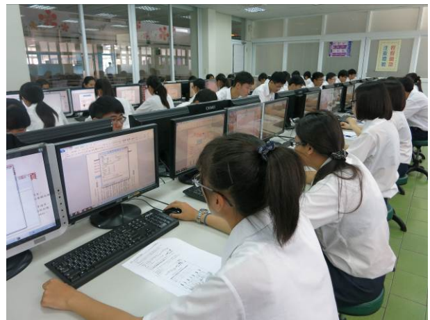
照片說明 文書處理術科競賽情形