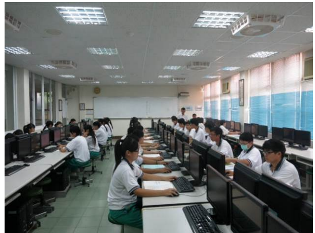
照片說明 社團時間參檢學生勤加練習