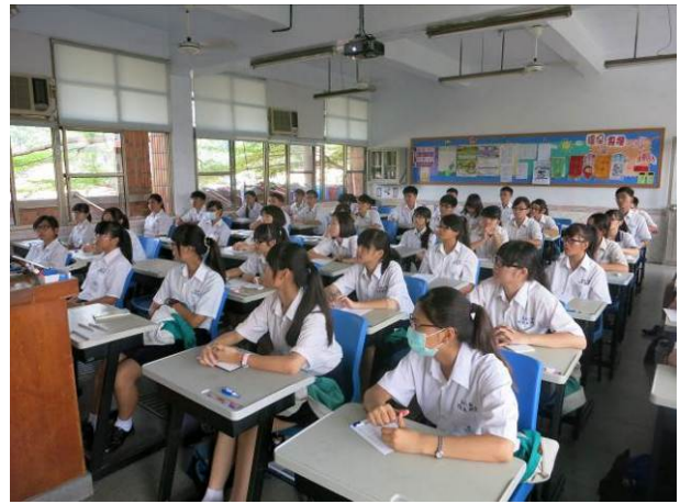
照片說明 學生認真聽講