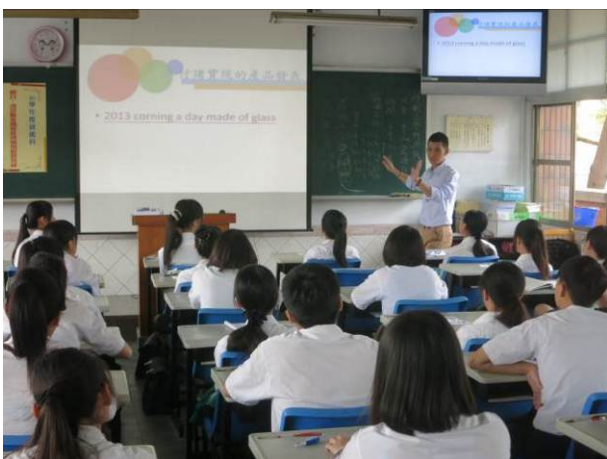
照片說明 講師利用影片分享實際案例