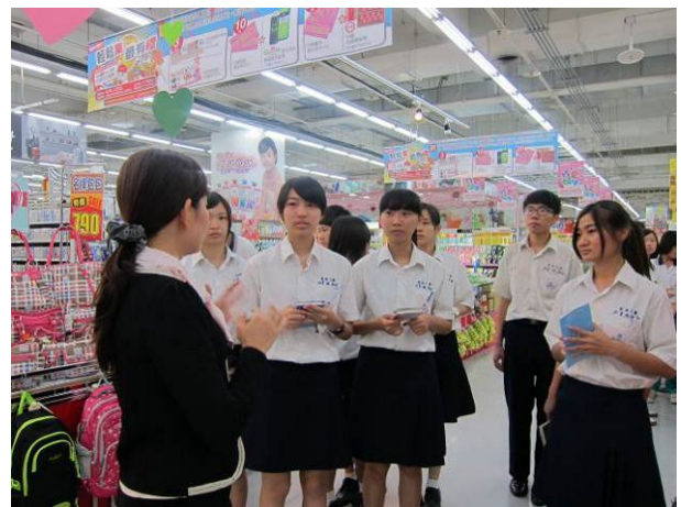
照片說明 參觀台糖量販店