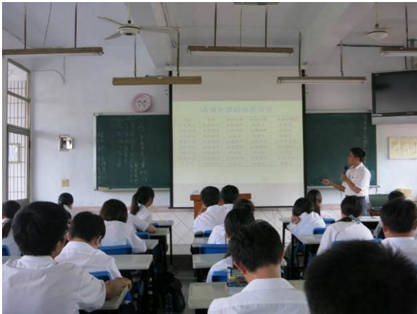
照片說明 連鎖加盟的經營型態說明