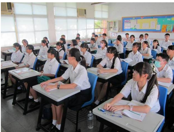
照片說明 學生認真聽講