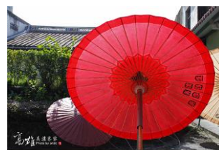
圖 8 紙傘