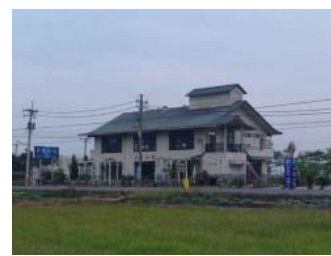
圖 14 美濃菸樓小館