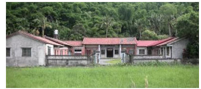
圖 19 美濃夥房

夥房是以祖堂為中心，門前有堂號對聯，前有禾埕，左右有廂房，與閩南的三合院建築最大的差別在於三合院的祖堂和各廂房間是互通的，而客家夥房則是各自獨立，客家人相當重視家族觀念，兄弟大都不願分家，當家族人口增加，則在前堂後方加蓋新的橫屋，因此形成了獨特的夥房建築形式。夥房是美濃鎮文化財，有人住的夥房是活的博物館，觀光客的最愛。 [28]