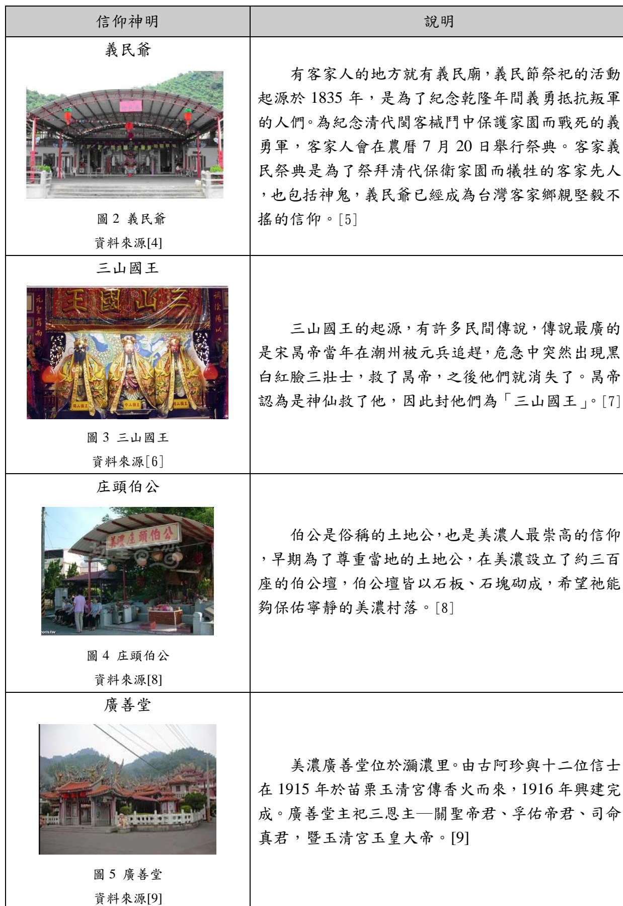
表 1 神明信仰的介紹