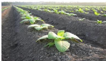
圖 9 菸草

在民國九十一年台灣加入 WTO 後，菸酒公賣局開始邁向民營化，改制為「台灣菸酒股份有限公司」，加速了本土菸業的凋零。美濃從這一年開始，菸田面積以每年減半的速度迅速萎縮。改為民營的菸酒公司計畫在三年內，不再收購本土菸草，但是菸農和政治力的施壓之下，全台灣菸葉的種植面積尚維持在七百零二公頃，而美濃只剩一百五十公頃，曾經被稱為菸葉王國的美濃，如今再也看不到往日的榮景。 [15]