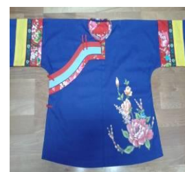
圖 15 藍衫 [21]

藍染：染布時將染料加一些藥草在染缸中攪拌，直到起泡，布料浸泡過後再擔去河邊洗，洗完披在竹竿上，曬乾後捲成圓筒狀，再用碾石碾過，使其平順發亮，最後摺疊起來待售。[22]