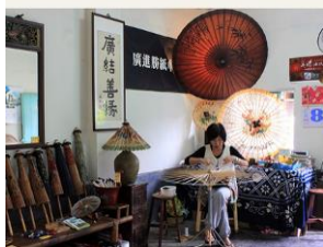
圖 6 紙傘

傘骨結構完成之後，再上膠裱紙修邊、上柿子油、曝曬、繪畫、裝傘柄、固定傘頭、穿內線等步驟之後，方始完成。[13]