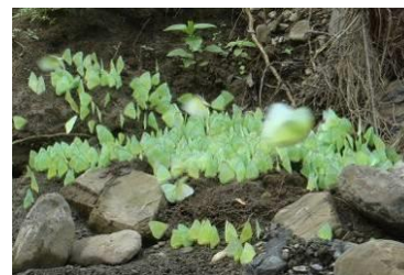
圖 16 黃蝶祭

黃蝶祭自 1995 年開始，今年邁入第十六年了，會舉辦黃蝶祭是因為當時反對興建水庫，由當地人士為了保護生態而發起，在第六屆時，舉辦「單車遊美濃」來增加旅遊的風氣，也提供來美濃的遊客停留的初步資訊。[25]