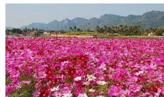
圖 17 波斯菊花海

美濃波斯菊花海是在過年前後盛開，主要利用農地休耕時期，推行種植波斯菊、向日葵等景觀作物，替代傳統肥料的綠肥植物，並來吸引觀光客到美濃賞花，帶來商機。