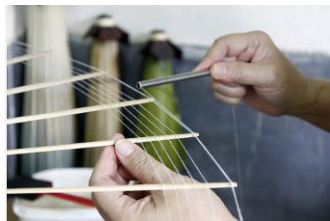
圖 7 紙傘