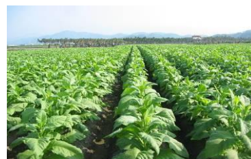
圖 11 菸草