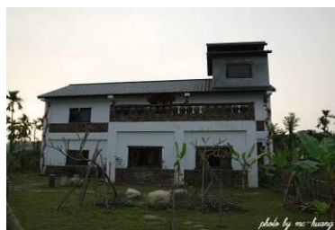
圖 13 菸樓陶藝館