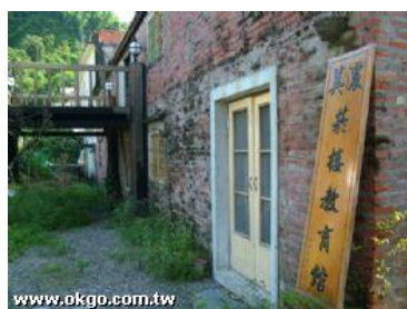
圖 12 菸樓教育館