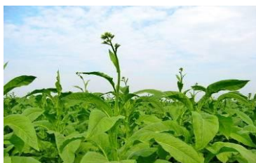
圖 10 菸草