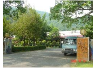
圖 18 美濃窯

裡面的環境乾淨舒適，滿了藝術氣息。有時間的話還可點杯咖啡，嚐嚐藝術咖啡的味道。[27]