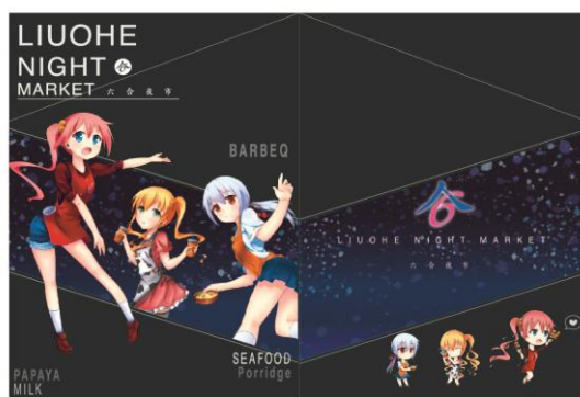
圖 8 封面與內頁設計