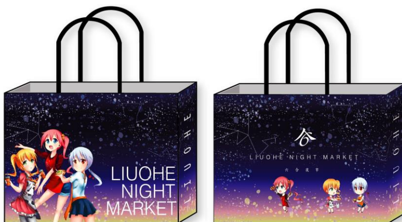
圖 6 紙袋設計