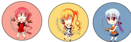
圖 4 胸章設計