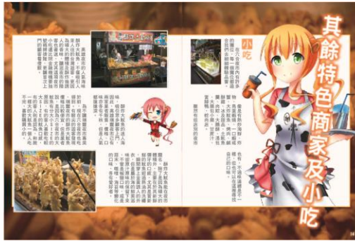
圖 8 封面與內頁設計