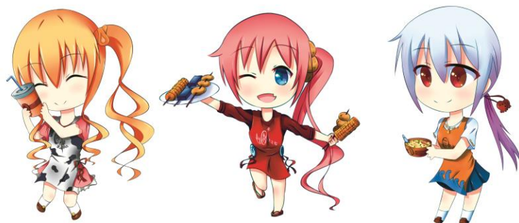
圖 1Q 版