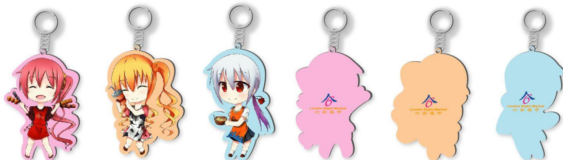
圖 7 吊飾設計