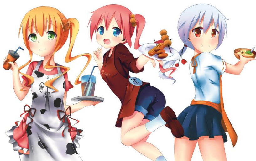
圖 2 主要人物