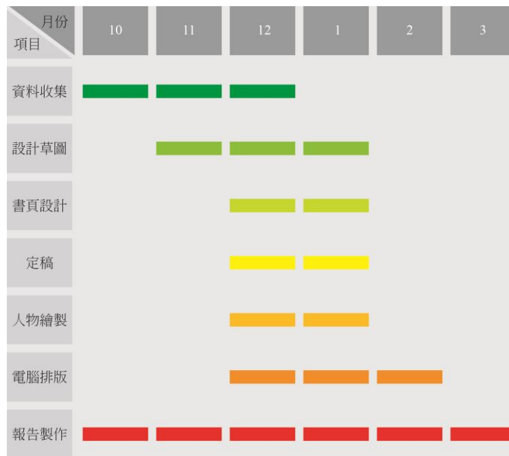
圖 10 工作時刻表