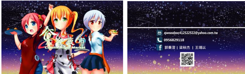
圖 2 名片設計