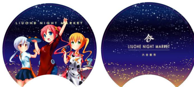
圖 5 扇子設計