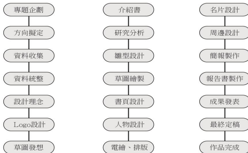
圖 9 流程規劃