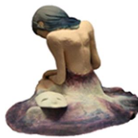
圖 3-2 原稿个