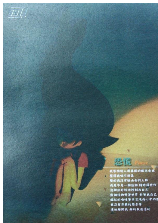
圖 16 恐慌海報