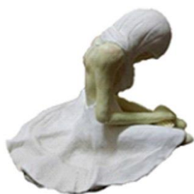
圖 3-1 草圖个

以女生跪坐的姿勢，彎曲的上半身，不讓大家看清他的臉龐也不讓大家發現，他是否哭泣或是高興誰都不知道，只是孤單的待著，反映出來的影子是我們代表性的動物-金魚，選用金魚是因為牠總是在魚缸中優游就像是困在自己的世界中出不來，裙子是利用金魚的尾巴來做裙擺，以紫色的色系作為搭配。