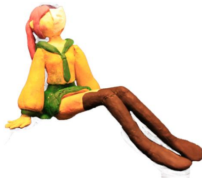
圖 6-2 原稿个