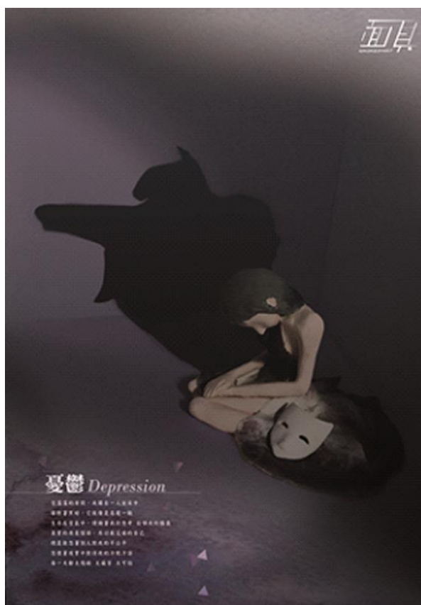
圖 3-3 成品个