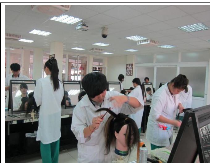
說明 學生比賽情形