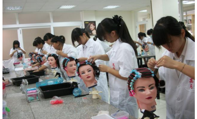
說明 競賽學生進行整髮測時