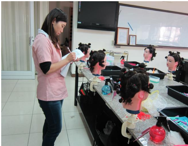
說明 評審老師評分