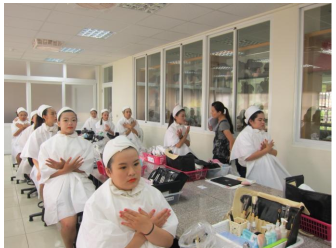
說明 評審老師評分