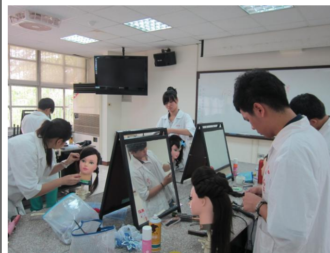
說明 學生比賽情形