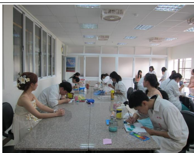
說明 學生比賽情形