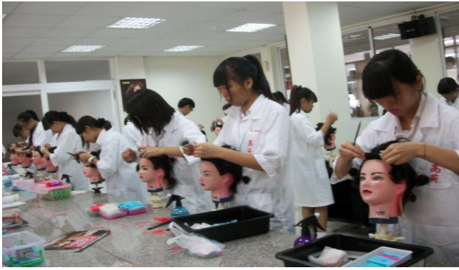
說明 競賽學生進行整髮測時