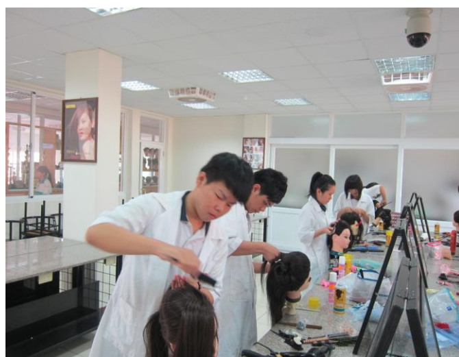
說明 學生比賽情形