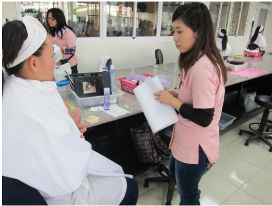
照片說明 教師進行評分