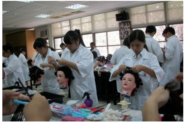
照片說明 學生比賽情形