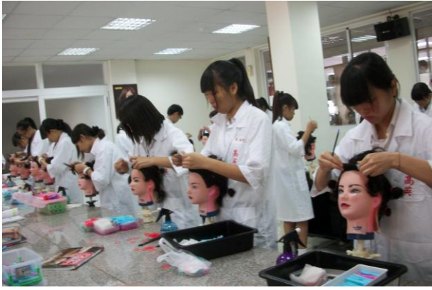
照片說明 學生比賽情形