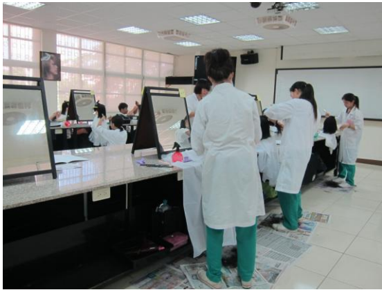
照片說明 教師進行評分