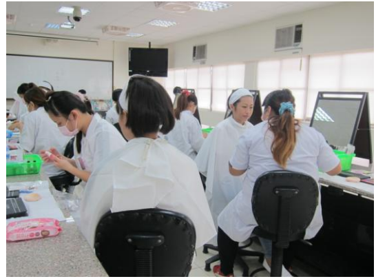
照片說明 學生比賽情形