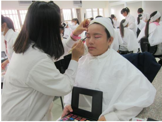
照片說明 學生比賽情形