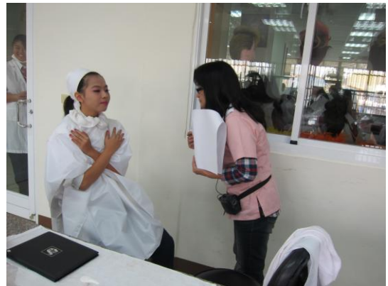
照片說明 教師進行評分