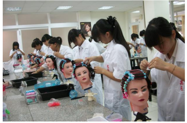
照片說明 學生比賽情形