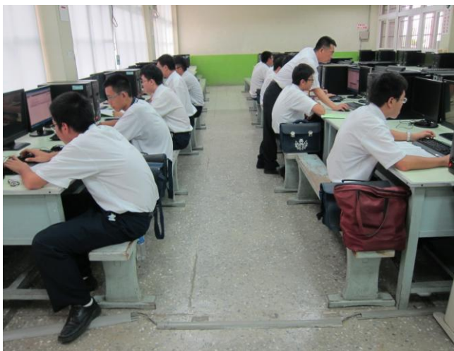
照片說明 學生模擬訓練