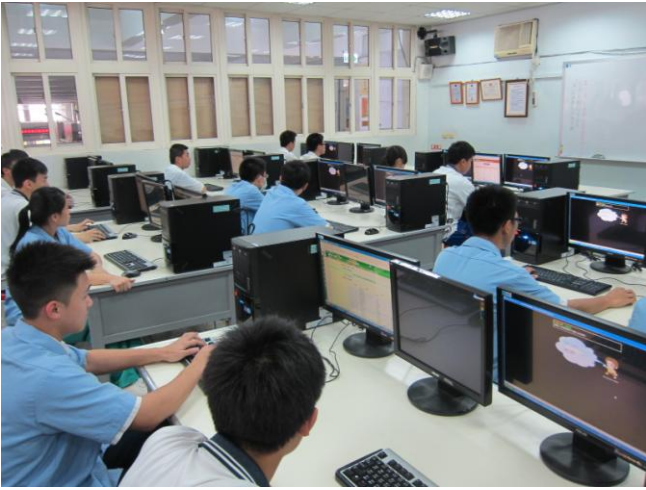
照片說明 技藝競賽學科測試情形