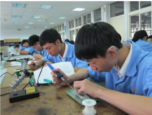
照片說明 二年級術科競賽情形