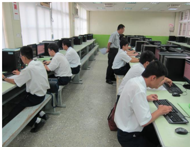
照片說明 學生模擬訓練