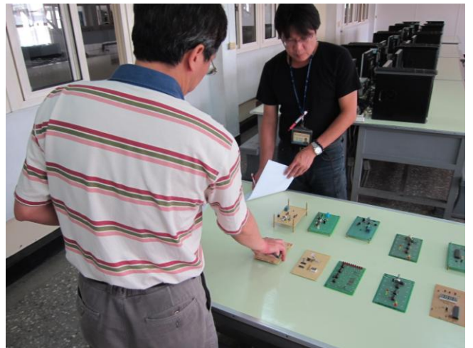
照片說明 教師評分情形