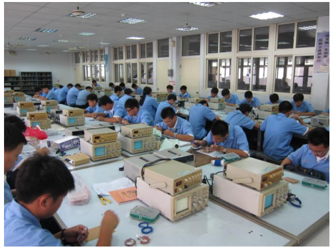
照片說明 二年級術科競賽情形