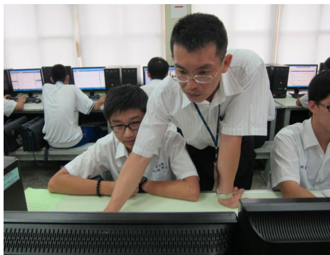
照片說明 主任指導學生練習情形