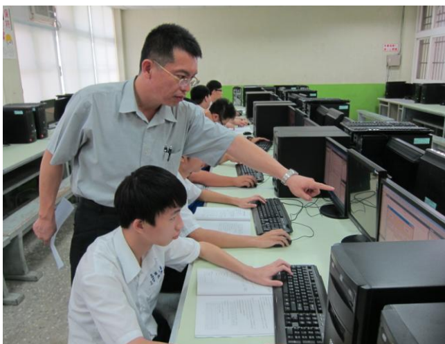
照片說明 主任指導學生練習情形