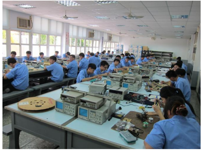
照片說明 一年級術科競賽情形