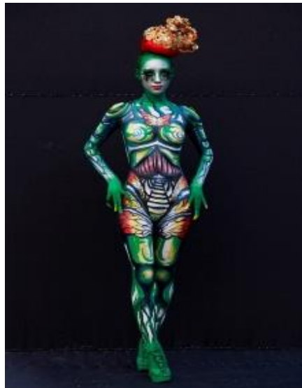
圖 3 火辣驚艷大公財經_大公網