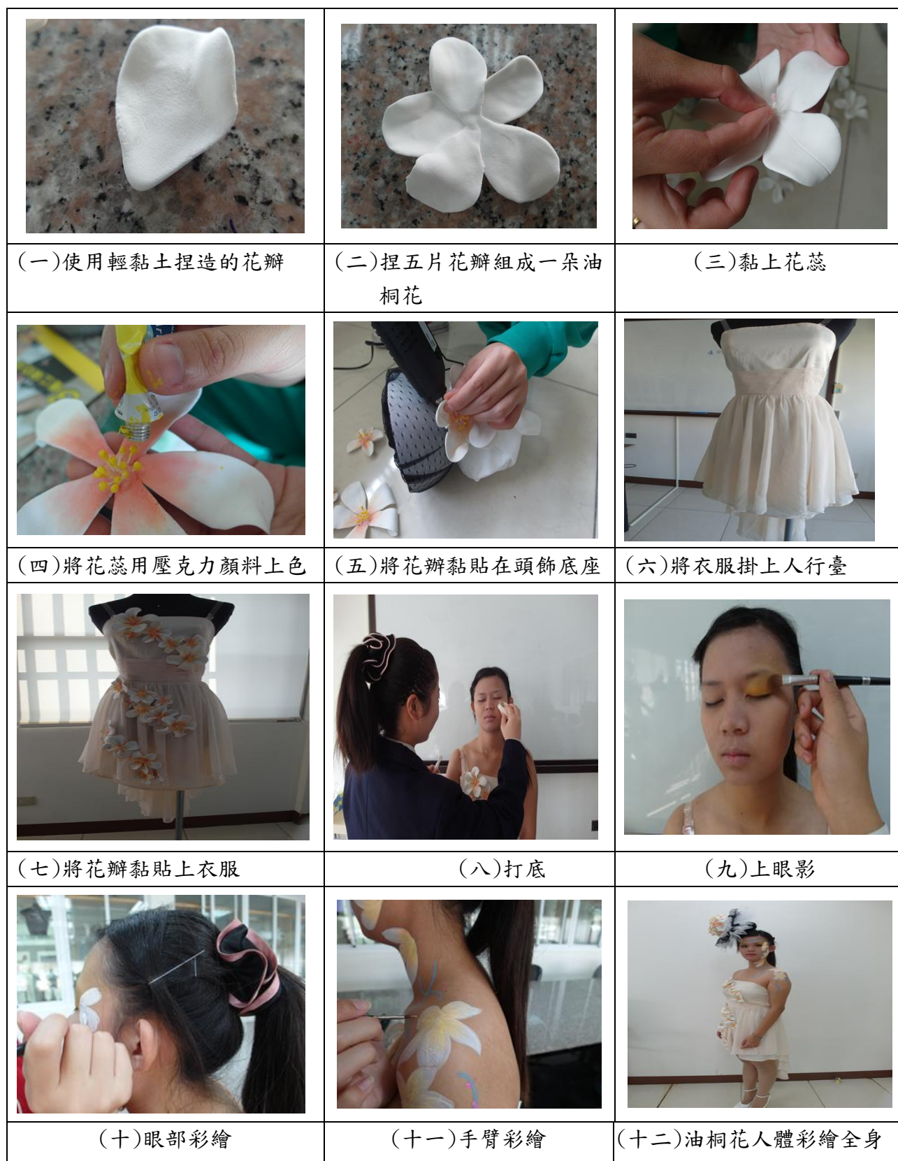
圖 7 製作過程圖