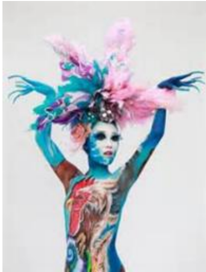
圖 2 火辣驚艷大公財經_大公網

目前人體彩繪約可分為八個種類，較常出現的是商業、戲劇、宗教（如八家將），以及婚紗造型，大部分都是局部性的彩繪居多，因為人體彩繪講求的是強烈的視覺效果，因此像一般的新娘造型，只會採用局部的美化或是用來遮瑕；全身性的整體彩繪造型則會用在戲劇、走秀或是拍攝藝術性寫真方面。