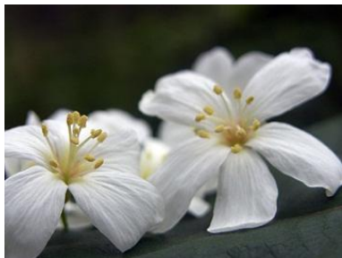
圖 1 土城桐花盛開桐花小百科

油桐花花瓣為白色，基部略帶紅色，花五瓣呈五角星形，雌雄同株異花，雄花花粉經微風一吹就能完成授粉，整朵雄花就掉下來了，因此樹下通常看到整朵 5 瓣的油桐花是雄花，雄花具八至十支雄蕊，雄蕊為紅色，花粉為黃色，故油桐花色，白花之中仍透著淡紅與粉黃色。油桐花的雌花形狀較大，通常生長在同株的上方較安全的位置，雌花僅掉落 5 個花瓣，因身負傳宗接代的重責大任，必須保護種子成長，所以約每 3 天掉落一片花瓣，等 5 瓣掉光需 15 天的時間，此時他的種子約像筷子直徑般的大小，就不怕風吹掉落，花房長大即為油桐子，油桐子果實內有種子 3~5 顆，油桐子不能食用，通常在產地加工製成桐油，桐油屬於乾性油，乾燥快，以前在化學原料不太普及的時候，桐油就是油漆工業中的重要原料，其防水性很好，以往常被用來塗在船身外殼，會當作油紙傘的原料，另外桐樹本身可供建築之用、防腐材、樂器用材等。而油桐子的用途也很廣，然不能食用，所以遊客在欣賞油桐花的同時，千萬小心別因其外表很像花生而誤食。