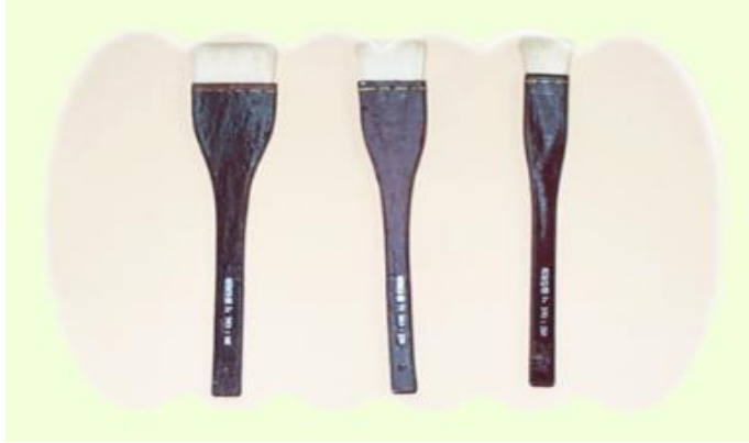
圖 5 大排刷

平塗筆：平塗筆因較有彈性(類似敷面刷的那種毛質)，所以一般利用平塗筆來畫人體彩繪會較好推抹出勻種而漂亮的色彩，各類型的筆刷適自己需要的大小，數量去選購，建議一種顏色只用一支筆刷，顏色才不致互相干擾，髒污。