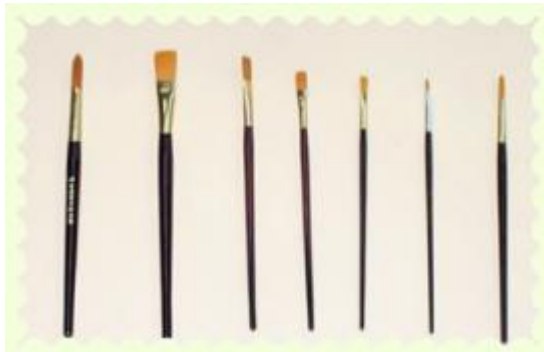
圖 6 平塗筆（教育部數位教學資源入口網）

平塗筆：平塗筆因較有彈性(類似敷面刷的那種毛質)，所以一般利用平塗筆來畫人體彩繪會較好推抹出勻種而漂亮的色彩，各類型的筆刷適自己需要的大小，數量去選購，建議一種顏色只用一支筆刷，顏色才不致互相干擾，髒污。