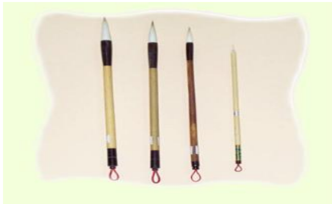
圖 4 圭筆（教育部數位教學資源入口網）

圭筆：也可作為最小最細的毛筆，通常使用在較細緻的線條上，須勾勒出完滿的結構，在結束處用圭筆描畫，畫龍點睛的效果。