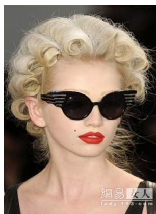
圖 5-2 貓眼型眼鏡