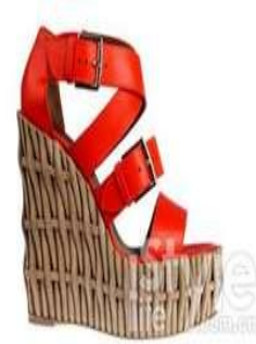
圖 5-20 厚底松糕鞋