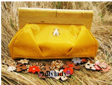
圖 5-4 手拿包

如網紗綴飾珠花及亮片的小提包、繡花手拿包或 CHANEL 經典的菱格紋包等，至於包包的呈現則相當多樣。