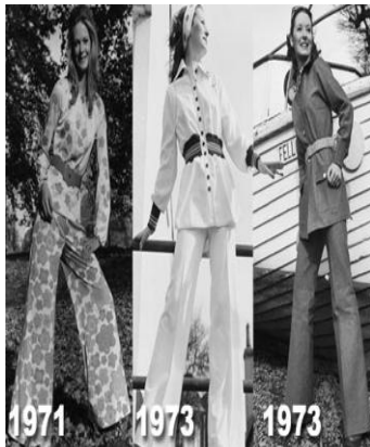
圖 4-9 喇叭褲