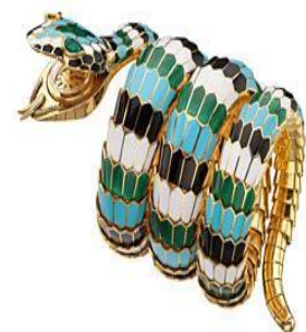
圖 5-12 寶石臂飾