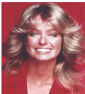
圖 2-7 波浪捲髮

70 年代崇尚個性的釋放。在德國包豪斯建築美學的強烈影響下，將這種建築結構移植到髮型創意上：重重的劉海、不對稱的髮際以及階梯式的落差，讓秀發濃郁了獨特的建築形態。70 年代是色彩時代的開端，這個時期的發明了挑染和片染技術，稍帶誇張的色彩躍躍欲試。棕與紅被率先用至其中，營造了三維的造型效果，線、結構與幾何形狀成為了影響創意與靈感的三大元素，1970 年代的招牌髮型新嬉皮士髮型-中分式直髮造型、精心打造的手工彈力捲髮、Big Tease 蓬鬆高發髻-高聳上沖式盤髮，以及波西米亞風潮-大塊絲巾裝飾、彈力波浪卷-花園少女捲髮、希臘女神氣質盤髮，1974 年流行筷子燙及香菇頭的髮型，1977 年流行羽毛剪造型的髮型。