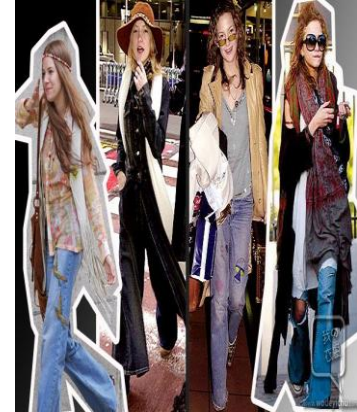
圖 4-11 民族風