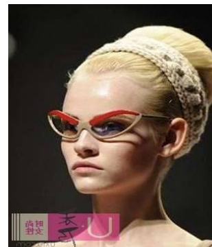
圖 2-3 包頭