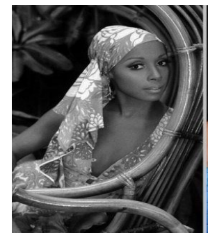
圖 2-9 波西米亞風