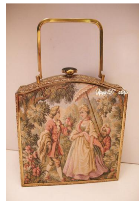
圖 5-6 仕女手挽包