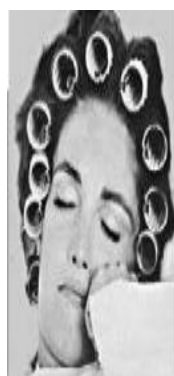
圖 2-1 捲髮

吹起嘻皮風，長直髮成為反戰年輕人的標誌，上圓髮尾外翹的 omega 頭、俏麗復古捲髮、鮑伯頭、俐落不對稱的沙宣留海頭等當時都很流行。