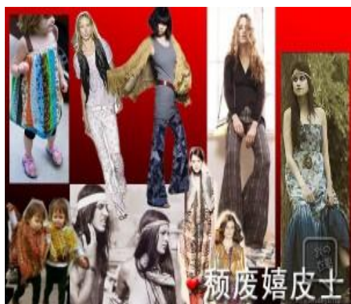
圖 4-5 嬉皮風格