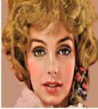
圖 3-4 假雙眼皮妝容