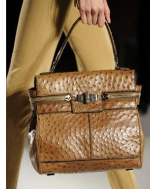
圖 5-17 動物紋手提包