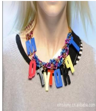
圖 5-11 塑料項鍊