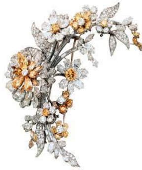
圖 5-14 彩鑽胸針