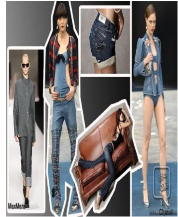
圖 4-8 牛仔風