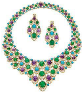
圖 5-13 寶石項鍊