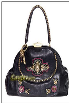
圖 5-5 繡花包