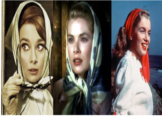
圖 5-3 經典時尚絲巾造型

正像優雅女神奧黛麗·赫本所言，“當我戴上絲巾的時候，我從沒有那樣明確地感受到我是一個女人，美麗的女人。”絲巾時尚經典，優雅塑造唯美浪漫。