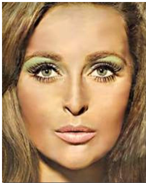
圖 3-1 眼皮塗滿眼影

雖然不像 1950 年代那麼鍾情於大紅色的唇膏，顏色極淡的唇膏，甚至也有銀白色唇膏的出現，但經常被使用的色彩尚還不脫離「紅」。這個時期較常見的顏色，有珊瑚紅、橘紅、洋紅等色