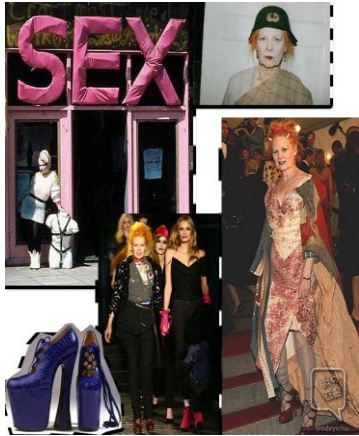
圖 4-6 嘻皮風