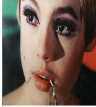
圖 3-5 烟薰妝