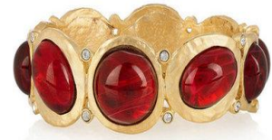
圖 5-23 寶石手鐲