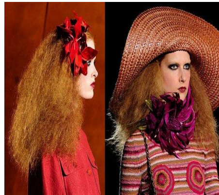
圖 5-25 花朵配飾