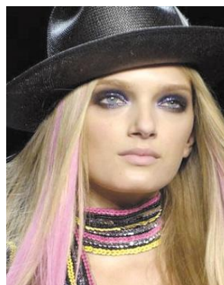
圖 3-8 朋克煙燻妝