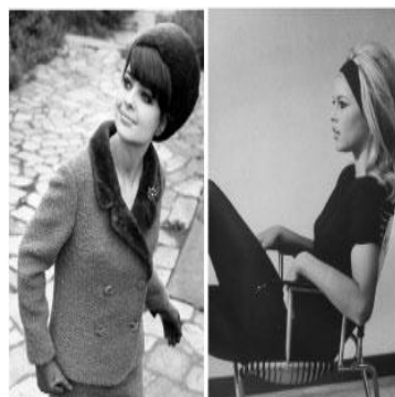
圖 2-2 包柏頭