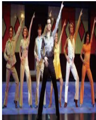
圖 4-10 阿哥哥流行風