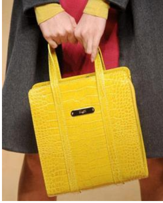
圖 5-15 箱式手提包