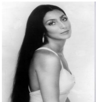
圖 2-8 中分直髮