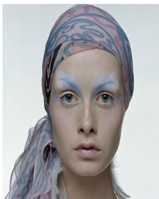
圖 3-6 眉與眼線淡化妝