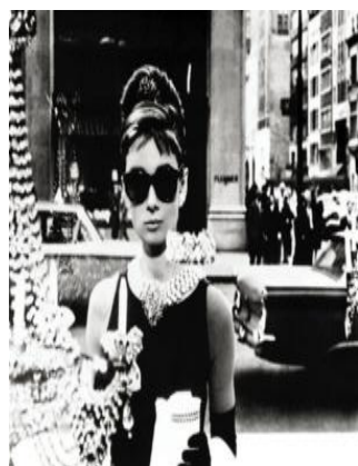
圖 5-1 塑膠框大眼鏡

從搖滾明星到電影明星，60 年代的美人們似乎十分青睞這種帶著一點角度的墨鏡，無論是優雅的代表還是革命派的先鋒，它都能遊刃有餘，作為 60 年代流行符號中的一員，它倒是能佔據一席之地，展現時髦膠框寬版眼鏡、大尺寸的太陽眼鏡，都是搭配的重要配件。