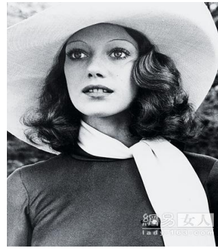
圖 2-11 彈力波浪卷