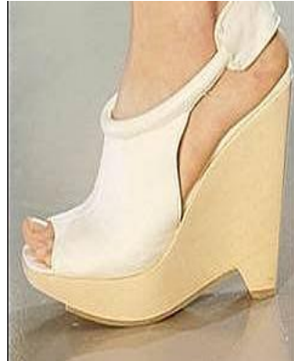
圖 5-8 厚底鞋