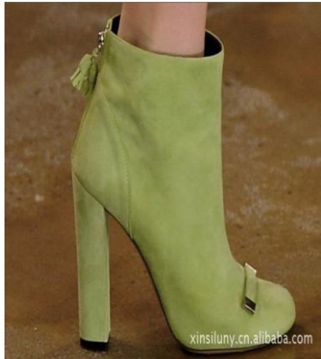
圖 5-7 踝靴

60 年代深受現代派繪畫影響，方跟及踝靴、露趾高跟鞋和船型厚底涼鞋都曾風靡一時在簡約中強調線條與色彩之美。