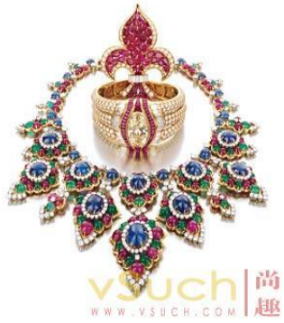
圖 5-21 寶石項鍊