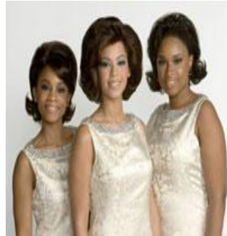
圖 2-5 omega 頭