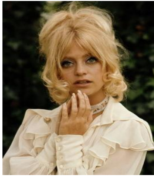
圖 2-10_Big Tease 蓬鬆高發髻