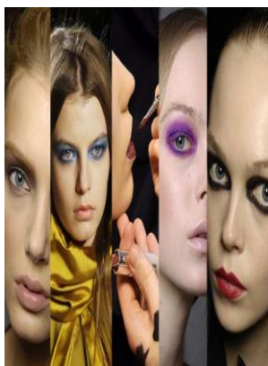
圖 3-7 美型唇妝