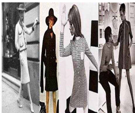
圖 4-3 香奈爾風