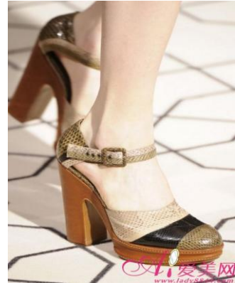
圖 5-9 方跟鞋