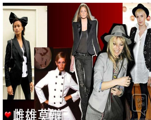
圖 4-4 中性風