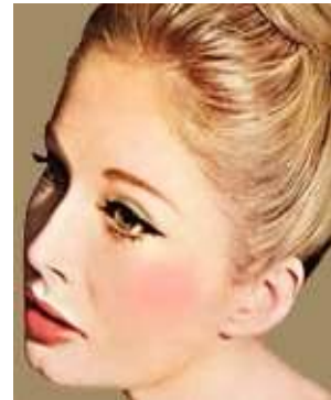
圖 3-3 芭比娃娃妝容