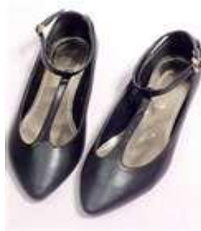
圖 5-19 丁字鞋