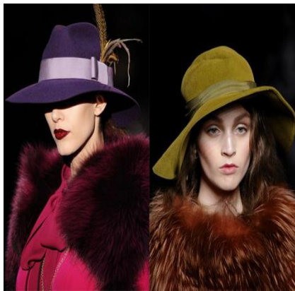
圖 5-24 寬檐帽

大熱款式配件：寬版皮帶、帽子或者帶著羽毛及皮製物品，這些都是 70 年代永恆不變的風格！