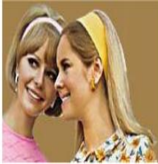
圖 2-4 直髮