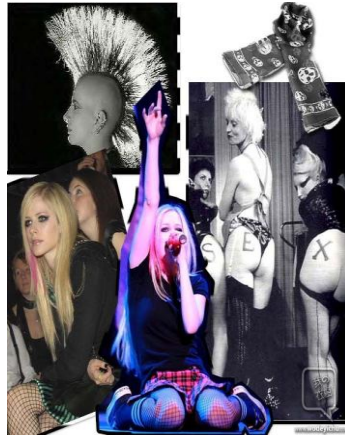
圖 4-7 頹廢龐克風