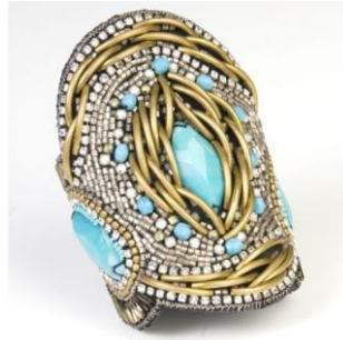
圖 5-22 寶石臂環