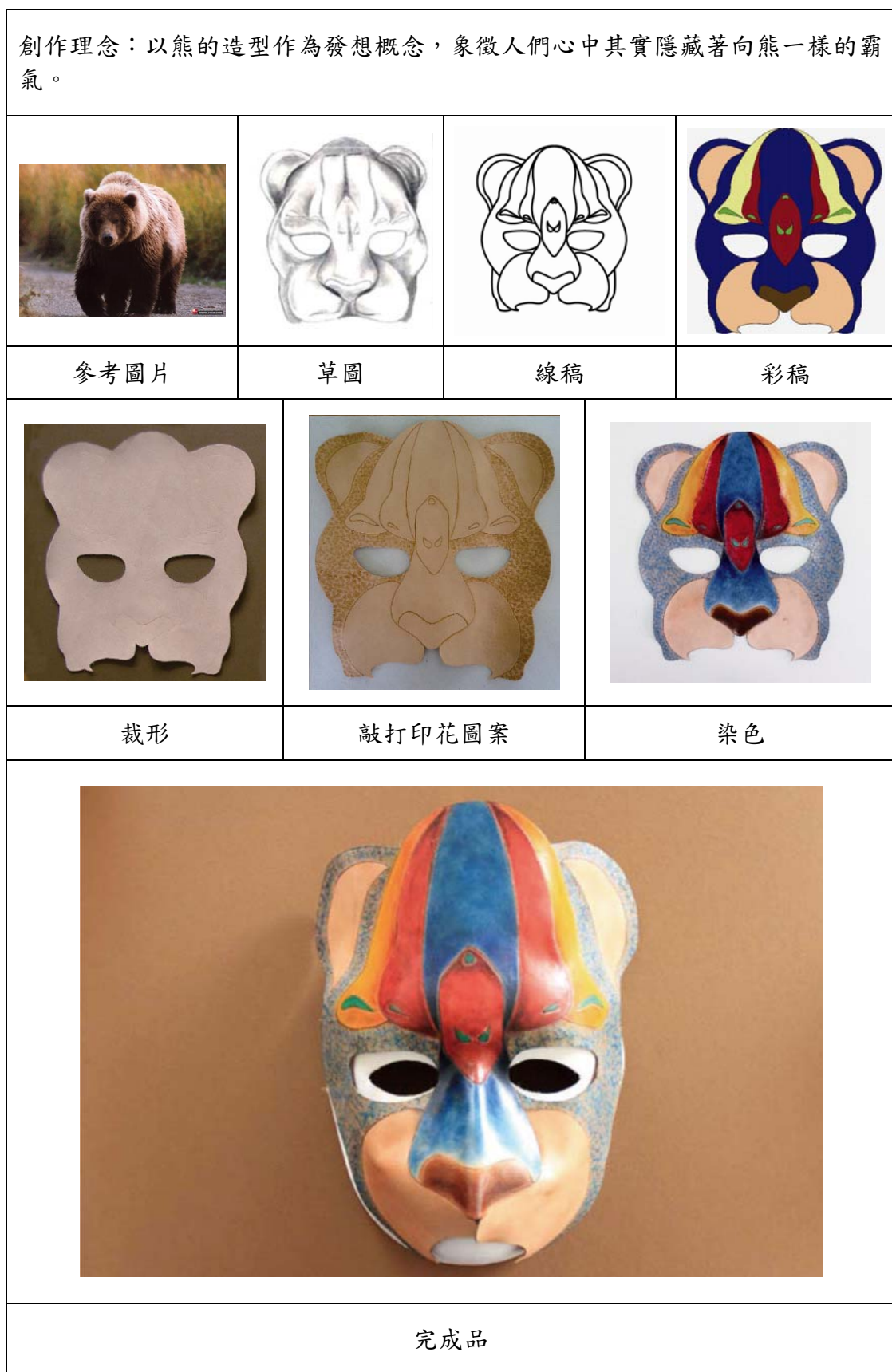
表5 熊面具製作發想流程