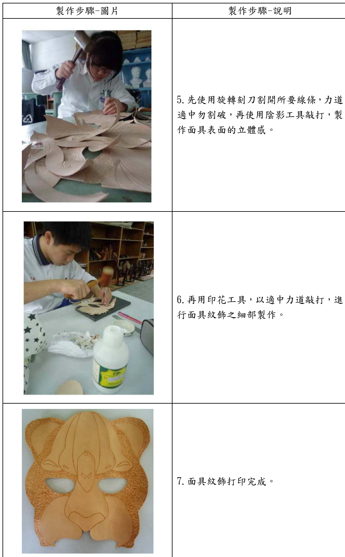
表 8 製作流程-紋飾打印