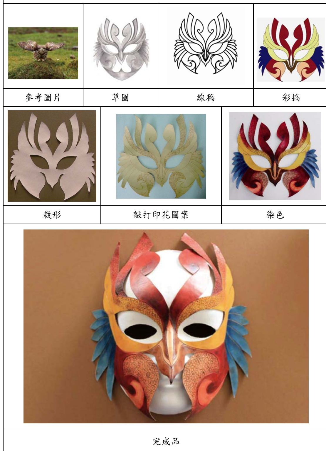
表6 鳥面具製作發想流程