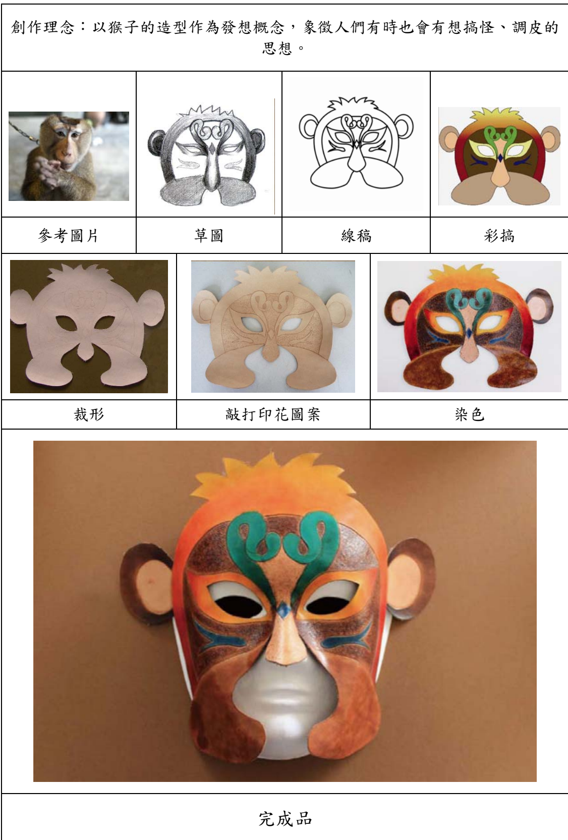
表4 猴子面具製作發想流程