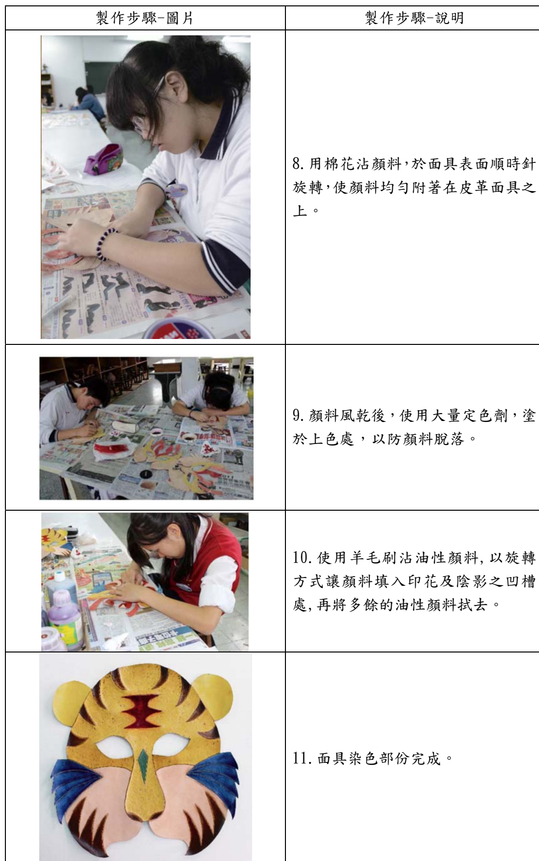
表 9 製作流程-面具染色