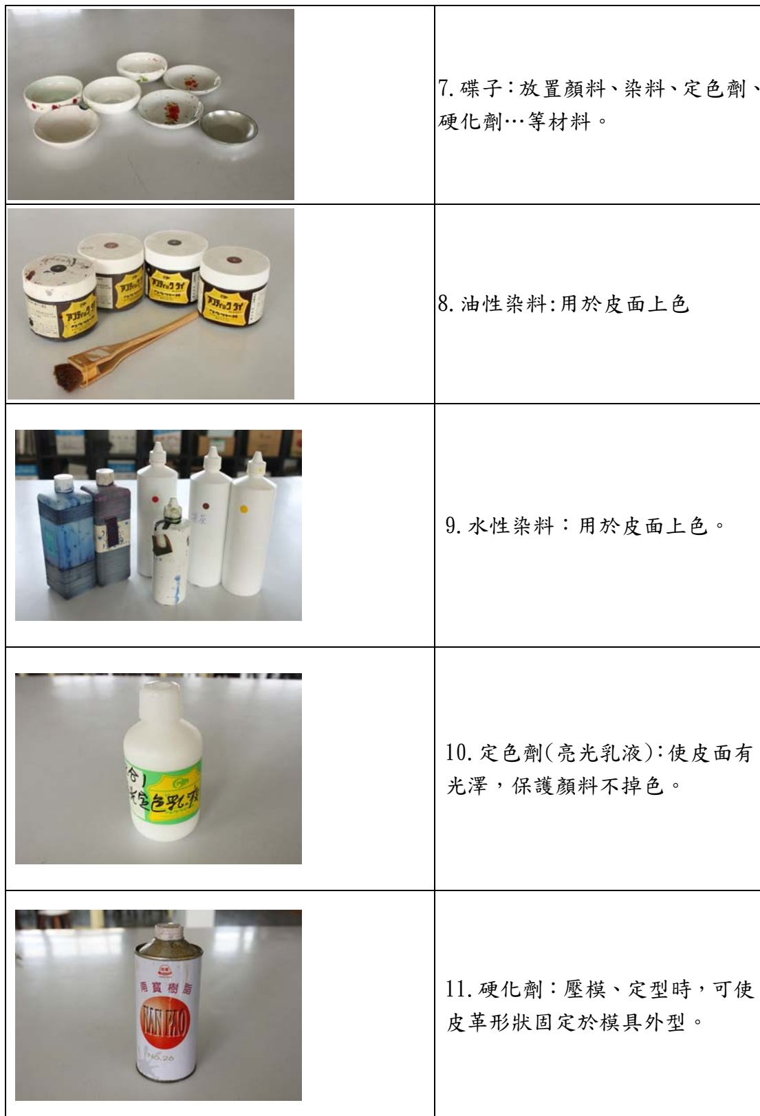
表 2 皮雕製作工具介紹