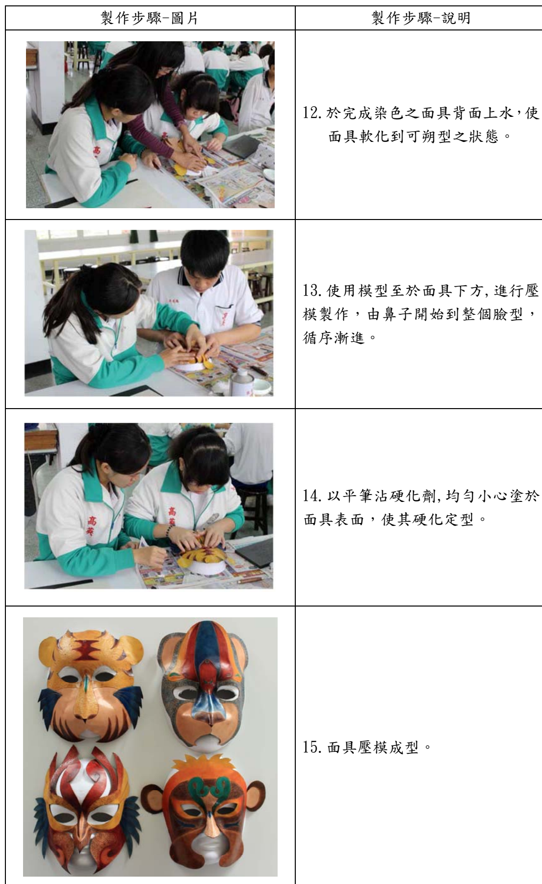
表 10 製作流程-壓模成型