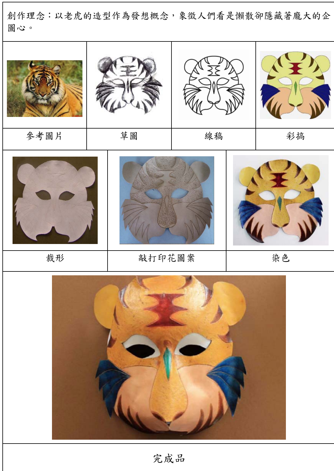
表3 老虎面具製作發想流程