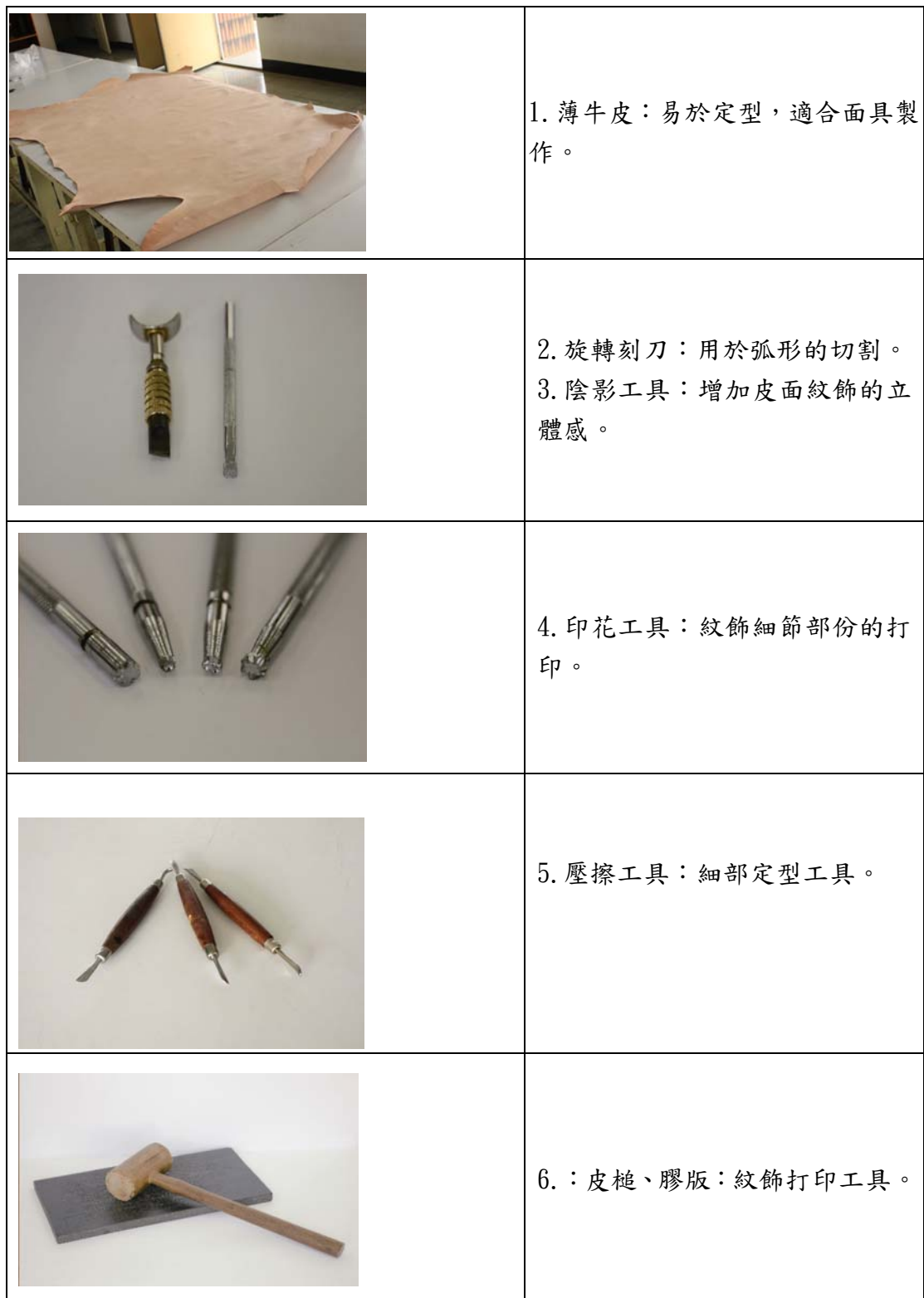
表 2 皮雕工具介紹