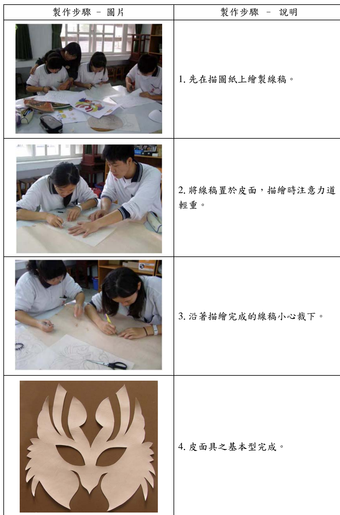
表7 製作流程-基本型