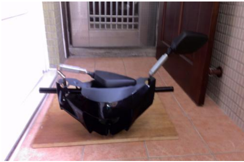
圖14 伸縮後照鏡成品