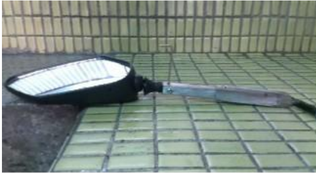
圖 9 伸縮後照鏡