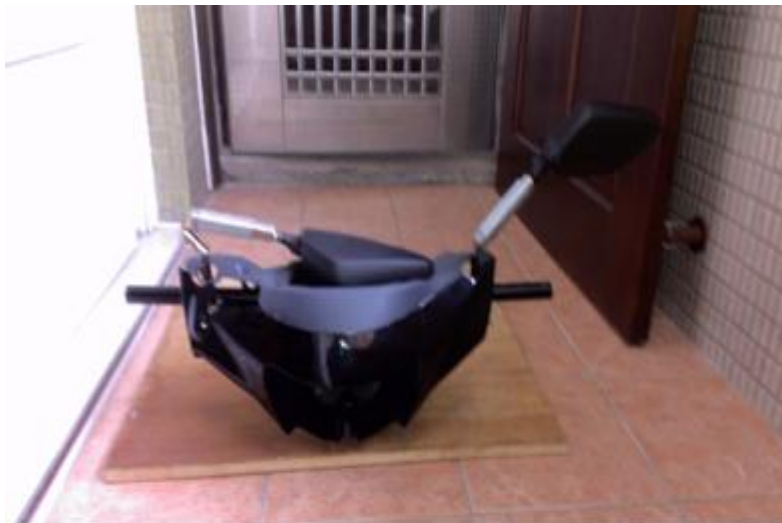
圖16 伸縮後照鏡模型

本組將後照鏡切斷，在與我們製作鐵的伸縮管結合的，右邊能伸縮，但左邊的可以往內凹放在儀表板上面，儀表板有海綿墊著不會受到後照鏡得衝擊，而不會使後照鏡或儀表板損壞或破裂。