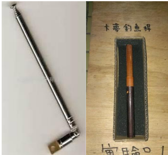
圖2 天線與卡夢釣魚竿