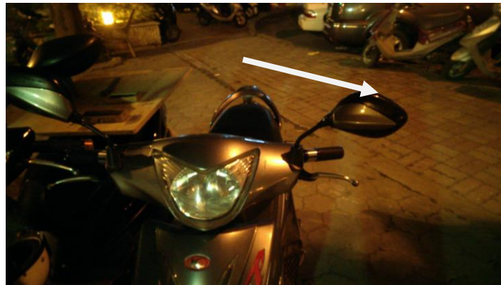
圖7 停車時後照鏡相撞的情形

(二)後照鏡停車時的不便:有些人停機車時都會硬擠，造成後照鏡想狀或損壞，也會造成人行走而勾到後照鏡而摔倒