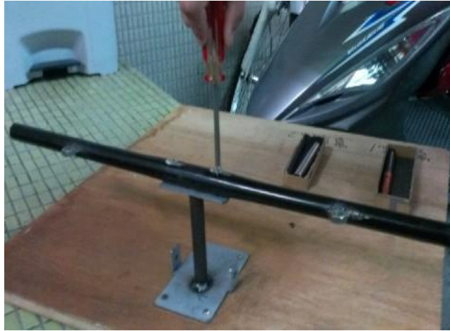
圖 11 將手把鎖緊