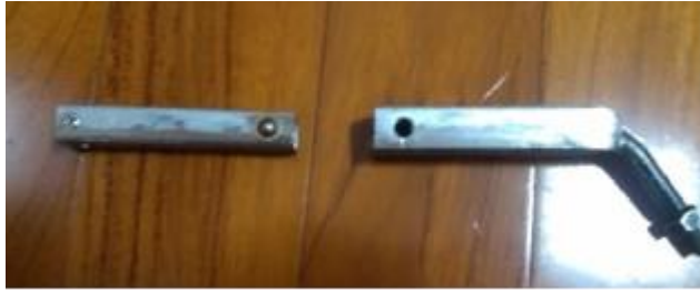
圖 8 伸縮後照鏡