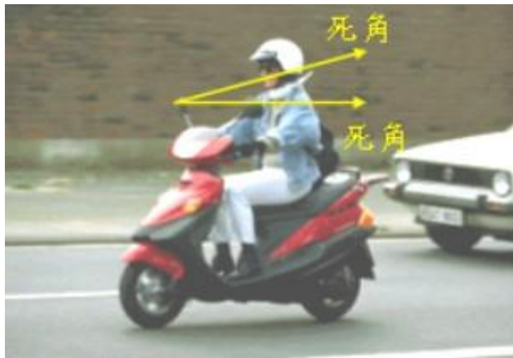
圖5 機車後照鏡的死角