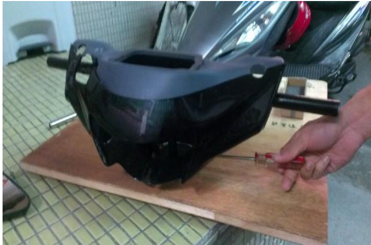
圖12 將龍頭外殼鎖上