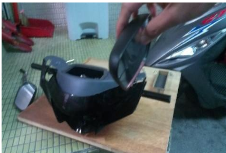
圖 13 鎖上後照鏡