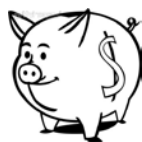
私校退撫儲金(新制)-自主投資 112年度1月~3月期間報酬率

3. 資料來源：財團法人中華民國私立學校教職員退休撫卹離職資遣儲金管理委員會網站公告資料。