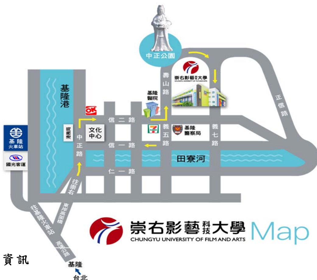
附件 8：崇右影藝科技大學位置圖