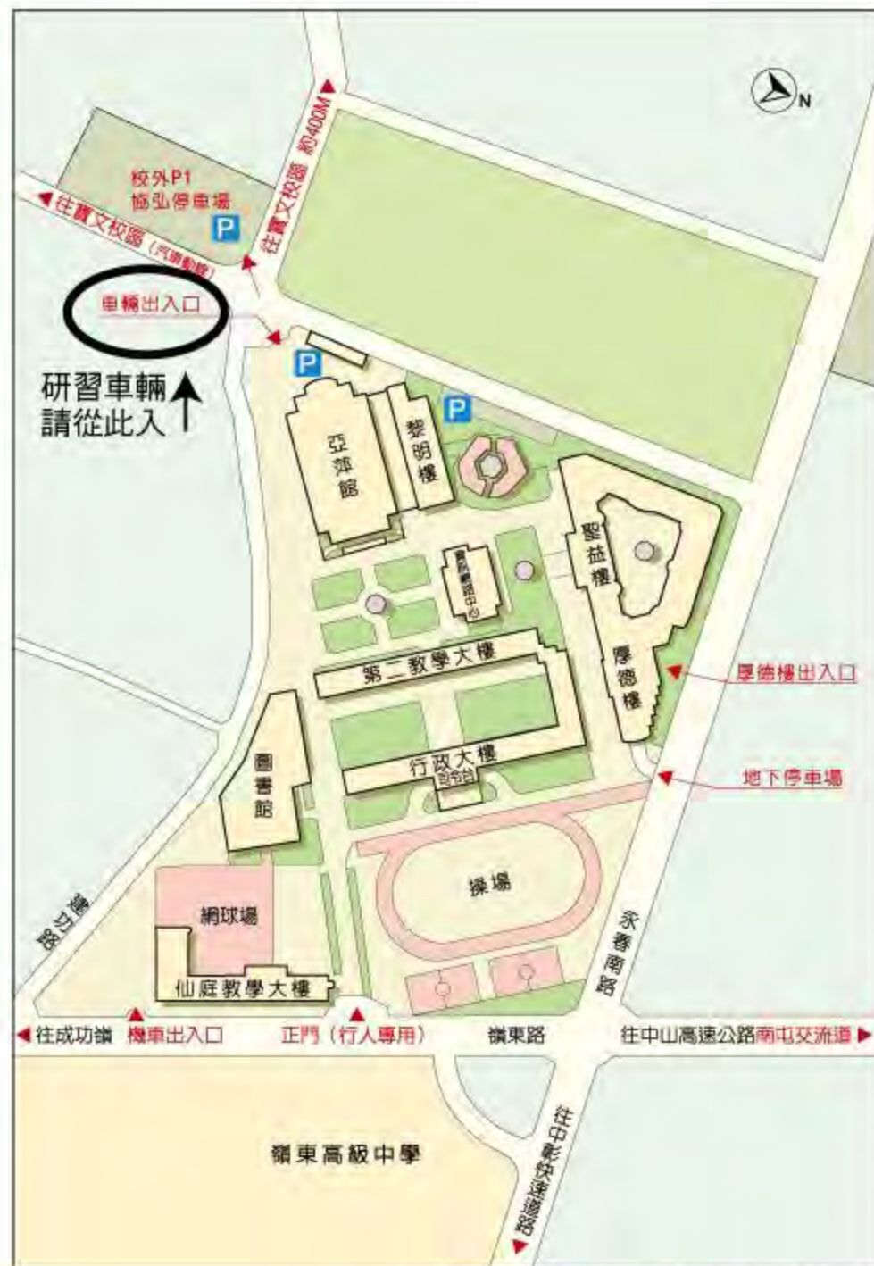
嶺東科技大學春安校區平面配置圖

嶺東科技大學 春安校區 104年1月10日 (星期六) 流行設計系 聖益樓2樓 服飾工藝教室 SY209