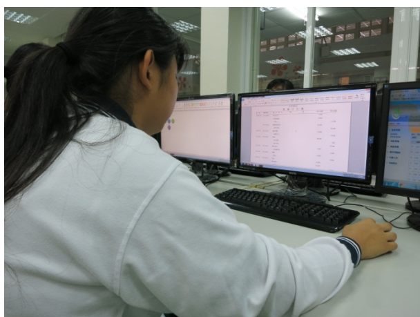
電腦化登錄傳票成果